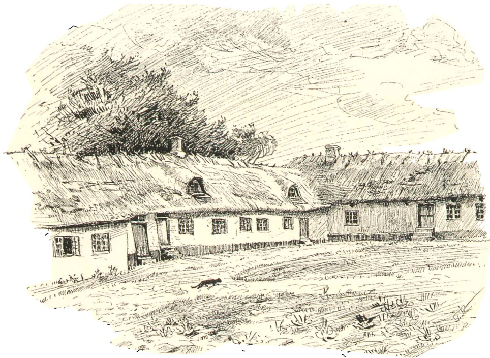
Sidelænge i Udby Præstegaard med Kapellanboligen. (Tegnet af Tom Petersen).