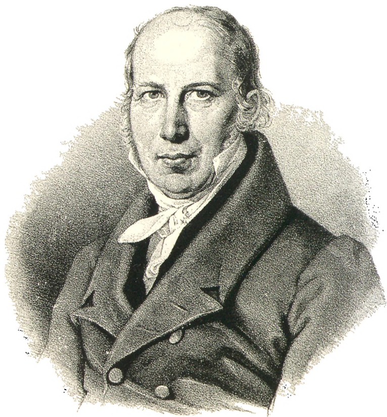
N. F. S. GRUNDTVIG (Efter Maleri af C. A. Jensen, 1831).