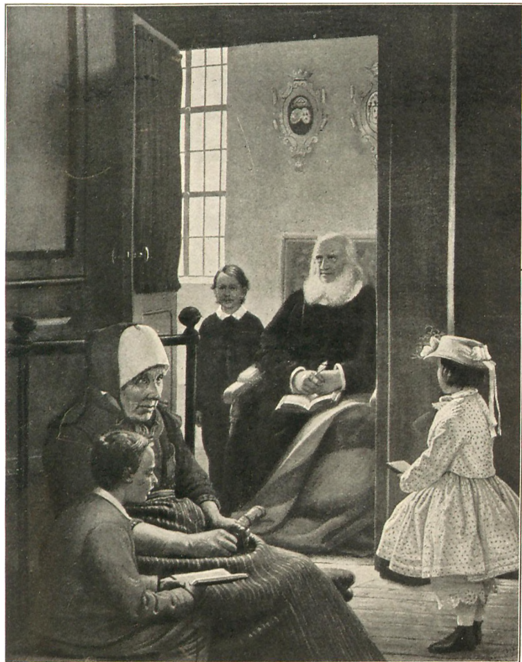
Grundtvig i Vartov Kirke under Salmesangen med sin Søn Frederik ved Siden. (Efter Maleri af Dalsgaard).