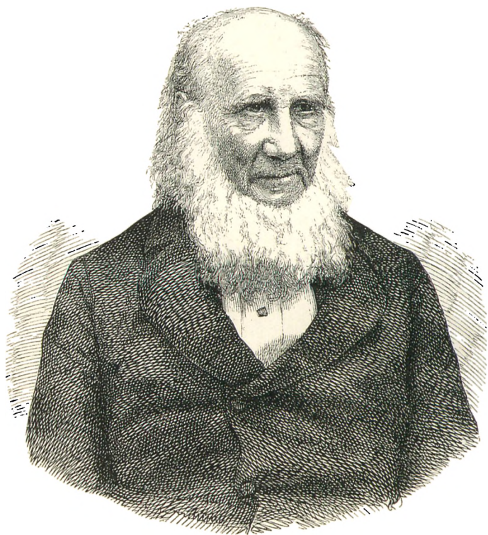
GRUNDTVIG SOM GAMMEL