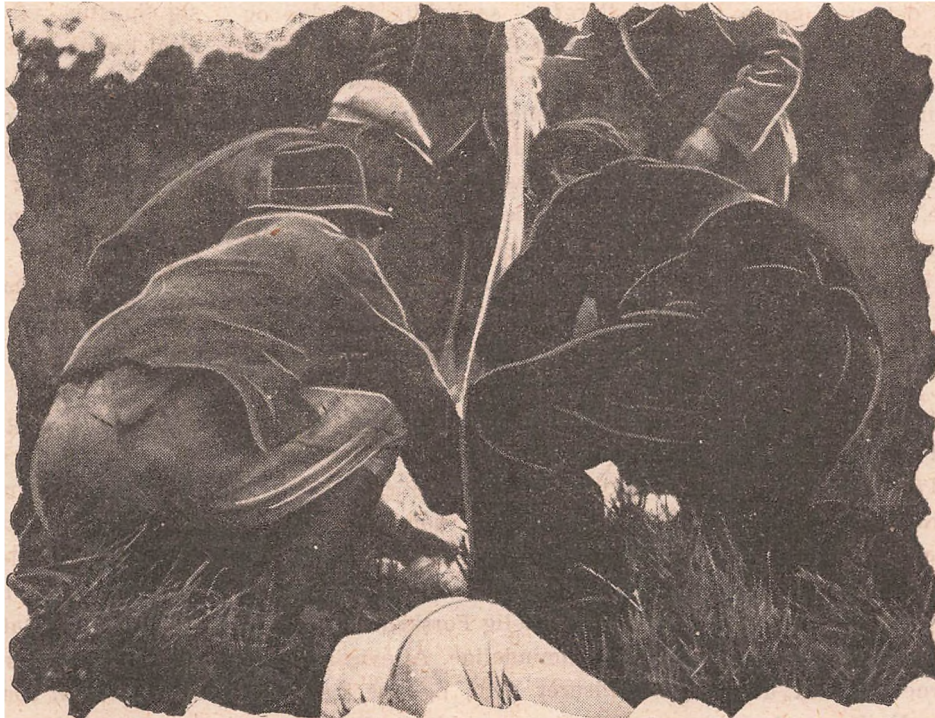
Illegal Vaabenmodtagelse i Jylland. Med Livet som Indsats tilkæmpede Frihedskæmperne sig Retten til Vaabnene.

res Kammerater, storartede unge Mennesker, som baade Farmoderen og vi andre i Samfundet kan være stolte af. Der havde netop igen lydt et Krav om Aflevering af Vaabnene, og det kan ikke nægtes, at det havde virket noget ophidsende paa disse Gutter. De opfriskede Minder fra den »illegale«