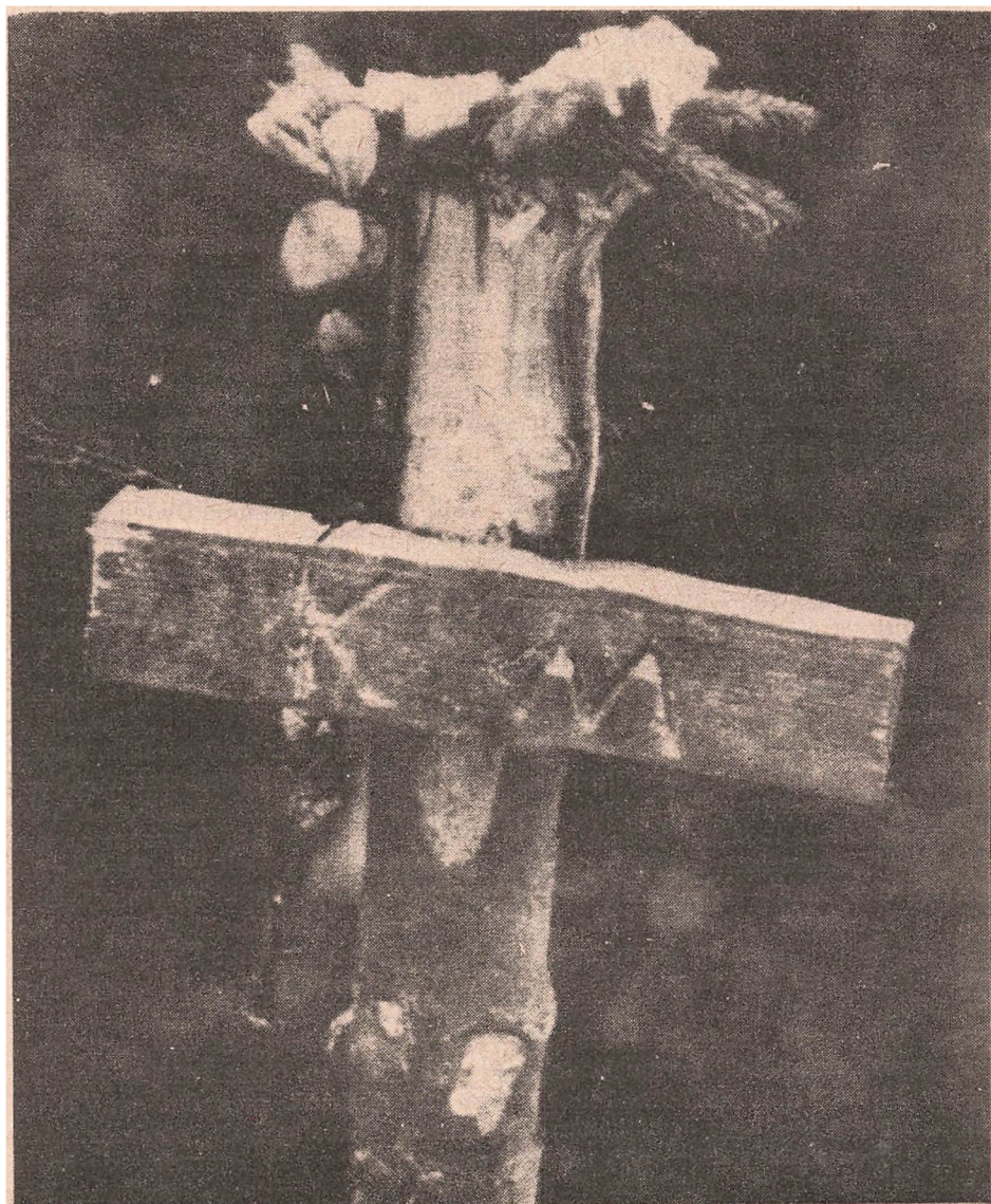
Kaj Munks Mindekors i Hørbylunde.

At Uenigheden om ham atter viser sig, at megen Omtale stadig har Karakter af Bekendelse, vidner om det stærke og foruroligende ved hans Aand. En Sekt med trekantede Brilleglas gør