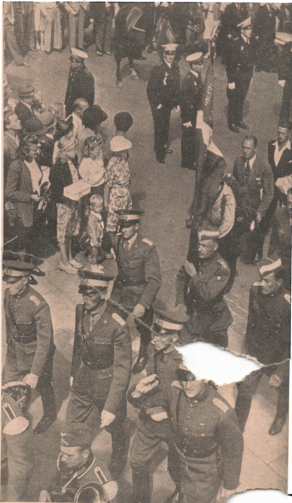
Fra Frikorpsfolkenes Paradetur gennem København i 1941. I Sprog af de Officerer, der tilsluttede sig Frikorps Danmark.