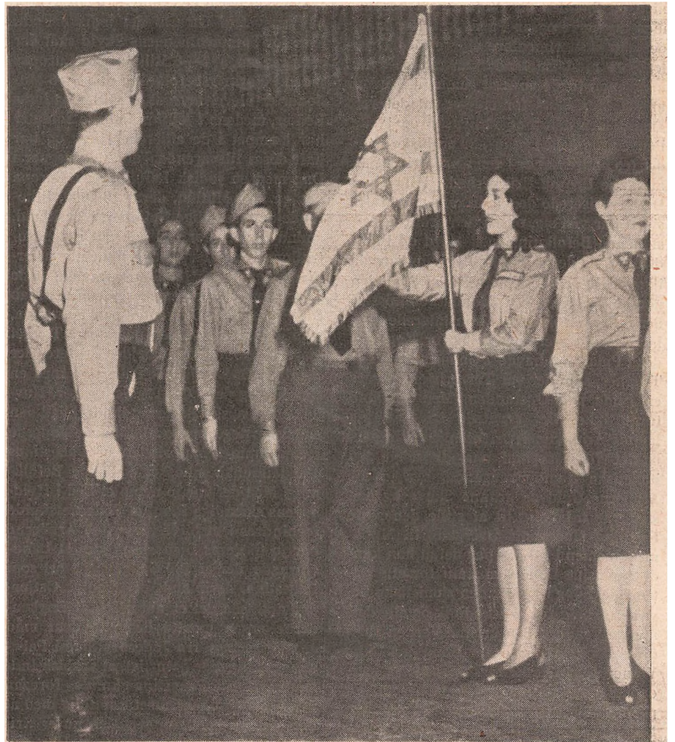
I New York er der i denne Maaned oprettet en privat Trænings-Skole for zionistiske Officerer, der ønsker at tilslutte sig den jødiske Frihedsbevægelse.

Fuld af Undren iagttag den store Verden, hvorledes Omskabelsen fra kuet Paria-til fri Bonde fuldbyrdes med disse unge Jøder. Og med Begejstring fulgte man Koloniseringen af Landet paa alle de Omraader, hvor Palæstinas Genrejsning krævede Initiativ og Indsats. Universitetet i Jerusalem indviedes allerede i 1925 og var for Verden et Vidnesbyrd om, at den jødiske Aand ogsaa under de nye Forhold vilde være ved Værket, blot med den Nuance, at den nu vilde virke under eget Firmanavn, og over hele Landet bredte sig et Net af Skoler og Sygehuse, af sociale og kulturelle Institutioner, der uden Smaalighed stilledes ogsaa i den arabiske Befolkningsdels Tjeneste. Spalte op og Spalte ned kunde man skildre denne Pa-