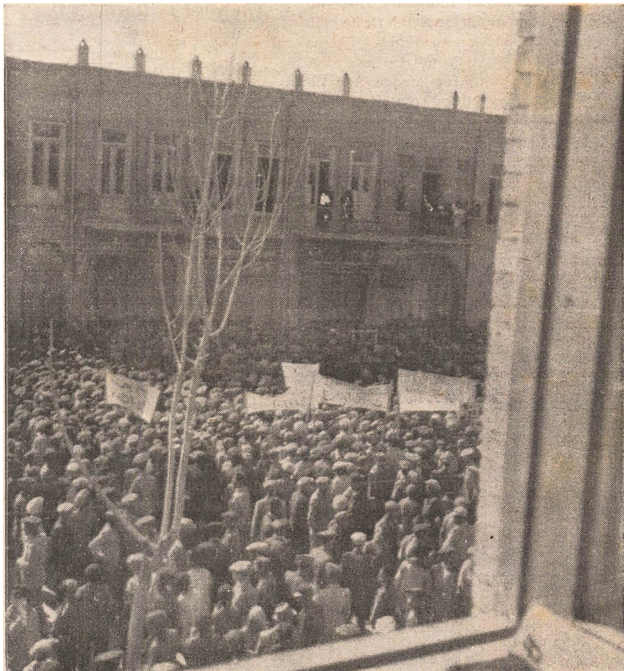
»Tudeh« demonstrerer i Tabriz.