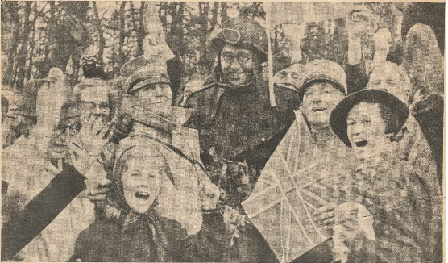
Den første engelske Motorordonnans kommer til Grænsen ved Krusaa og modtages med Jubel af Befolkningen.

N u da Krigen for vort Vedkommende er forbi, staar ogsaa vi foran Opgøret med Tyskland, og ligesom Angrebet og Truslen mod vort Land har været altomfattende, vil ogsaa Afslutningen faa Karakter af et Generalopgør, hvorunder alt, som bestemmer det fremtidige Forhold til Tyskland, tages i Betragtning, derunder ogsaa Spørgsmaalet om vor Sydgrænse og om de nationale Mindretals Stilling.