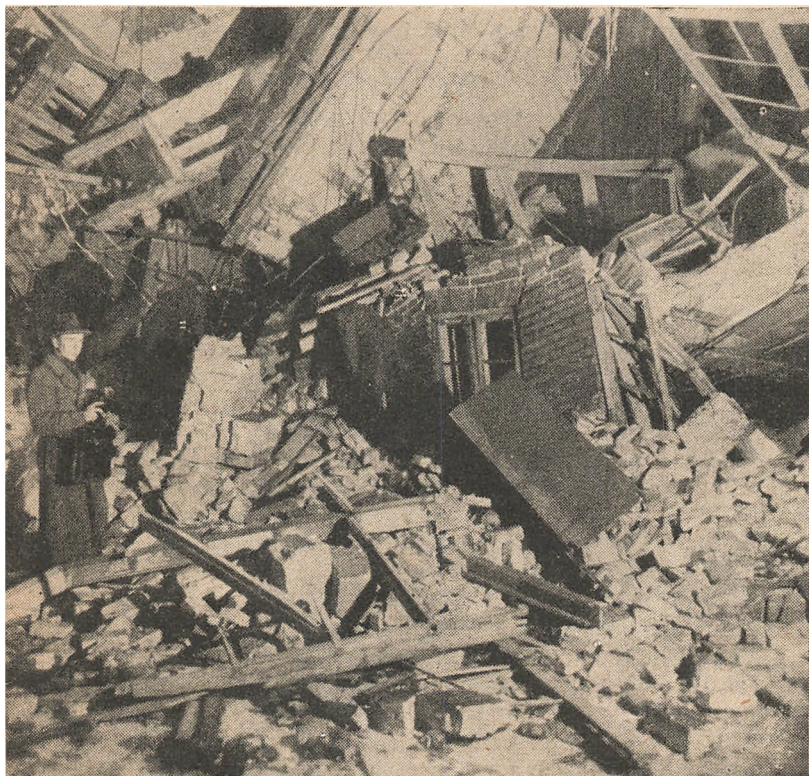
Sabotage paa Andersens Radiofabrik, H. C. Ørstedvej.

moralske Virkninger. Det Forhold, at det ikke var Besættelsesmagten selv eller en lille Klike Landsforrædere, men derimod vore »egne« lovlige etablerede politiske og administrative Organer, som gennemførte de alvorlige Brud paa Folkestyrets Traditioner, maatte nødvendigvis bidrage til at svække Befolkningens demokratiske og nationale Aand. Den officielle Linje modvirkede Betæneligheder ved at stille sig til Besættelsesmagtens Disposition med Leverancer og Arbejdskraft. Regeringernes Udtalelser bidrog til at svække Folkets Fornemmelse af Krigens dybeste Problem: Kampen mellem autokratisk Diktatur og Demokrati. Myndighedernes energiske Forholdsregler overfor enhver, som handlede mod Tysklands Interesser og de stædige Opfordringer til »Opretholdelse af Ro og Orden« svækkede Befolkningens Kampkraft. Baade i offentlige Udtalelser og i interne Partiinformationer gik man stærkt i Rette med Modstandsbevægelsen og benyttede herved en Sprogbrug (»Komministre og Chauvinister« etc.), som laa betænkeligt nær op ad den nazistiske. Samtidig med at Politi og Domstole blev sat ind overfor dem, der vilde deltage i Krigen mod det nazistiske Diktatur, tilføjede Indrømmelsespolitikens Tilhængere gennem deres aandelige Paavirkning det demokratiske Sindelag endnu større Skade. Det forberedte Jordbunden for den direkte og fuldtone nazistiske Agitation, som den siden — efter 29. August — fik Lejlighed til at udfolde sig.