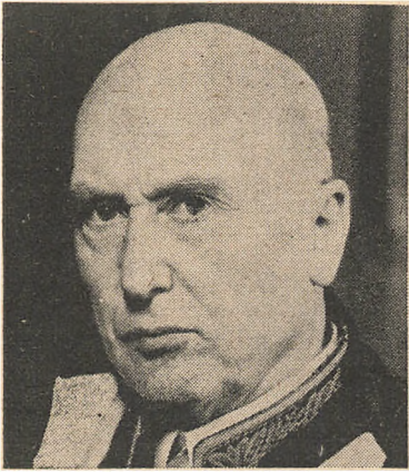
Forhenværende Højesteretspræsident Troels G. Jørgensen.