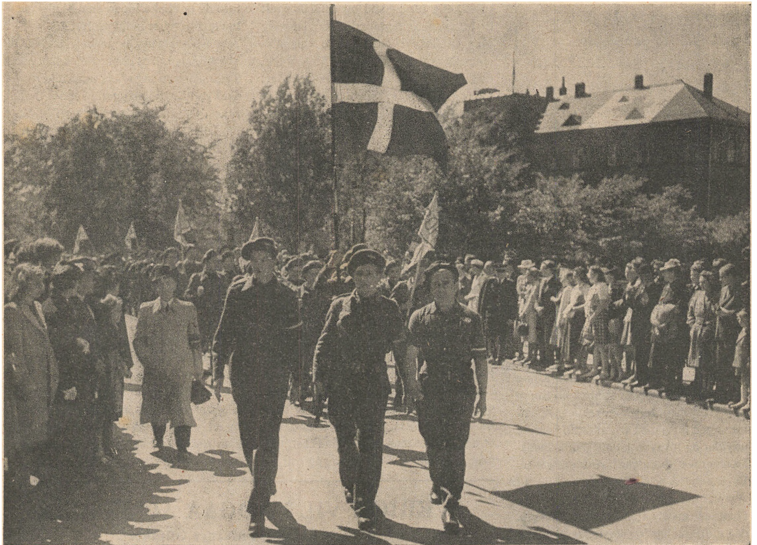
Den danske Ungdom marcherer. — Sabotører paa Vej til Paraden i Ryparken for General Görtz.