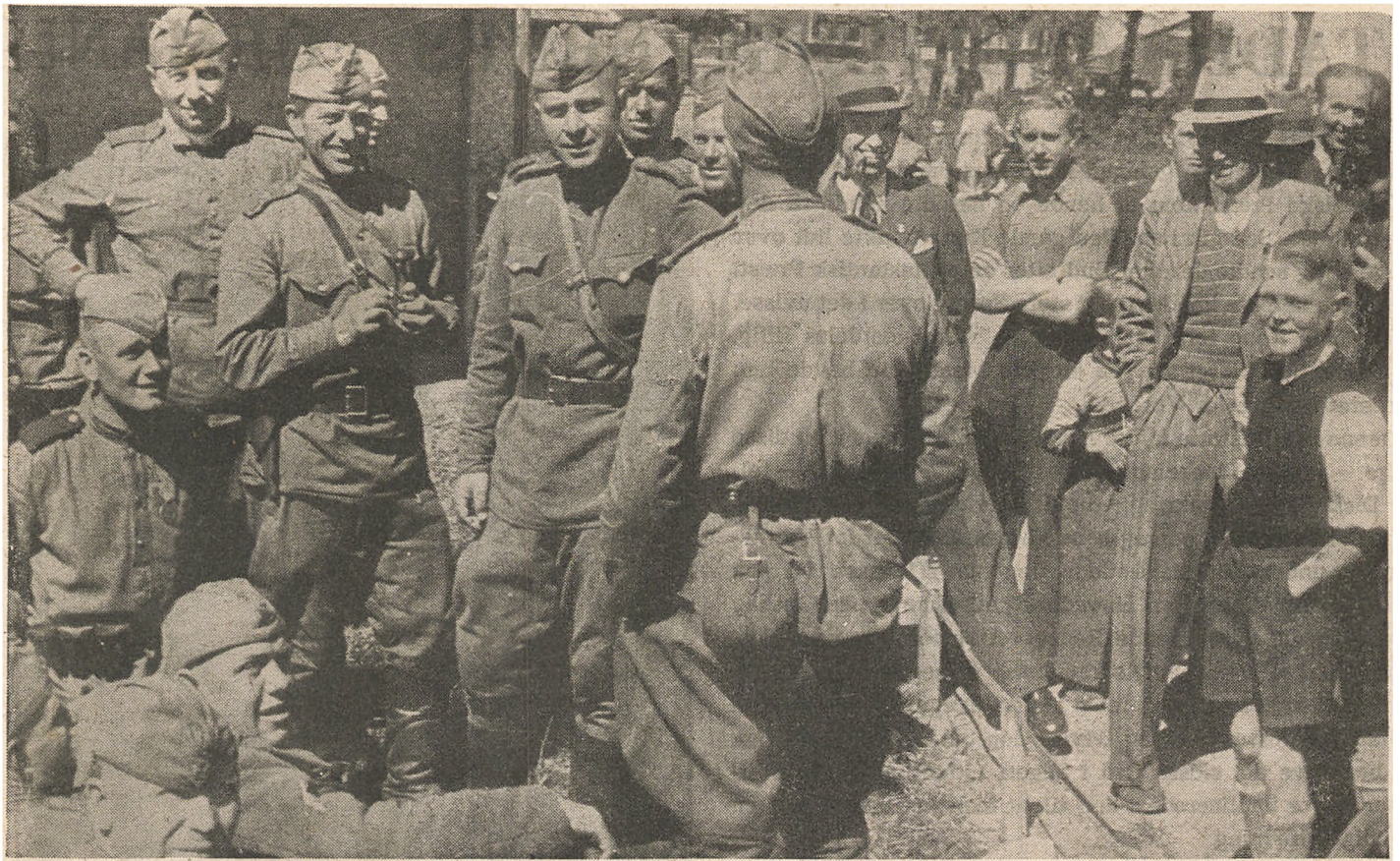
Russiske Officerer og Befolkningen i Rønne i Forsøg paa at overvinde Sproganskelighederne.

skæres fra at aflægge Regnskab for en nyvalgt Rigsdag. Det drejer sig ikke her om personligt Ansvar for Regeringshandling, men om det politiske Ansvar, og dette maa bæres af de politiske Partier, der samarbejdede om indtil Bristepunktet at støtte Regeringen Scavenius.