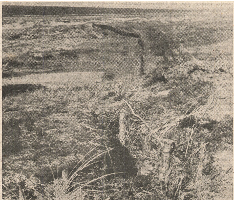
Vesterhavets dejlige Klitlandskaber er skæmmet og ødelagt af de tyske Forsvarsforanstaltninger, -gennemskåret af Løbegrave og Pigtraad og undermineret paa Kryds og tværs.

De organiserede Arbejdernes Løn niveau har i 1940—41 nogenlunde svaret til Overenskomsterne. I 1942 begynder det at knibe med at overholde disse, og i 1943 og 1944 bliver det mange Steder rent galt, som det vil forstaaes af ovenstaaende Fremstilling.