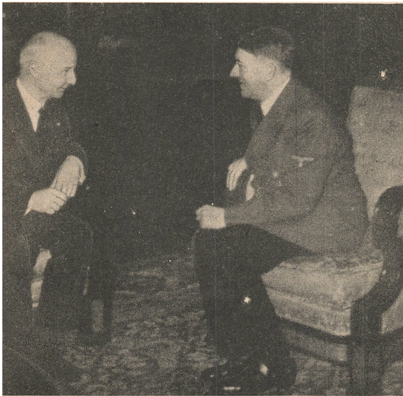
ler underholder sig med daværende Udenrigsminister Scavenius. De Herrer drøfter den lige underskrevne Antikomintern-Pagt.