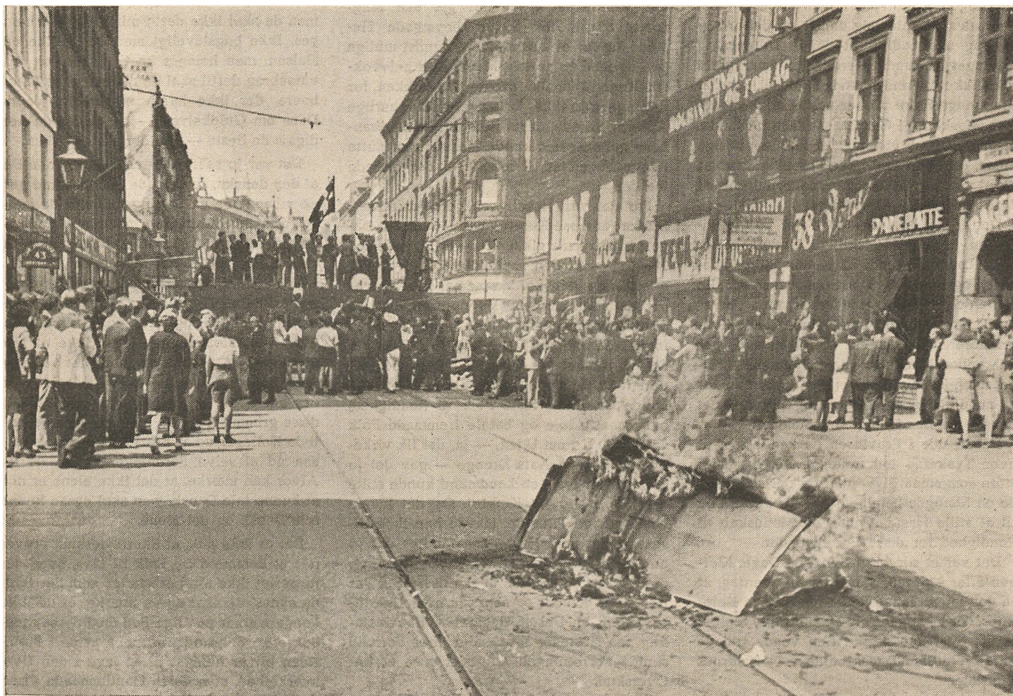
Fra Folkestrejken i 1944: Barrikader og Baal paa Nørrebrogade.