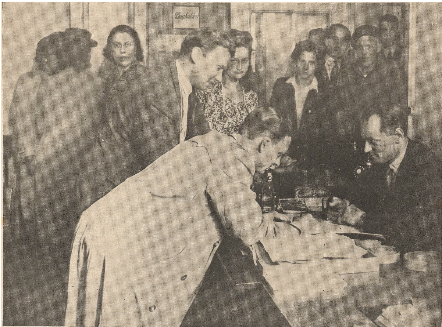
Fra Kontoret for særlige Anliggender i Dr. Tværgade 7, København.