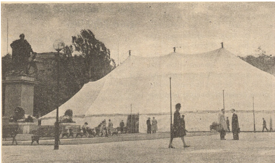
Frihedsraadets Udstilling i Stockholm: I Morgen, Lørdag, aabner Frihedsraadets Udstilling i Stockholm. Hcle Materiellet fra Udstillingen paa Blegdamsvej er blevet transporteret til den svenske Hovedstad, hvor det udstilles i og omkring et Kæmpe-Telt udlaant hos Pinsemissionen. Teltet, der paa Billedet herover netop er rejst, staar i Stockholms Centrum.