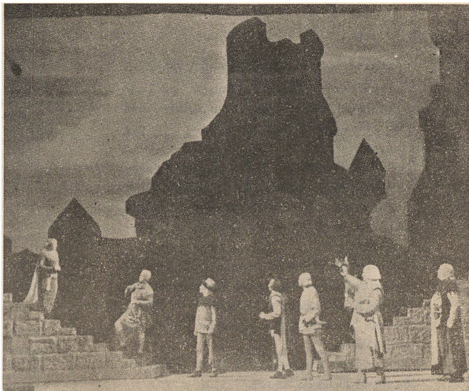
Den nye Realisme. »Macbeth« paa Pushkin-Teatret i Leningrad.

Her kommer vi til et centralt Punkt i den nye Sovjetkunst. Hvor den tidligere Aarhundredskiftets Realisme var fin-fin og pessimistisk, saa er den nye Realisme