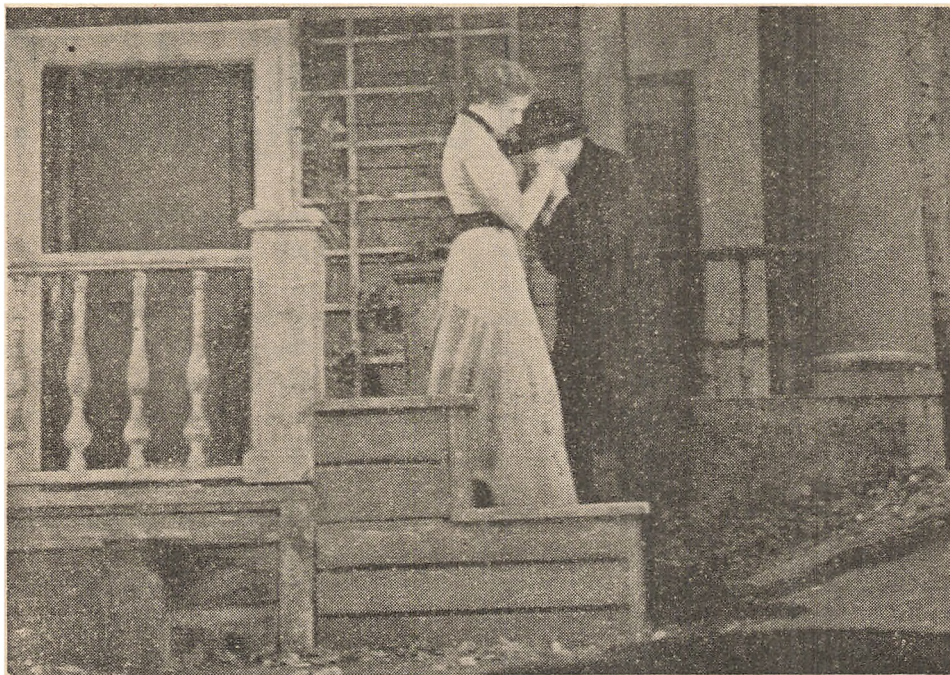
Den gamle Realisme. Tchekhovs »De tre Søstre« paa Moskva Kunstnertheater.

Kunsten vil altid have en vis, intim Forbindelse med det Samfunds Struktur, hvor den opstaar, og naar Samfundets Struktur ændrer sig saa radikalt, som det er sket i Rusland, maa ogsaa den Kunst, der skabes i det nye Samfund adskille sig fra den gamle Kunst. Det er paa Baggrund af dette, at Slagordet om den socialistiske Realisme i Sovjetkunsten maa ses. Det betyder nemlig ingensomhelst Paatvingelse af en kunstnerisk Retning. Det betyder snarere en Konstatation. Kunsten i Sovjetunionen har vist sig at være socialistisk realistisk, ligesom den tidligere har været romantisk, klassisk, realistisk o. s. v.