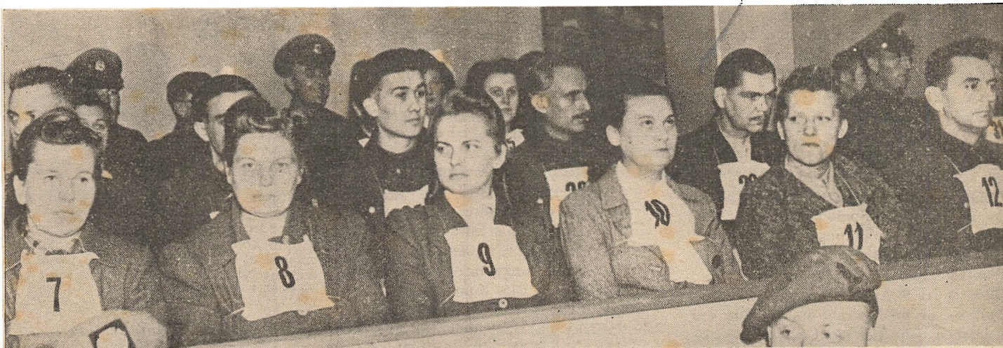
Belsen-Processen i Lüneburg: En Række af de kvindelige Anklagede fra Belsen-Lejrens Helvede, bl. a. Hertha Shleit (Nr. 8), Irma Greese (Nr. 9), Ilse Loshe (Nr. 10) og Hilde Lobauer (Nr. 11).