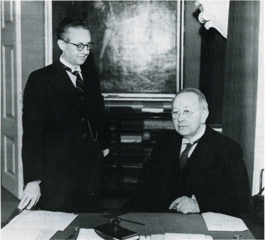
K. H. Kofoed overtager finansministeriet fra Alsing Andersen 10. 11. 42 efter dannelsen af regeringen Scavenius.