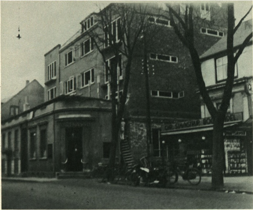
Byggeriet i fuld gang.

bejderne på skift havde fri lørdag aften, men der blev efterhånden så meget at gøre, at ingen kunne tillade sig at holde fri.“