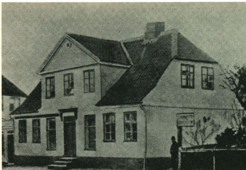
Hovedgaden 27, hvor Sparekassen begyndte sin virksomhed.

„Han var – som sagt – Sparekassens stifter. Erfaren og initiativrig. Altid meget interesseret i arbejdet, og han var for-