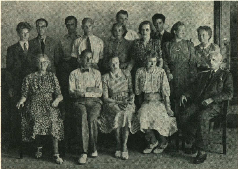
Sparekassens personale i 1948.