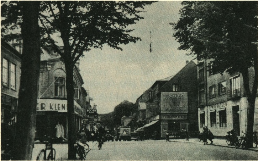
Hovedgaden i 1937.