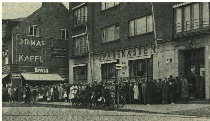
Pengeombytningen i 1945.

kunne han blive fritaget for bøde, forklarede jeg. Han kom nu til at betale en mindre skattebøde, men det blev i det mindste ikke så meget, som hvis man havde fundet frem til, at han ulovligt havde de mange penge.“