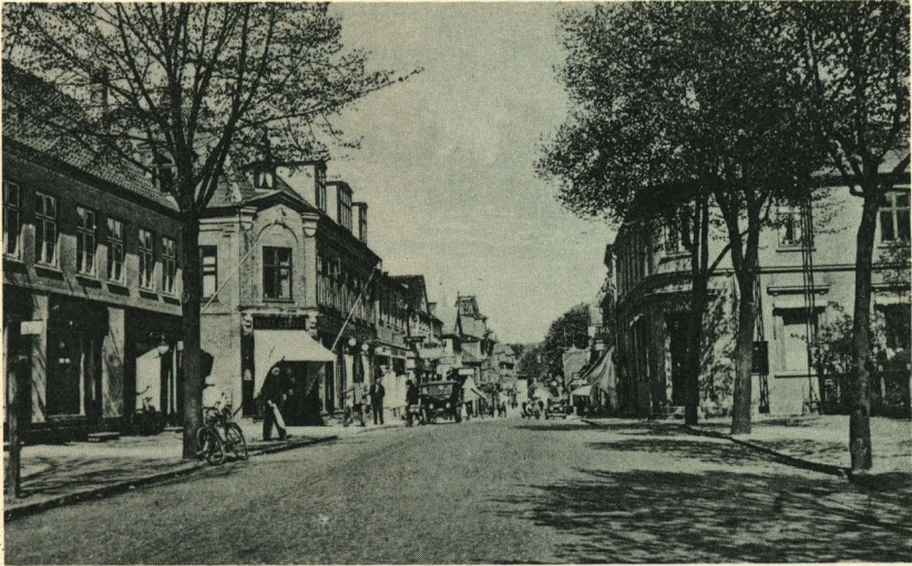
Hovedgaden i 1919 med Sparekassens bygning til højre i billedet.