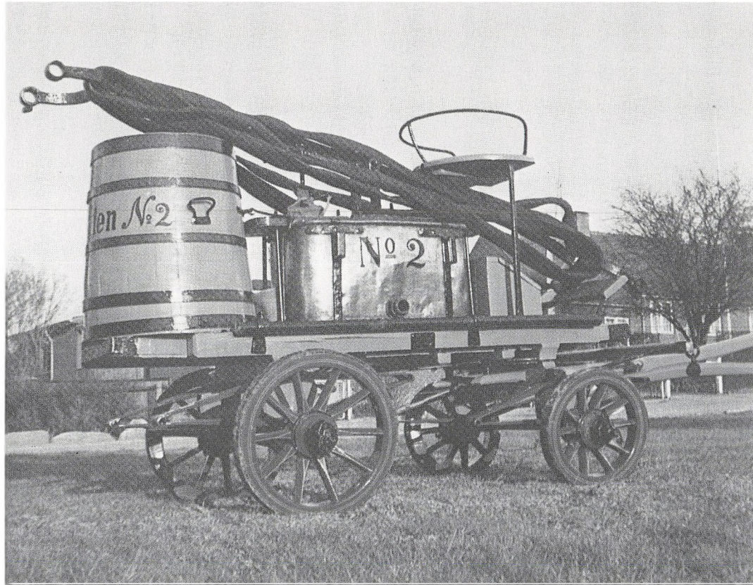
Billedet viser en brandsprøjte af den slags, som det var påbudt de forskellige distrikter at anskaffe. Denne brandsprøjte er fra Præstø, den har en læderslange på 26 alen og et kar, der kan rumme 1½ tønne vand. (Fra Købstædernes almindelige Brandforsikrings jubilæumsskrift 1986)