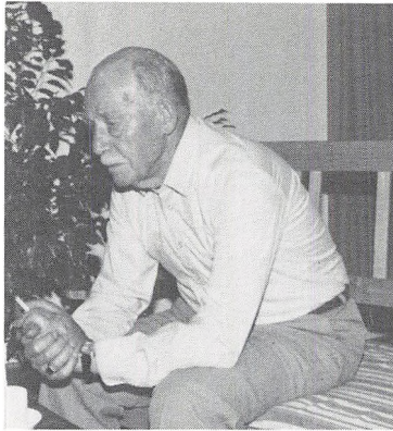
Og her forfatteren i 1985, da han nedskrev sine erindringer.