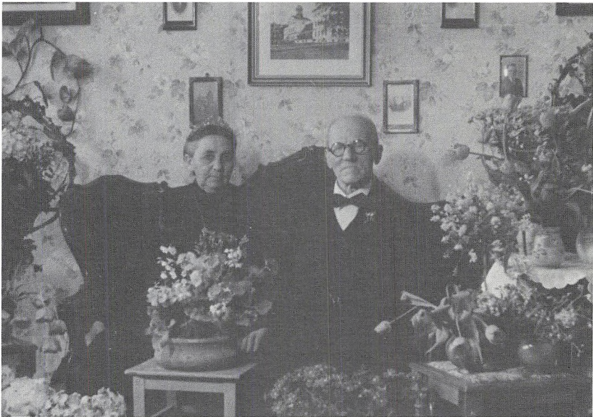
Forfatterens forældre, da de kunne fejre deres guldbrillup. De boede på det tidspunkt i Ringgade 9.