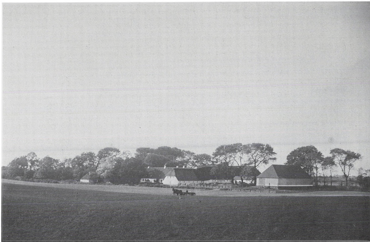
Ladegård omkring år 1900. Bortset fra laden er gårdens øvrige bygninger stråttækte. Den lille bygning længst til venstre er gårdens bagehus, der af hensyn til brandfare altid lå i nogen afstand. (Lokalhistorisk arkiv)