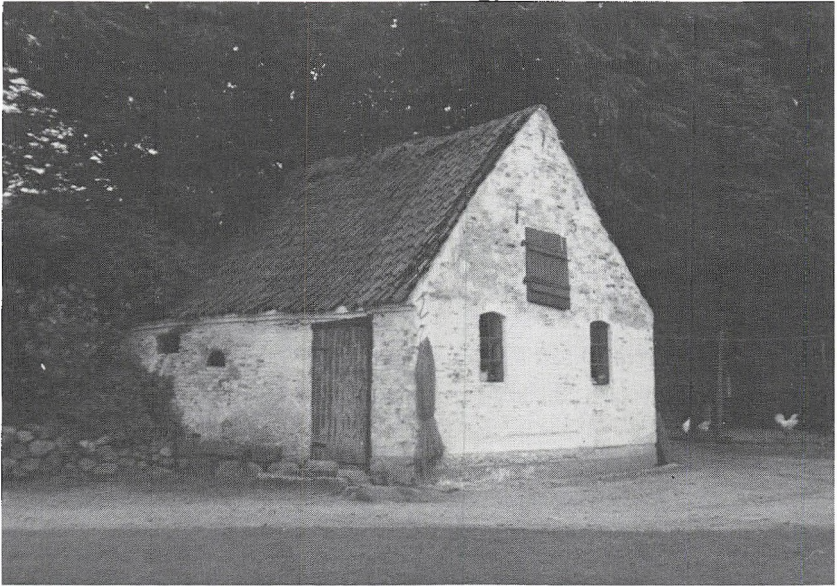
Der findes ikke mange bagehuse mere. Her et på Knudsmade i Bækken. I dag er det ombygget til redskabshus.

Interessenter handler imod dette Punct, så ville vi herved have fastsat, at han derfor skal betale 10 rdl. i Bøde til Cassen«.