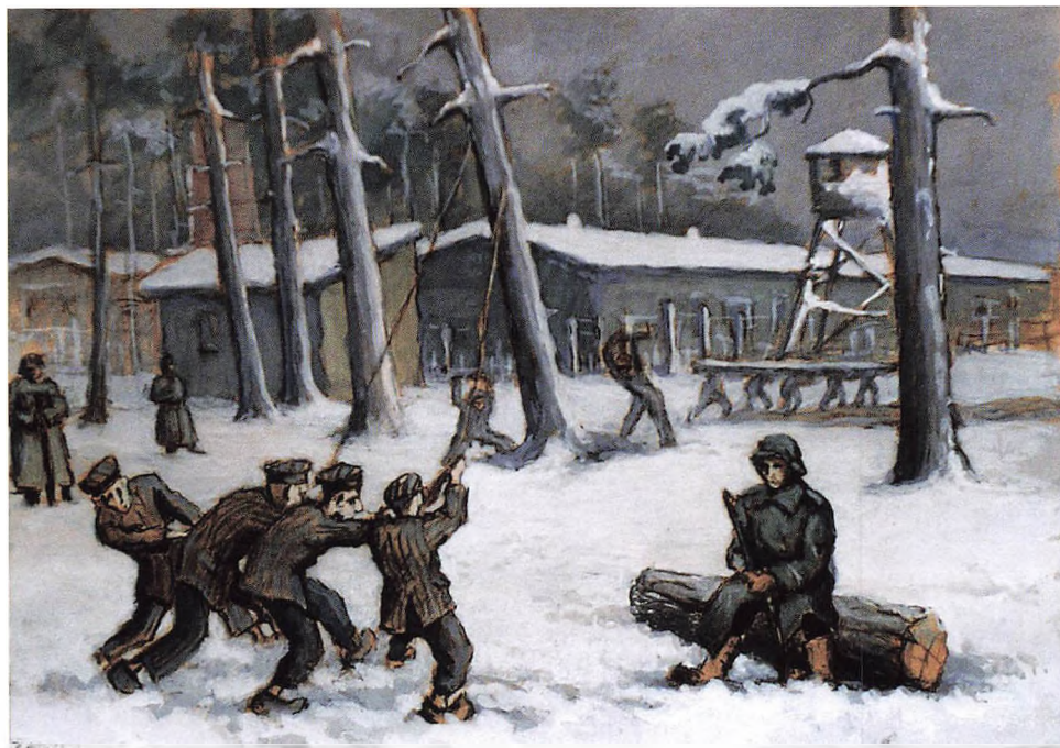
Illustration: József Lapinszki, Stutthof Museets Arkiv.

Fangerne i Stutthof blev sat til hårdt fysisk arbejde i de mange arbejdskommandoer. På maleriet gengives arbejdet i Stutthofs træfældningskommando Waldkommando om vinteren.