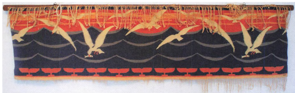
Skærbæktæppet Möwenfries. Forlægget til tæppet af udformet af Otto Eckmann i 1896.

ønskede at flytte ankeret, og museet ikke kunne godkende den nye placering, havde vi ret til at købe det tilbage for den samme sum.