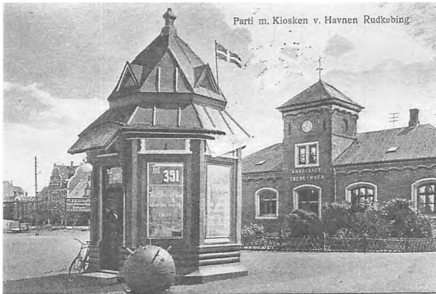
Parti m. Kiosken v. Havnen Rudkøbing