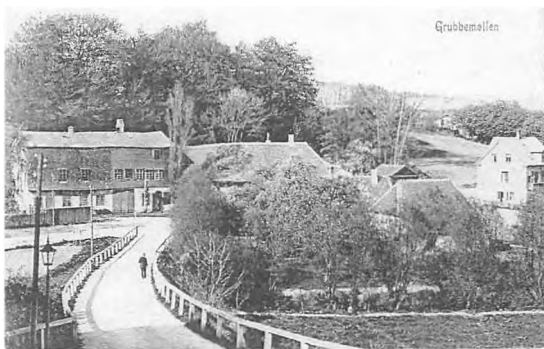
Motiv fra Grubbemøllen