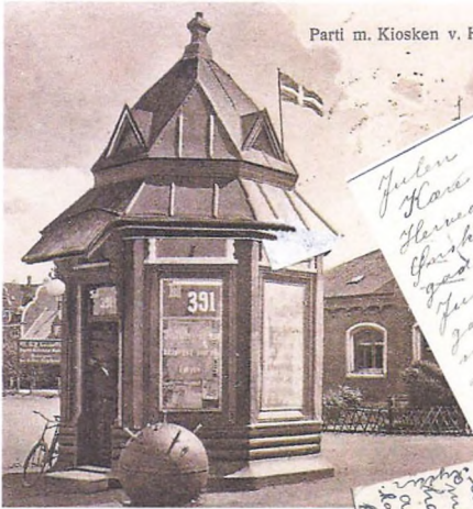
Parti m. Kiosken v. Havnen Rudkøbing