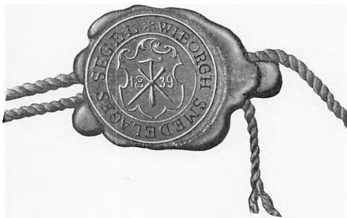
Viborg smedelaugs segl.