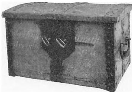
Smedesvendenes lade fra 1726, hvor i tidepengene og regnskabet for disse opbevarede.

har haft eget laug. Havde de haft det, vilde det sikkert have sat sig spor i mesterlaugets forhandlinger; men først det pågældende år finder vi en notits, der angår svendene. Impulsen dertil kommer fra mestrene selv, der foreslår, at svendene i lighed med, hvad der finder sted i byens andre laug og i smedelaug i landets øvrige byer, skulde »erlægge deres tidepenge til svendenes eget bedste og nytte for det tilfælde, at de blev syge eller døde, ligeledes rejsepenge til vandrende svende, der ikke kunde faa arbejde i byen.«