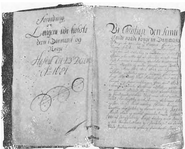
Smedemestrenes laugsprotokol fra 1717, der indledes med en afskrift af den kgl. forordning af 1681 om laugene i almindelighed.

hvad) hand var ham skyldig«. Bering blev rasende over denne påstand og forlangte skriftligt referat af, hvad der var passeret i mødet; men siden faldt remsnideren tilføje.