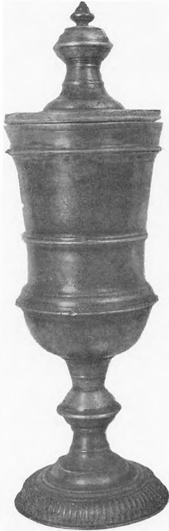
Smedesvendenes velkomst, bægeret, hvoraf den unge svend fik sin første drik som voksen mand.