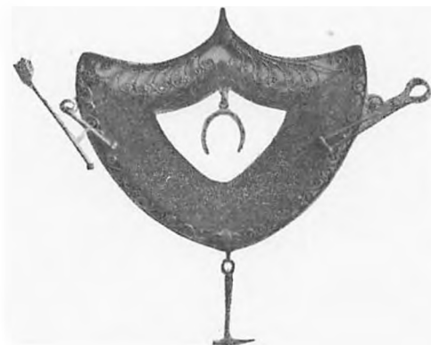
Et af Sølvskiltene.