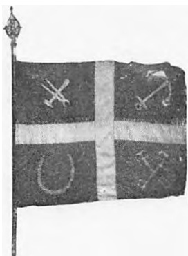
Smedelaugets gamle Fane.