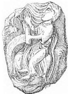
Brudstrykket af seglet (der forestiller Maria med barnet) findes under kapitlets stadfæstelse af overenskomsten med Vitskøl Kloster om Læsø (se side 13 her).