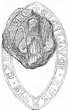
1. Gunnars abbedsegl 1219