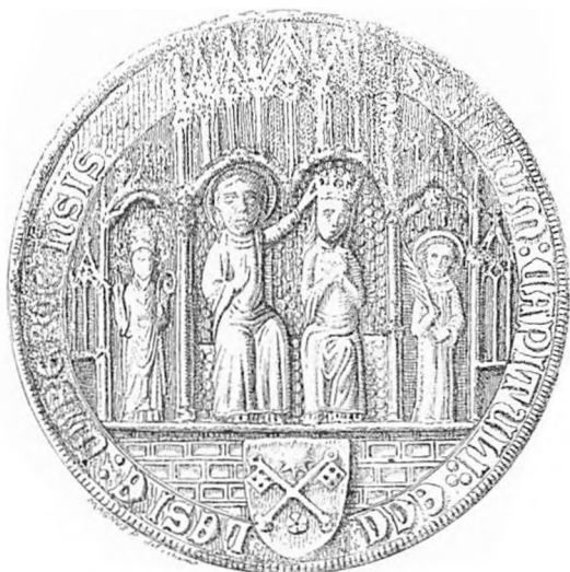
3. Viborg Domkapitels segl 1597

I cistercienserklostre havde kun abbeden ret til at forsegle. Seglet skulle være ganske enkelt og kun vise en abbed med stav. Seglet findes på Gunnars brev om overenskomsten mellem Viborg Kapitel og Vitskøl Kloster om Læsø (se side 12 f. her).