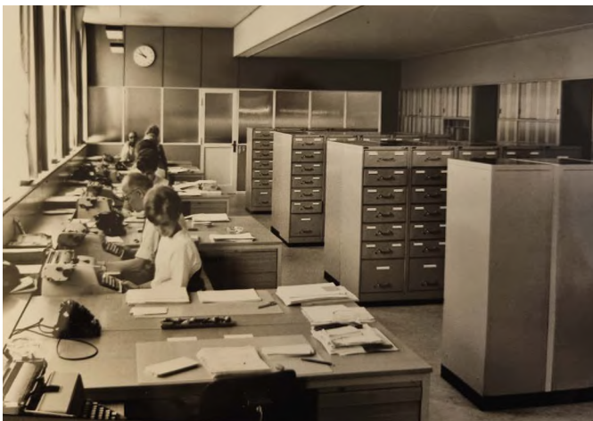
Folkeregistret i Aalborg Kommune ca. 1965.