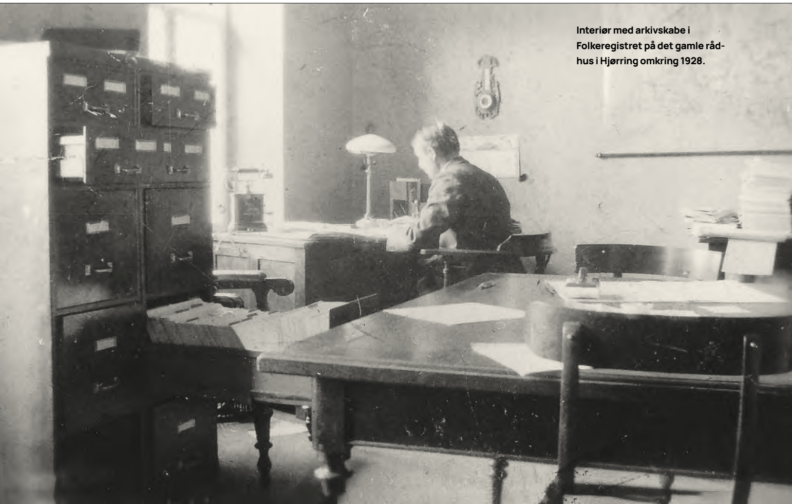
Interiør med arkivskabe i Folkeregistret på det gamle rådhus i Hjørring omkring 1928.

vente på udvalgsarbejdet, så man gik solo. 1. februar 1923 oprettede Københavns Kommune i fællesskab med Gentofte og Frederiksberg Kommuner et folkeregister – baseret på en lokal folketælling samme dag som oprettelsen.