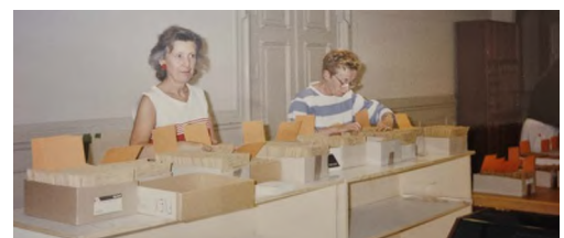
To medarbejdere sorterer kartotekskort i Folkeregistret i 1970'erne.

KILDER: MARK JENSEN, FMD, BORGERSERVICE DANMARK. LENE HARTIG DANIELSEN, BORGERSERVICECHIEF AARHUS KOMMUNE MFL.