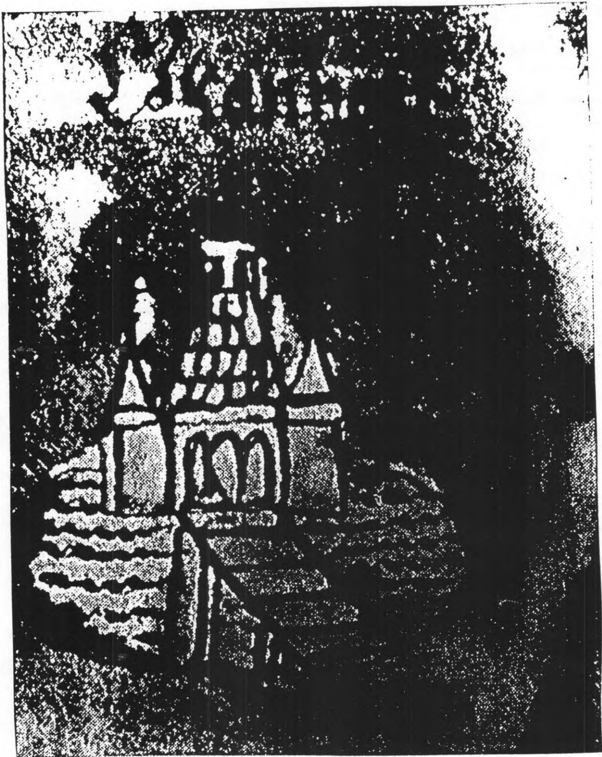
Concord (Helge Falstrom).