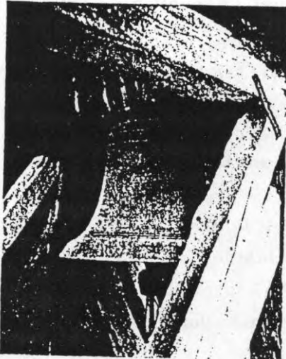
Klokke i Linnerup, Midtjylland, støbt af Peter Hansen »Herrens år 1490, i den 10. måned -- til lov for Gud og den hellige Peter - «.