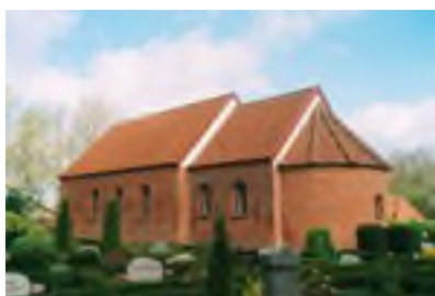
Dommerby Kirke