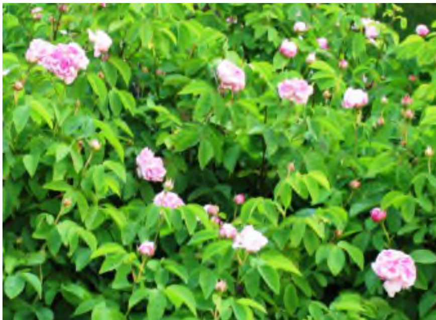
Rosen stammer fra Toustrup