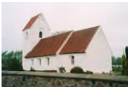
Lundø Kirke: Taget i maj 2003