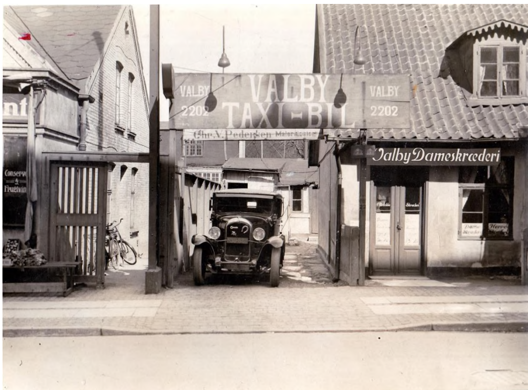
Lillebilen Valby Taxi-Bil på holdepladsen i indkørslen i en af de ældre ejendomme på Valby Langgade i 1930. (Valby Lokalhistoriske Arkiv).