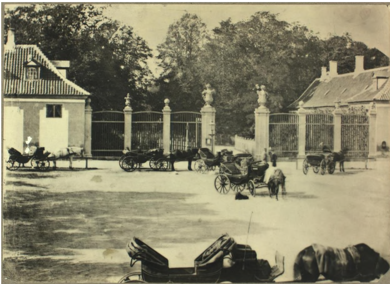
Hestedrosker på Frederiksberg Runddel i Frederiksbergs gamle landsby i Allégade i 1865. Runddelen var længe Frederiksbergs første og største droskeholdeplads og samtidig endestation for flere sporvogns- og omnibuslinjer. (Frederiksberg Stadsarkiv).

Af drosker med hvide numre fik de første 200 numre de bedste pladser på Strøget og de større gader i indre by og brokvarterene, mens de resterende numre fik pladser i sidegaderne.