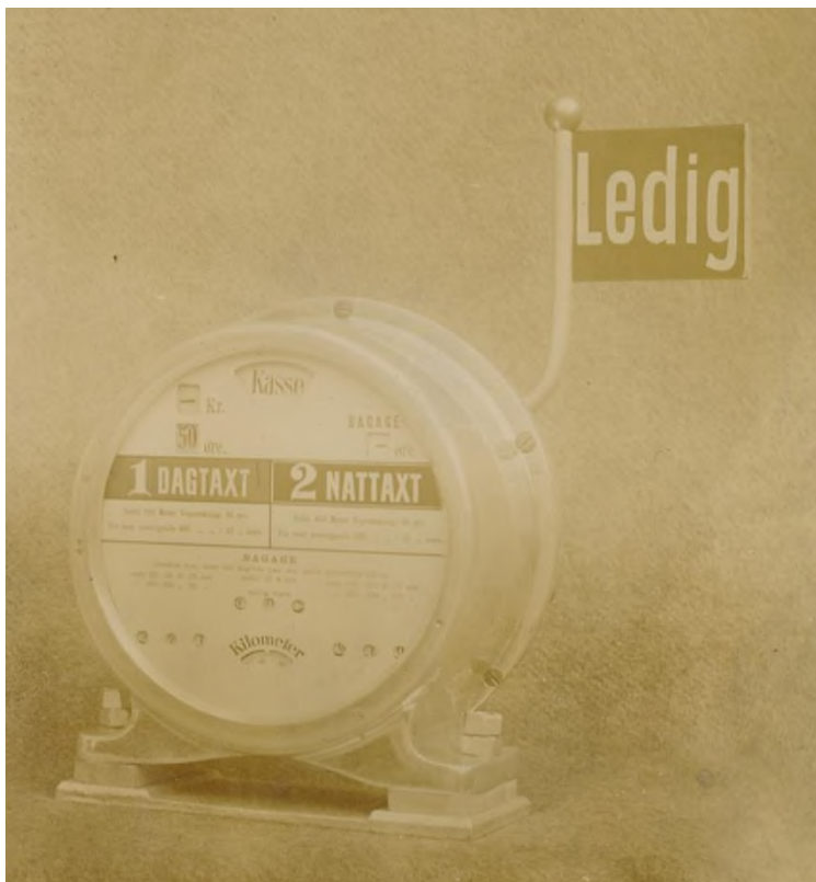
Taxameter med friskilt i en af de ældste udgaver fra 1906. (Frederiksberg Stadsarkiv).