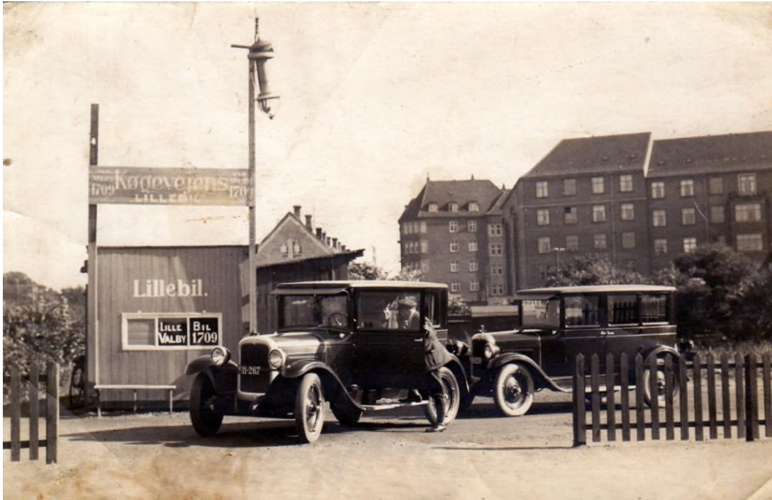
Holdeplads for Køgevejens Lillebil på Toftegård Allé/Lyshøjgårds Vej i 1939 i københavnske Valby. De to lillebiler holder, som de skal på en privat grund. I det lille træskur er der bestillingskontor, hvor der modtages telefonture på nummeret Valby 1709, hvorefter manden i skuret går ud og give bestillingen videre til de holdende chauffører. (Valby Lokalhistoriske Arkiv).