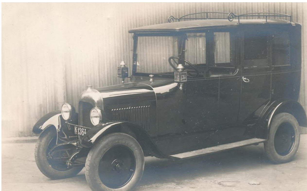
Vogn 1364 fra hovedstadens Taxa i 1930.

Efter gennemførelsen af droskeordningen var der behov for at få tilpasset reglementerne til den nye virkelighed og de revisioner, udviklingen ellers krævede. Helt i overensstemmelse med den kooperative beslutningsform i centraladministrationen, der fulgte med den øgede samfundsregulering siden første verdenskrig, nedsatte man i vinteren 1935 et særligt udvalg, der bestod af kommunernes fællesudvalg, repræsentanter fra Taxa og droskechaufførernes fagforening. Udvalget skulle udforme et københavnsk reglement, der efter en tilpasning til lokale steds- og myndighedsbetegnelser og enkelte, ubetydelige særforhold i de to øvrige kommuners regulativer, skulle være gældende for hele droskeordningens område.