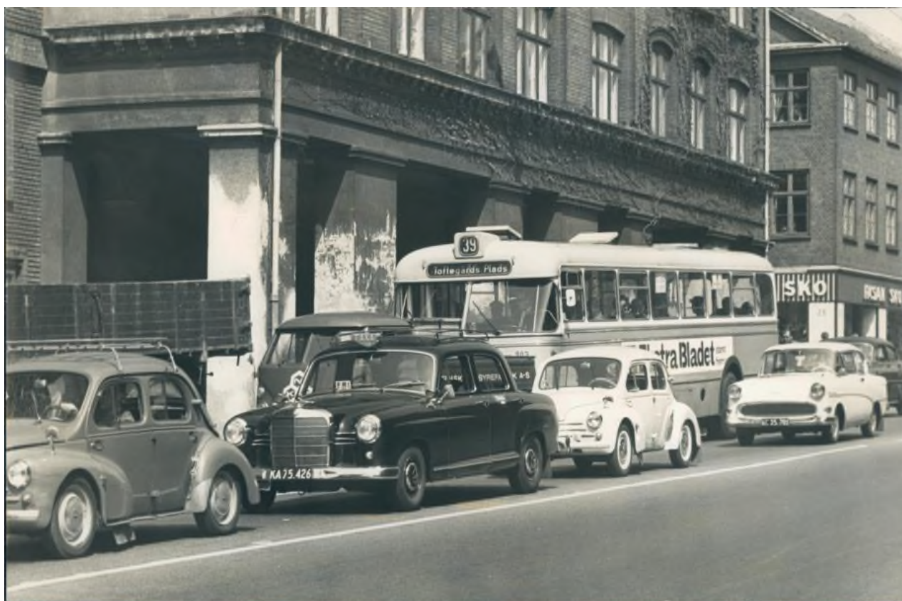
Også i starten af 1960'erne var der kødannelse ved Ndr. Fasanvejs krydsning af Finsensvej på Frederiksberg. Et helt klassisk bybillede fra hovedstaden med blandet trafik af privatbiler og køretøjer fra den kollektive trafik. Som nummer to en helt klassisk Mercedes Taxa med droskelygter, friskilt og Taxa-trekanten på toppen. Bag ved ses en af Københavns Sporveje ligeså klassiske Leylandbusser – her som linje 39 på vej til Toftegårds Plads i københavnske Valby.

I begyndelsen af 70'erne havde drosken imidlertid stadig eneretten til at søge hyre fra holdepladser. Selv om adgangen til telefon-skabene på holdepladserne i Københavns, Frederiksberg og Gentofte kommuner spillede en stadig mindre rolle for Taxa's radiodirigerede vogne, og antallet af pladser af samme grund var reduceret, var holdepladsturene fortsat en væsentlig indtægtskilde for hovedstadsmetropolens drosker. Mellem en fjerdedel og halvdelen de mulige hyrevognsture udgik således fra holdepladserne i henholdsvis København, Frederiksberg og forstæderne. Særlig på holdepladserne ved hovedbanegården, stationer, i lufthavnen, ved forlystelsessteder og på stærkt trafikerede gader og pladser var hyremulighederne store, og det blev netop her, konflikten mellem droskerne og lillebiler fortsatte med at udspille sig helt frem til starten af 70'erne. Både de uorganiserede lillebiler og lillebilselskabernes taxier dannede ofte ulovlige kaperrækker ud for forlystelsessteder eller selvbestaltede holdepladser ved at tage hyre fra mere centralt beliggende positioner ved gadekryds, veje og pladser end droskernes afmærkede holdepladser. Denne åbenlyse krænkelse af den eneste særstilling, droskerne havde tilbage, førte i mange tilfælde til voldsomme konflikter mellem lillebilfolket og droskeførerne. Nogle gange blev det til oprin af voldelig karakter. 24