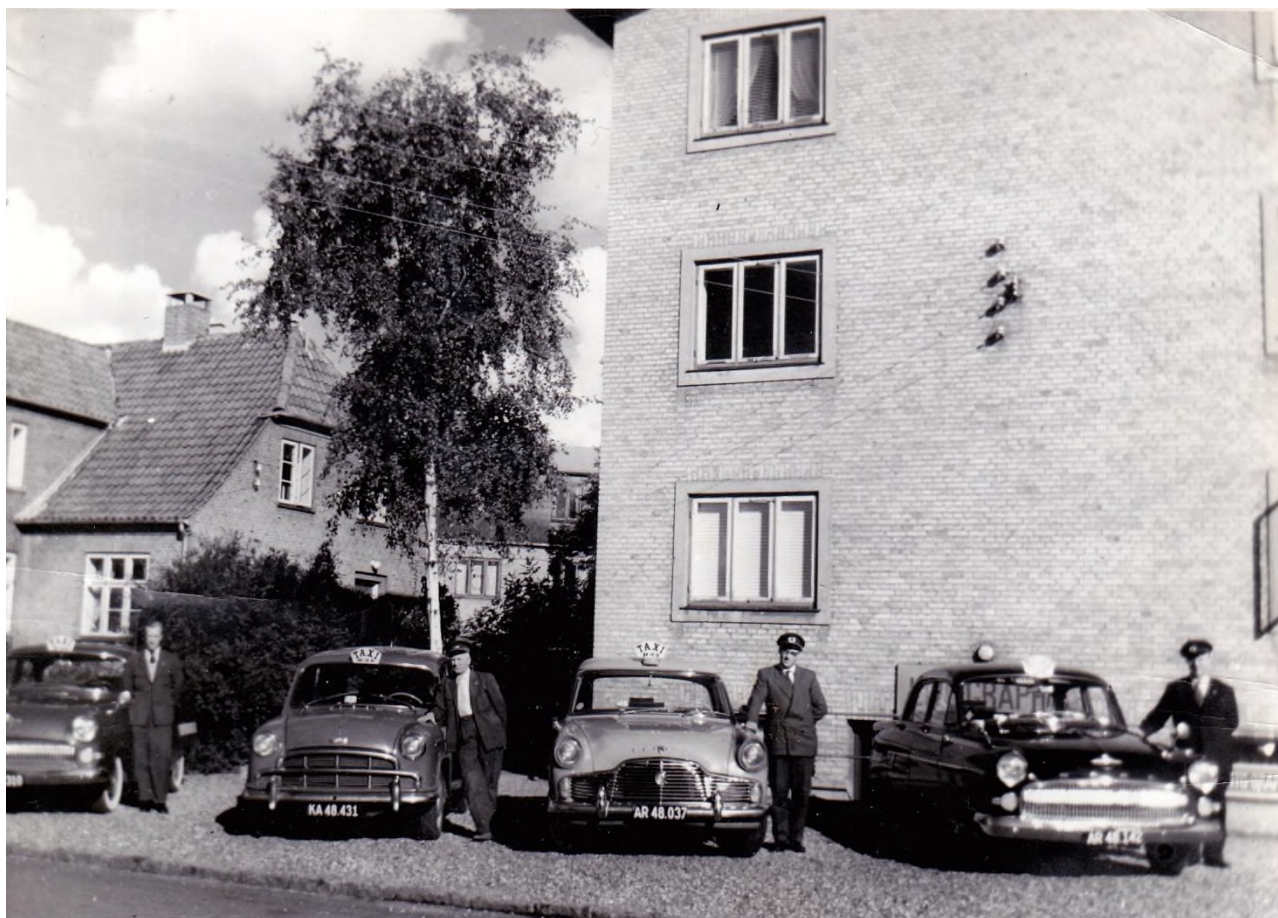
Holdeplads for lillebilen Vigerslev Bilen på den private holdeplads på Lundsrydvej 9 i københavnske Vigerslev i 1960. Selv om der på dette tidspunkt var fri hyreret på gade og vej og i øvrigt også samtaleradioforbindelse til bestillingskontoret, vendte man efter endt tur tilbage til den private holdeplads. Telefonturene var jo lokale og det var forbudt at tage ophold på gade og vej og derfra at søge hyre.