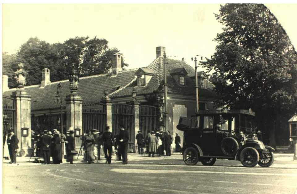
En motordroske fra Taxamotor på Frederiksberg Runddel. Til højre anses den ene af runddelens tre telefonskabe, Autotaxas. (Frederiksberg Stadsarkiv).

Men centraliseringen betød også, at hovedstadens hestedrosker frem til 1914 stort set blev aflivet i løbet af ganske få år, samtidig med at de kommunale myndigheder fik mulighed for at reducere antallet af droskeholdepladser (tabel 2). På holdepladserne, hvor droskeselskabernes telefonskabe efterhånden blev opstillet, kunne der placeres flere automobiler end hestevogne, ligesom motordrosken kunne betjente et langt større geografisk område.