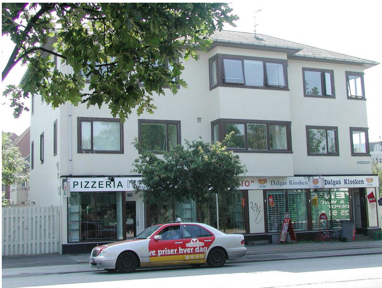
Hyrevogn fra Dantaxi venter på kunder på Dalgas Boulevard 162 på Frederiksberg, sommeren 2005. (Frederiksberg Stadsarkiv).