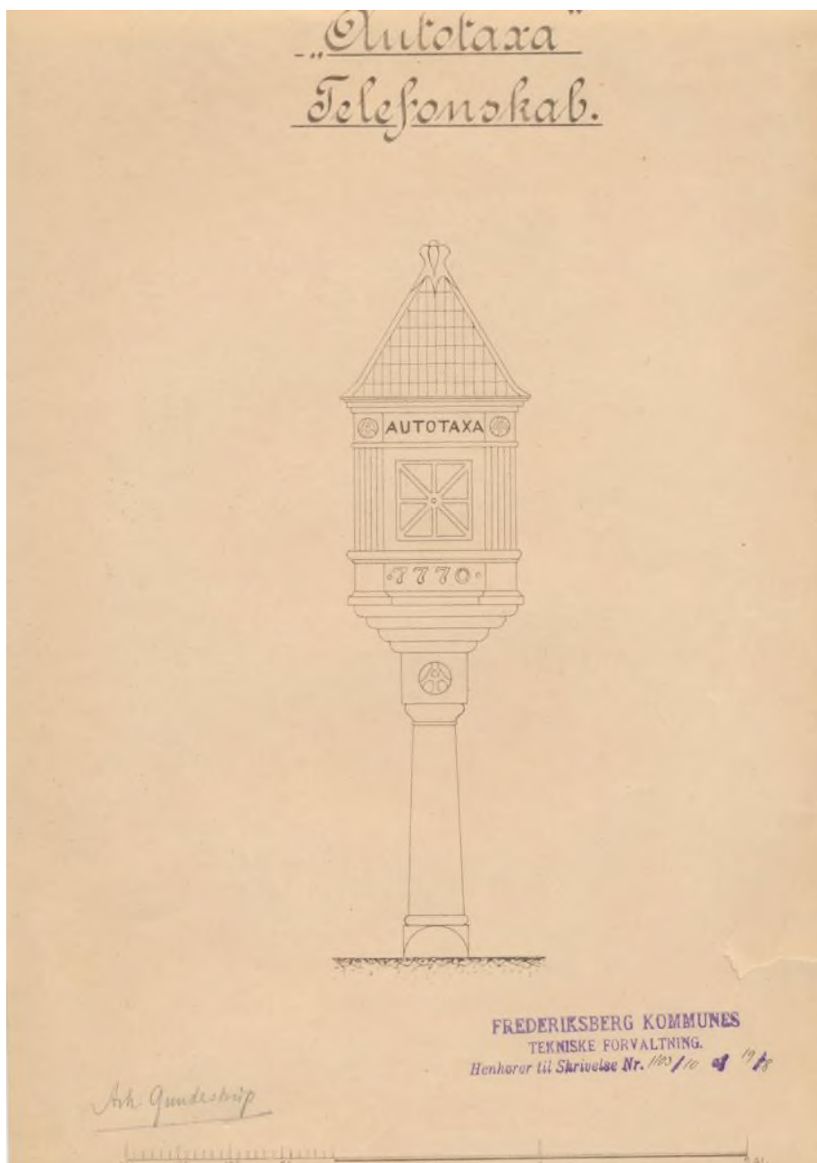
Telefonskab for Autotaxa, 1910. (Frederiksberg Stadsarkiv).

lægge sig ind på holdpladser i København, mens droskerne fra København omvendt havde disse rettigheder på Frederiksberg. Som beskrevet tidligere havde Frederiksberg Kommune i 90'erne forgæves forsøgt at få etableret en fælles droskeordning med København. Men da de nye københavnske motordrosker for alvor oversvømmede byen, mens de frederiksbergske måtte køre tomme hjem efter en tur i nabobyen, blev Frederiksbergs drosker presset så meget på indtjeningen, at kommunalbestyrelsen i 1913 truede med at udelukke de københavnske drosker fra at kunne tage gadehyre og lægge sig ind på holdepladser på Frederiksberg. 8