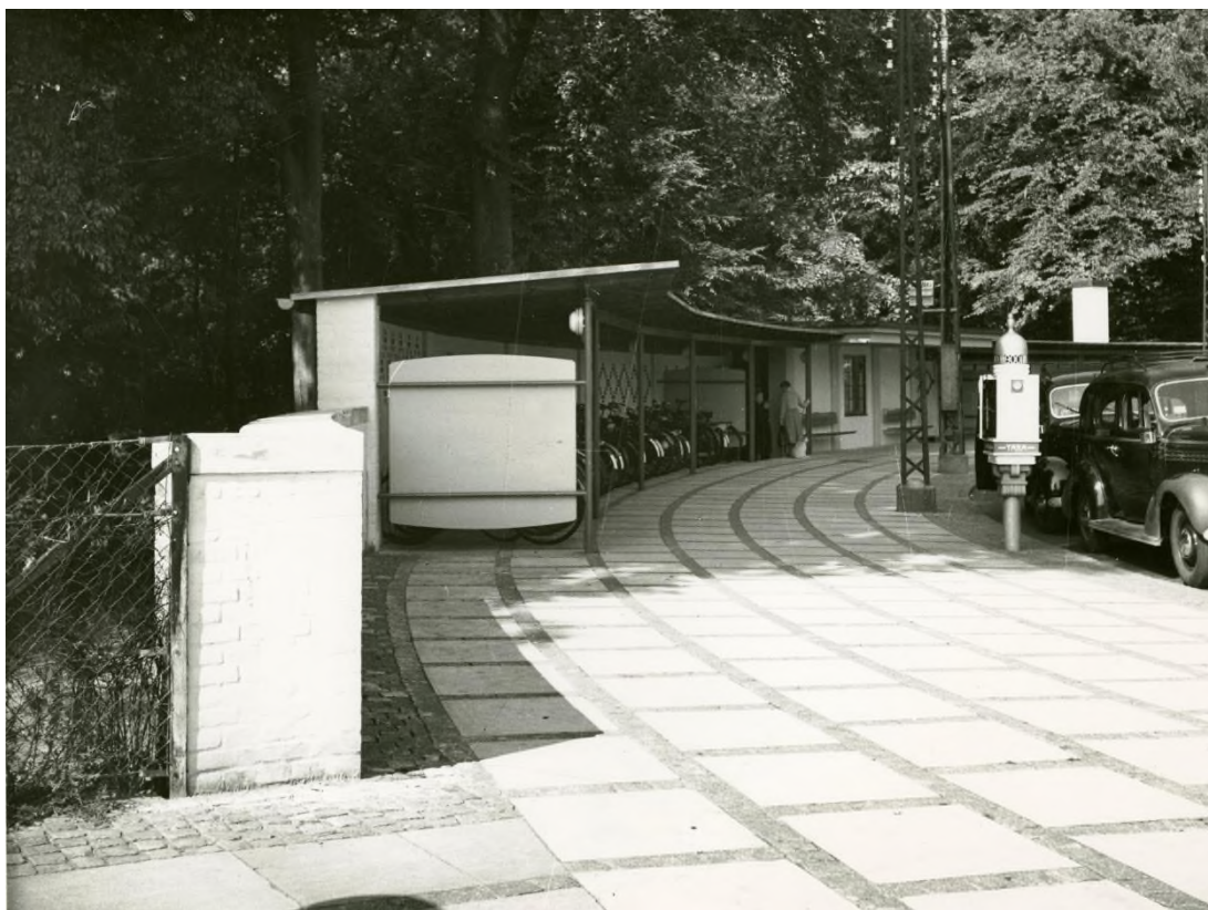
Droskeholdepladsen på Femvejen i forstadsbydelen Charlottenlund i Gentofte Kommune, var en af de yderste i Københavns, Frederiksberg og Gentofte kommuners fælles droskeområde. Bemærk Taxas telefonskab, der naturligvis er åbent, da der er ventende vogne på pladsen. Femvejen var også knudepunkt for først NESAs sporvogne og senere trolleybusser. Foto: Sommeren 1954. (Lokalhistorisk Arkiv i Gentofte Kommune).

Mens en betydelig del af den kollektive trafik i hovedstaden og de nærmeste forstæder således i realiteten var underlagt én aktør, nemlig KS, og var styret af fællesdrift, samme takst-, billet- og køreplanssystem og skete ud fra en overordnet plan, blev billedet op gennem efterkrigstiden stadig mere broget i hovedstadsmetropolens forstæder. Ud over de linjer, der blev drevet af KS, NESAs, AB og DSB, kom flere mere eller mindre kommunale busselskaber op til 1970 til at stå bag busdriften. Hvert selskab havde sin egen administration og sit eget billet- og takstsystem, og der var en utilstrækkelig koordination mellem de enkelte selskabers ruter, køreplaner og de videre forbindelser til S-banen og KS' linjenet. På nær KS', NESAs og AB's direkte forstadslinjer til centrale lokaliteter i det indre København blev forstædernes bussystem kun lige ført ind til det yderste af Københavns Kommune og til omstigningsstationerne på Callisensvej, Hans Knudsens Plads, Bellahøj, Husum Torv, Valby Station, Valby Langgade station, Toftegård/Ålholm Plads.