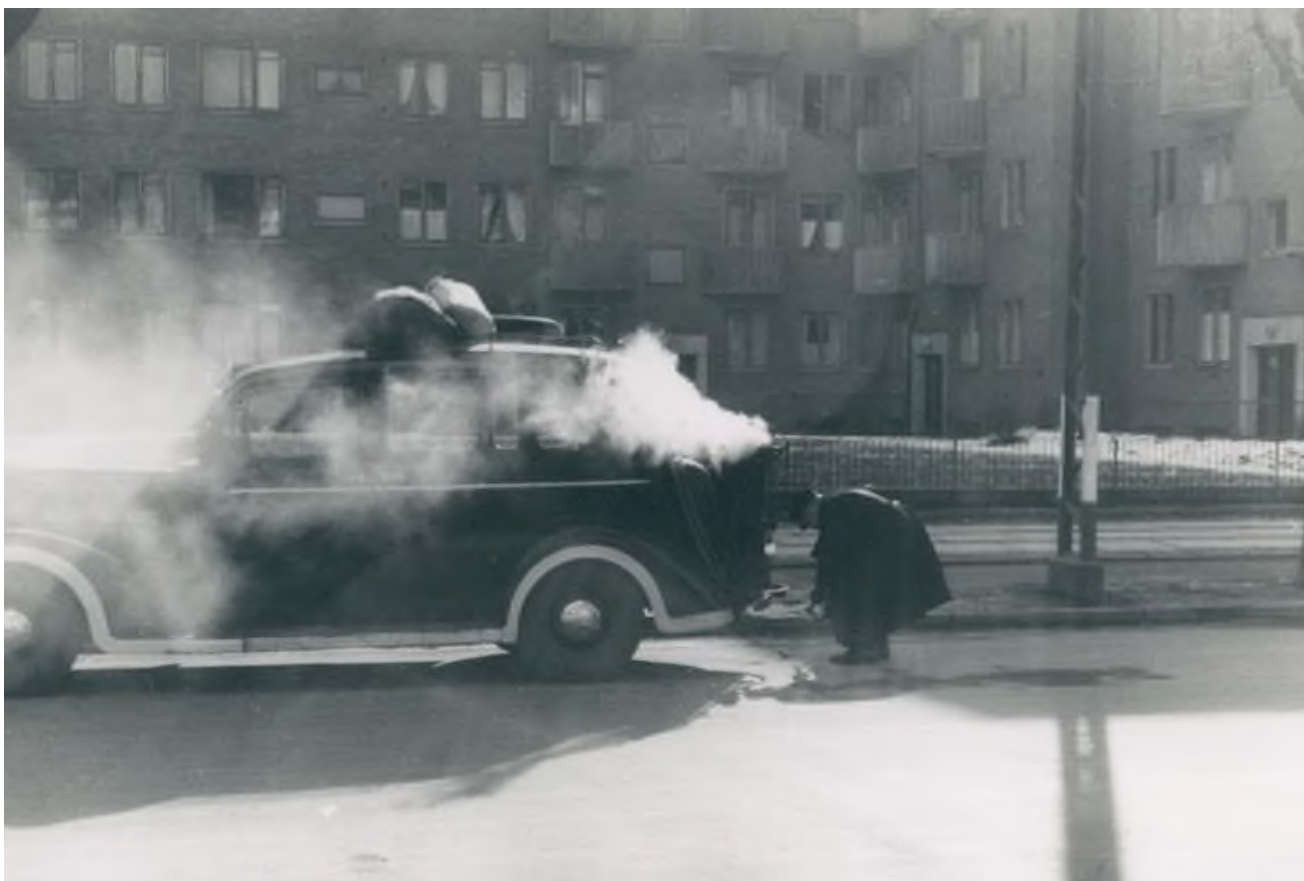
Der fyres op i generatoren på en af Taxas drosker på Peter Bangs Vej på Frederiksberg i sommeren 1943.

Det store socialdemokratiske mindretal i kommunalbestyrelsen havde samme holdning til sagen som det socialdemokratiske flertal i Københavns Kommunalbestyrelse og partiets landsorganisation. Med udgangspunkt i det kooperative beslutningssystem, som Socialdemokratiet som regeringsbærende eller -støttende parti selv havde opbygget i mellemkrigstiden, henvistes til den tilslutning, som Københavns Kommunes lovforslag nød blandt parternes organisationer: Automobildroskeejerne i Danmark, Lillebil Sammenslutningen samt Droskechaufførernes Fagforening. Herudover fremførtes de samme argumenter som både det ministerielle udvalg fra 1935 og Københavns Kommune tidligere var kommet med i sagen.