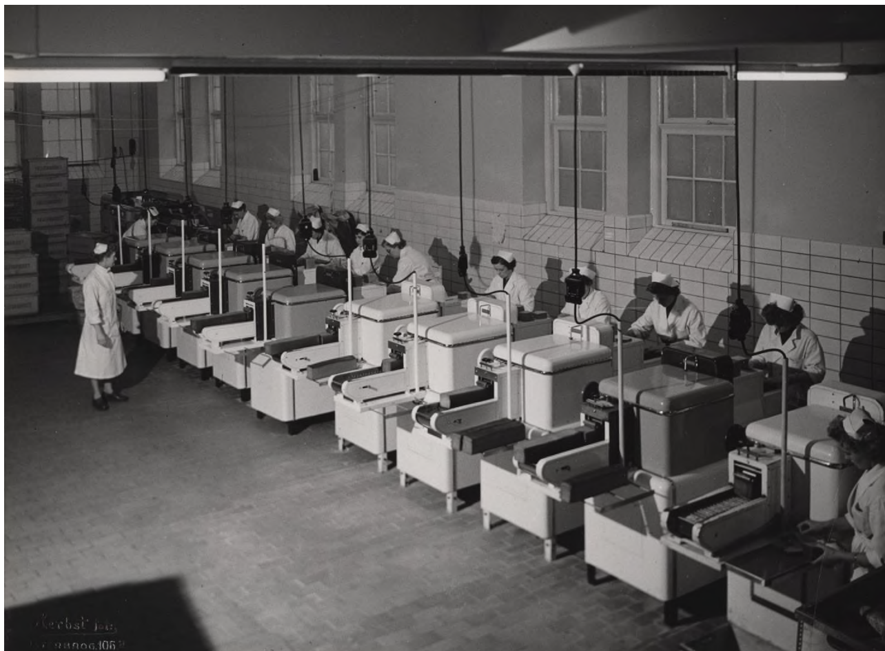
1950'erne og 1960'erne stod i moderniseringens tegn indenfor bageribranchen, såvel som indenfor dansk industri generelt. Billedet er fra skivepakteriet i Arbejdernes Fællesbageri i København i 1956. Med en kapacitet på en halv million skiver brød per dag var pakkeriet på det tidspunkt landets største og mest moderne.