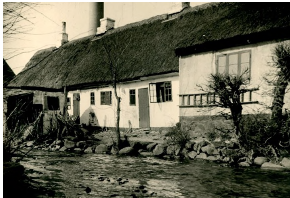
Gård på matr. 31 (Eskes gård) i Nørregade.