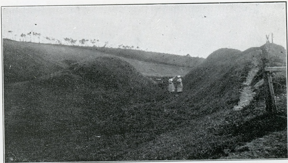
Hulvej mellem Thise Kirke og Thise Kær. Se Side 46.