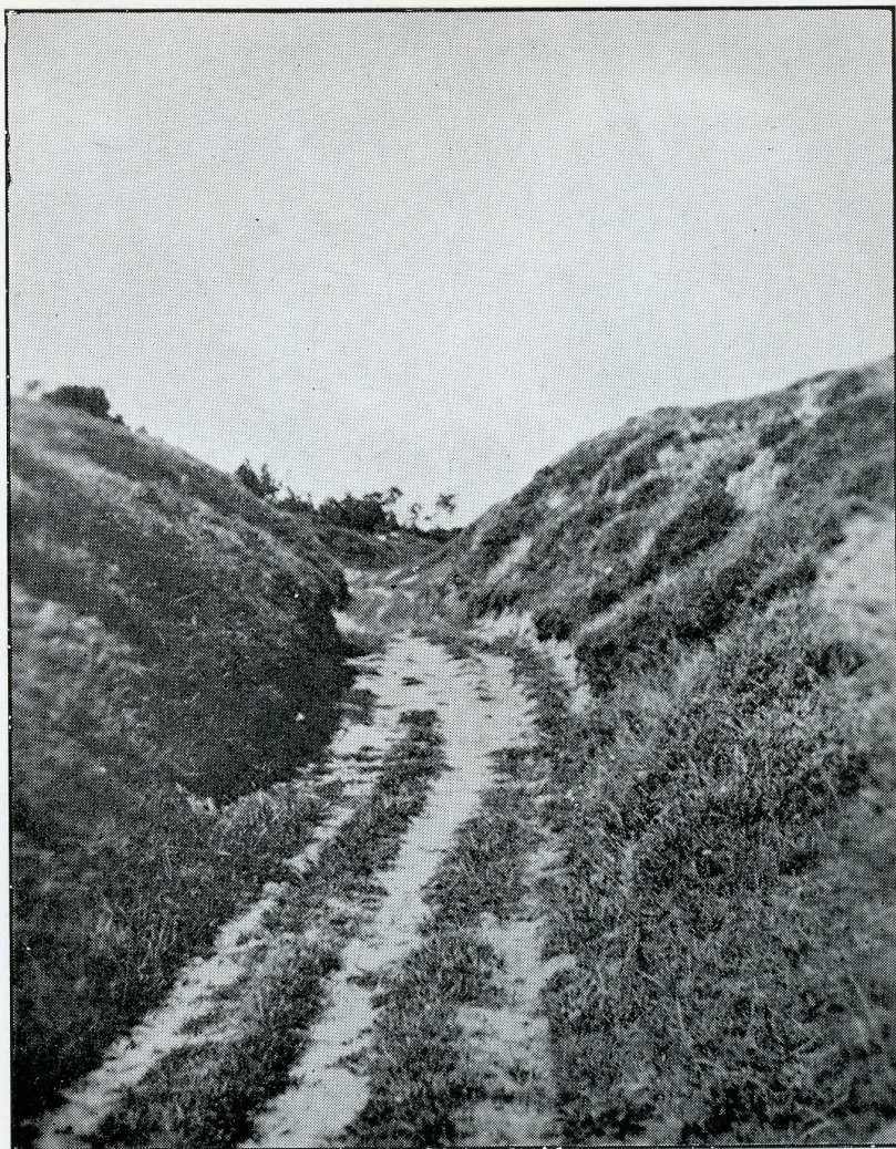
Hulvej øst om Lejhøjene i Kjettrup Sogn. Se Side 107.