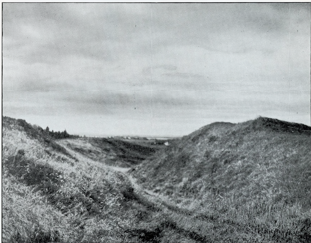
Hulvej i Hammer Bakke (Kikkenborg Bakke). Se Side 7 ff.