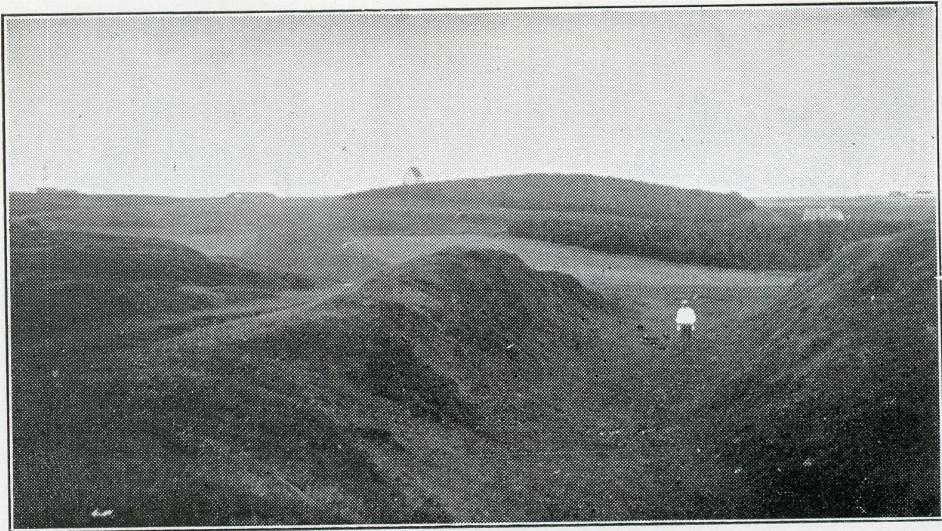
Vejspor sydvest for Saltum Kirke. Se Side 92.