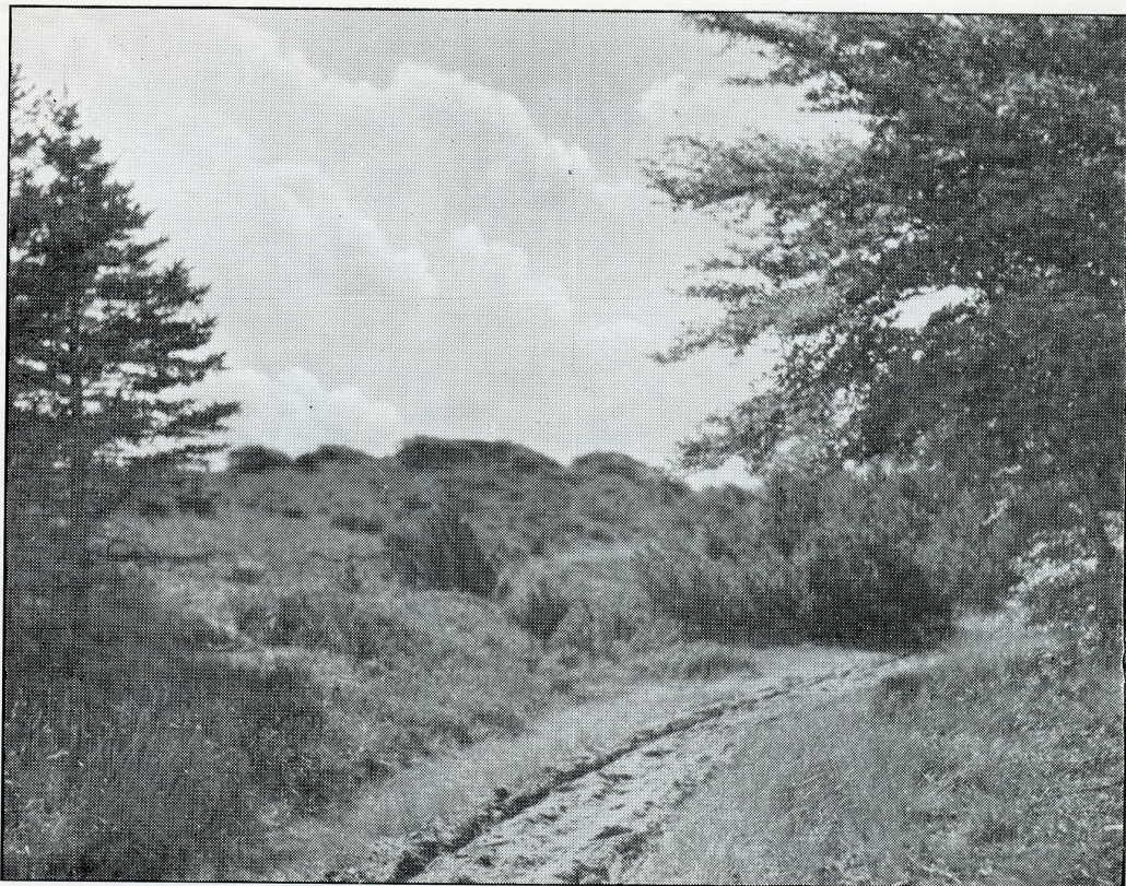
Vej gennem Ørndal i Hammer Bakker. Se Side 7 ff.