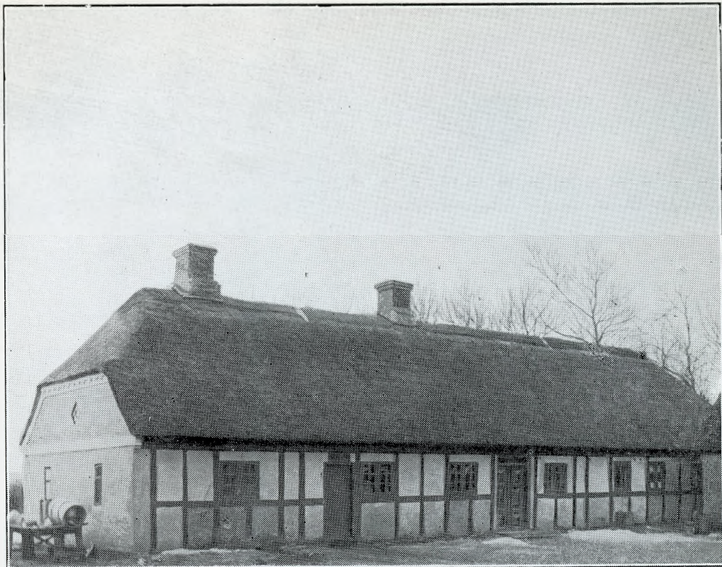
Langbrokro før Ombygningen. Se Side 8.