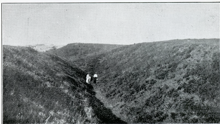
Hulvej nord for Harpsø i Taars Sogn. Se Side 42.