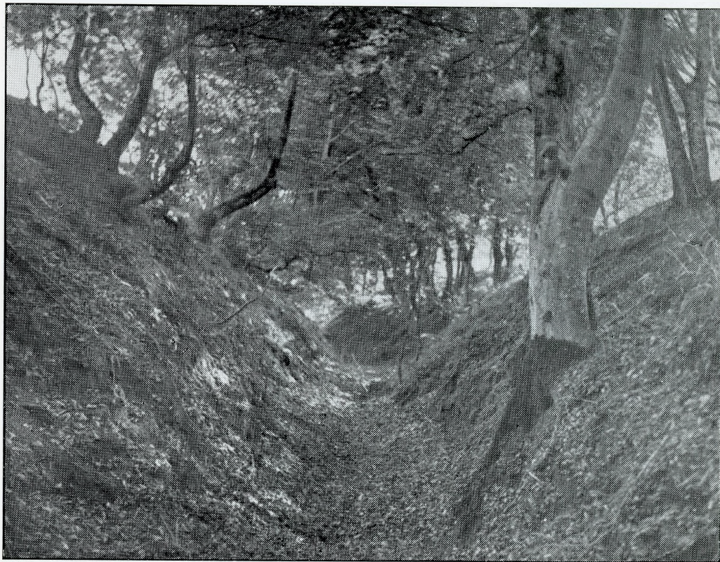
Kongevejen gennem Pankløften i Hammer Bakker. Se Side 7 ff.