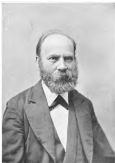
Evald Tang Kristensen