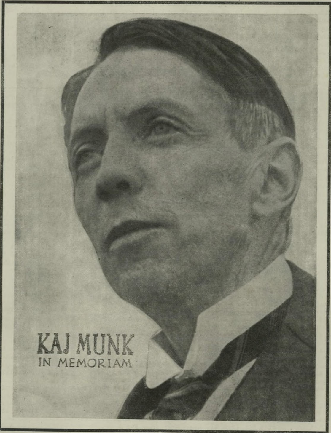
KAJ MUNK IN MEMORIAM

DANMARKS STORE SØN KAJ MUNK SIDE 2 DANMARK OG KRISTUS, EN NYTAARS PRÆDIKEN AF KAJ MUNK SIDE 3 GESTAPO MYRDEDE KAJ MUNK, POLITIUNDERSØGELSEN INDSTILLET SIDE 4 BILLEDER FRA KAJ MUNKS GRIBENDE JORDEFÆRD SIDE 5 SKANDINAVISKE MINDEORD SIDE 6