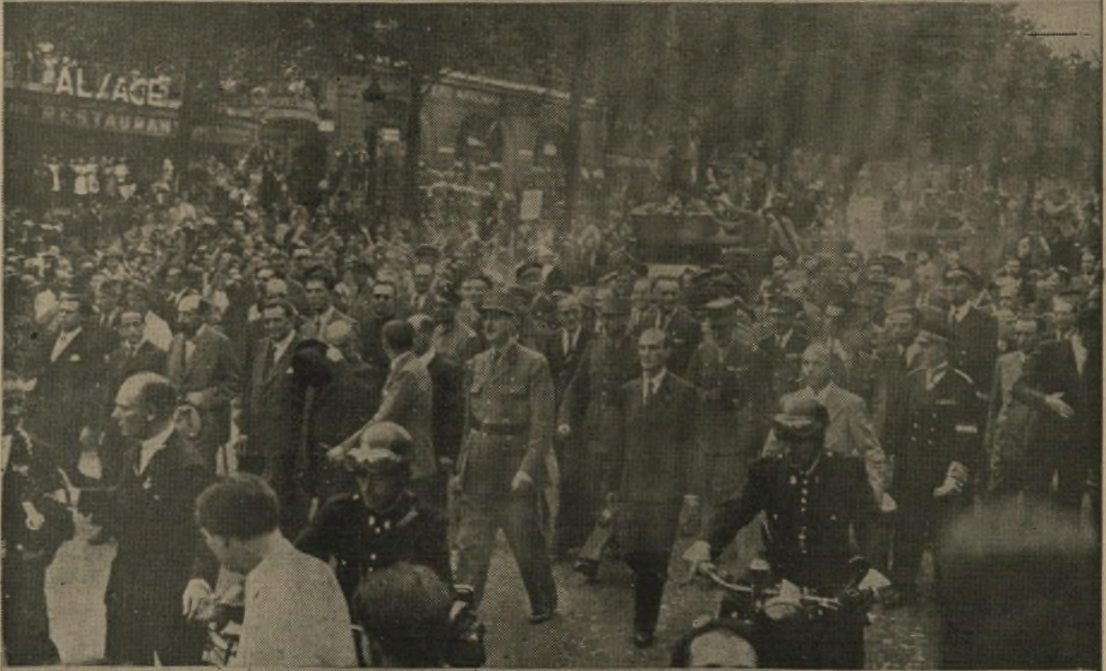
General de Gaulle og Ledere af den franske Hjemmefront i Spidsen for Processionen fra Triumfbuen til Place de la Concorde. Overalt hvor Generalen kom frem, tiljublede han af de begejstrede Parisere.