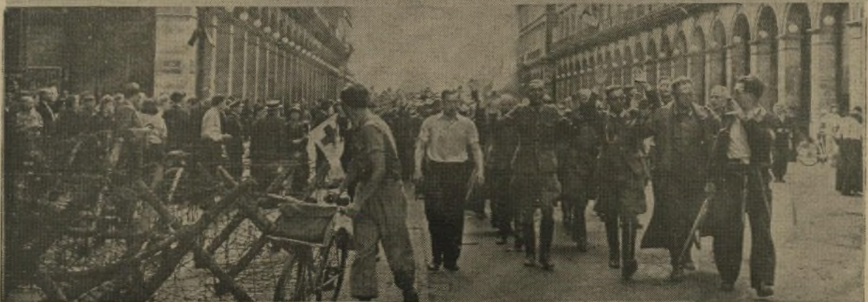
Fangne tyske Officerer og Soldater, bevogtet af frie franske Styrker, føres gennem Rue de Rivoli. Et opleftende Syn - i Ordets bogstaveligste Forstand.