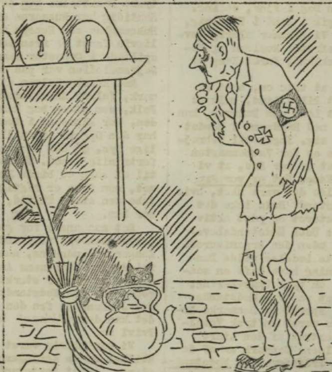
Tankefuld "Führer" i Bjergfæstningens Køkken: -Ak, hven der kunde flyve langt, langt bort... og saa være velkommen...

De britiske Soldater burde selv faa Lov til at bestemme, om de skal skyde Hitler eller tage ham lever