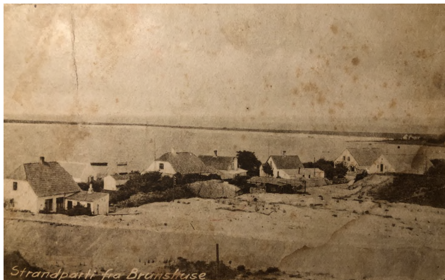
Cementstøberiet ses til højre i billedet

Omkring 1920 blev der bygget et cementstøberi på Brunshusevej 53, og en produktion af mursten, tagsten og rør begyndte. Tagstenen blev kaldt diagonalsten. Her i sognet og længere væk blev utallige huse og lader dækket med tagsten fra Brunshuse. De havde dog en fejl. De kunne ikke tåle fugten fra stalde. Så smuldrede de. Ellers kunne de holde i mange år.