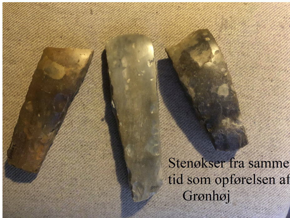
Stenøkser fra samme tid som opførelsen af Grønhøj

Stendysser og jættestuer blev brugt til begravelser resten af stenalderen.