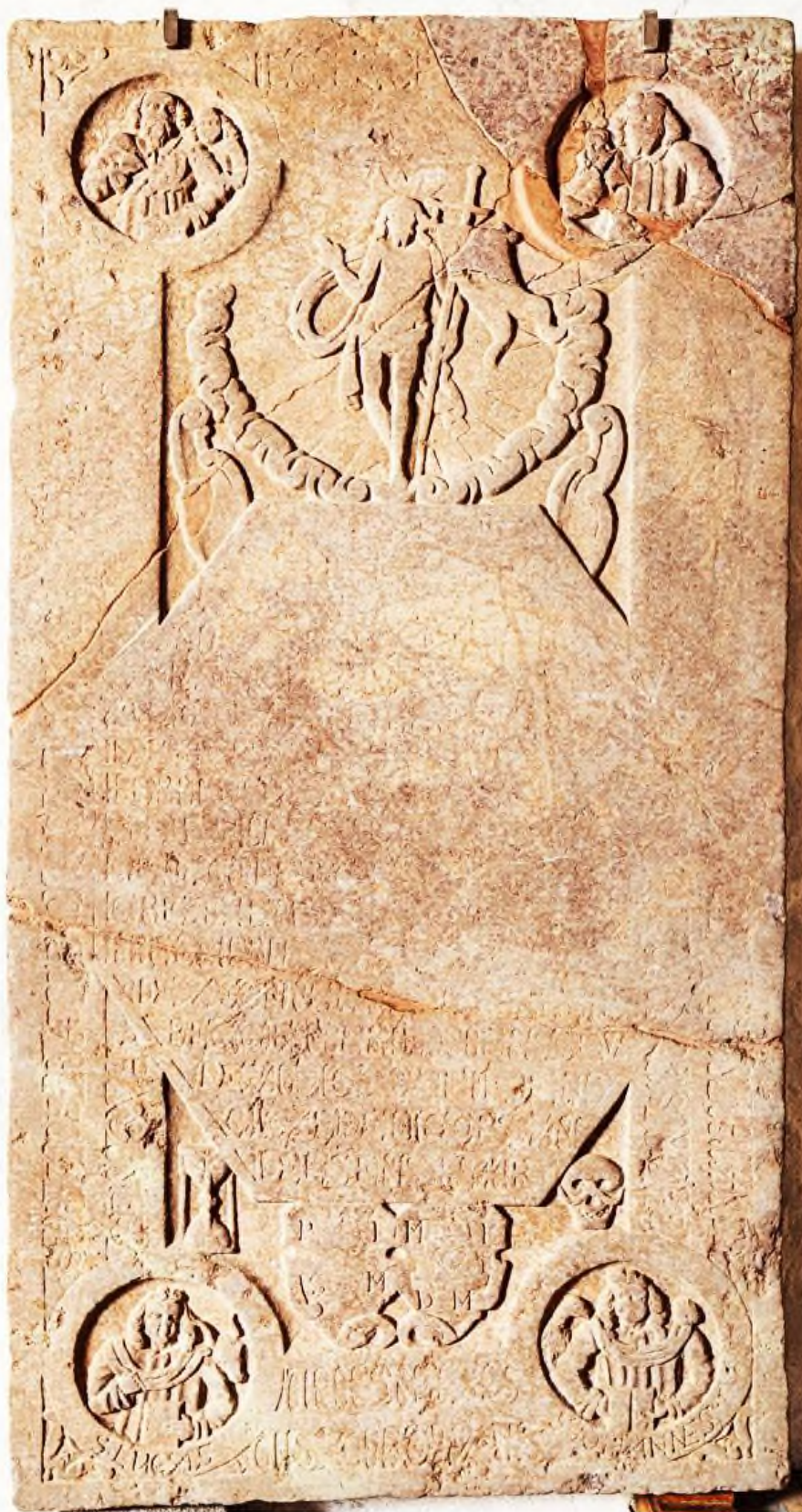
Peder Iversens gravsten, Egtved kirke, Formentlig slutningen af 1600-tallet.