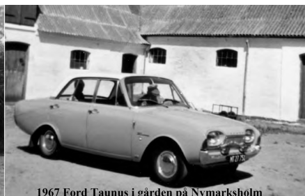
1967 Ford Taunus i gården på Nymarksholm