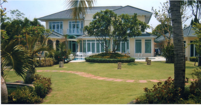
Jørgens hus i Bangkok

I Bangkok fik han bygget et dejligt hus med en skøn have og swimmingpool og garage med plads til 6 biler og en golfvogn. Den blev brugt, når der skulle handles ind. Ude ved stranden havde han en stor ferieejlighed, et stenkast fra havet. Før var der en bred sandstrand. Nu er der fyldt med skrald og plastic.