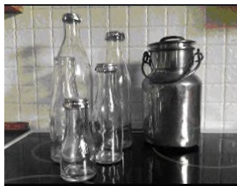
Den lille mælkespand