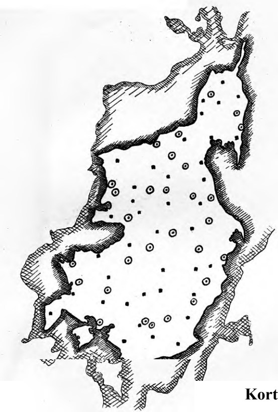
Kort over Mors.

Paa Kortet over Mors er de ældste Landsbyer angivet ved et lille Kvadrat. De omfatter bl. a. Byer, der ender paa -lev, -um, -inge, -sted, -by, -bæk og -toft. Torpbebyggelserne er angivet ved en Cirkel med et Punkt indeni. Man vil lægge Mærke til, at Torperne udgør en meget stor Del af samtlige morsingske Landsbyer, og at de ligger overalt, hvor der har været særlig langt mellem de gamle Adelbyer.