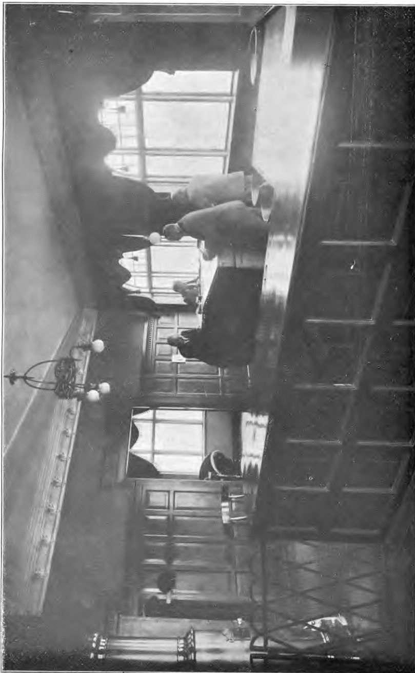
Interiør fra Sparekassens Kontor.