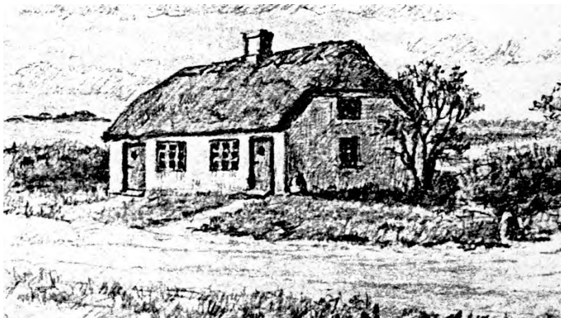
Fattighuset - Vester Kallesøehus