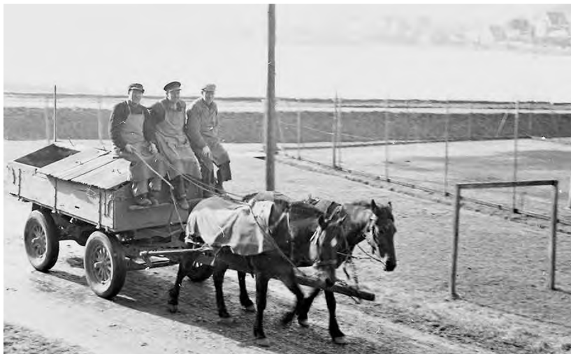
Skraldevognen er på vej i 1930

For natmændene var der nok at gøre, da der var kun få, der havde træk og slip. Hen ad de tider, hvor bedsteborgerne måtte forventes at gå til sengs, kørte chokoladevognen, som Bedste kaldte den, ud, og renovationsfolkene kom med deres flagermuslygter og hankede op i lokumsspandene, som de tømte ud i en åben kassevogn, hvorfra herlige dufte spredte sig i kvarteret. Efter endt nat-værk blev indholdet tømt ud i en latrinkule, ligeledes omme i engen, og på passende tidspunkter er det nok endt som gødning på bondens marker.