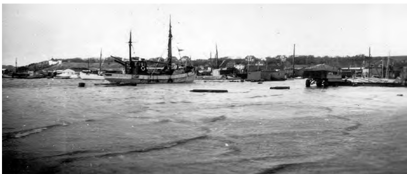
Oversvømmelse i Lemvig havn 1938

Samtidig med at fjordvandet steg, kunne søen heller ikke komme af med sit vand, og snart var søens og fjordes vand forenet over den tidligere engstrækning, hvor igennem åen i sin tid løb. Vandet har undertiden stået så højt, at det gik helt op omkring vores hus i Vasen, men dog ikke så højt, at det kom ind i huset.