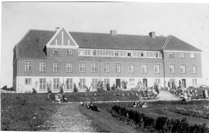
Nørre Nissum Højskole ca. 1950

Da jeg er blevet opfordret til at skrive om min tid på Nørre Nissum Højskole (NNH), skal jeg til at rode lidt i min hukommelse. Hvorfor blev det NNH? Jeg var ved landbruget og ville gerne på en højskole med landbrugsfag. Jeg så forskellige brochurer, og da jeg kendte Lemvig fra min barndom, hvor jeg havde holdt ferie ved mine bedsteforældre, mormor, der havde Strømpehuset, og bedstefar, der havde træskoforretning i Ågade 3 (som ikke eksisterer mere), tænkte jeg, at jeg jo havde familie i nærheden, som jeg kunne besøge.