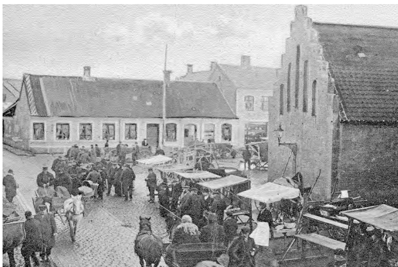
Torvedag i Lemvig 1910-1920

Ved kirkens nordvestre hjørne holdt grisehandlerne til. De kom med større og mindre grise i store tremmekasser, og når der kom liebhavere, blev grisene halet op enten i ørerne eller i bagbenene for skrigende at blive præsenteret.