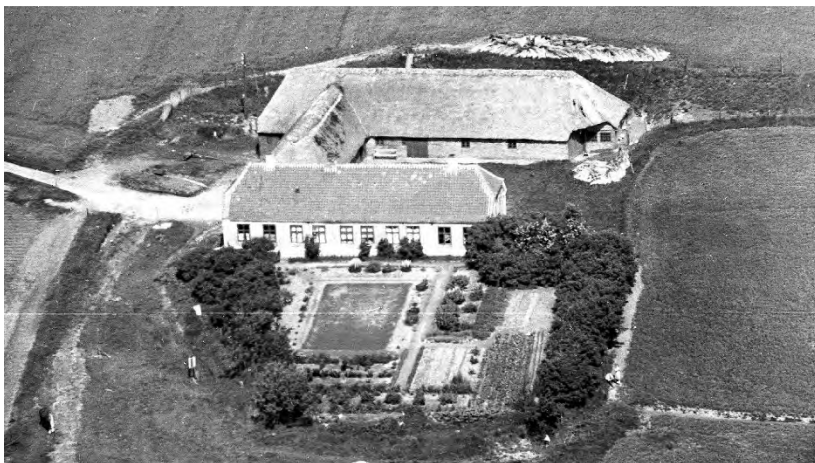
Tørring-Heldum Fattiggaard 1948