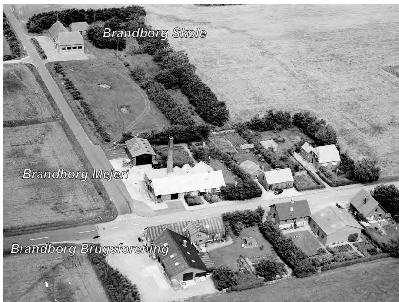
Brandborg ca. 1980.