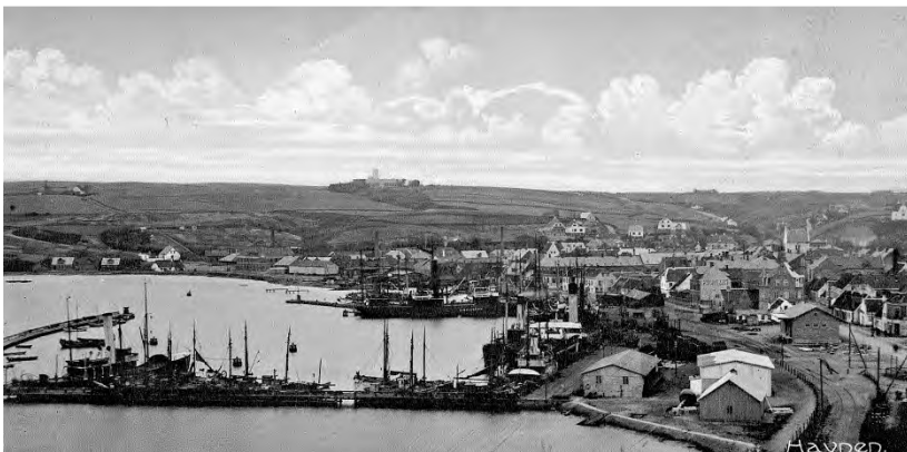
Lemvig med havnen set fra Vesterbjerg 1910-1920