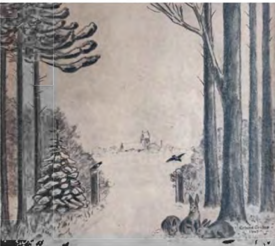
Parti fra Lystrup Skov med Slangerup Kirke i Baggrunden. Tegning af Erland Gribso 1947.

Legenders Overlevering og Levedygtighed, deres Nøjagtighed og Unøjagtighed - en Blanding saa festlig og spændende som selve Julens Blanding af alvorlig Højtid og lys og barnlig Glæde”.