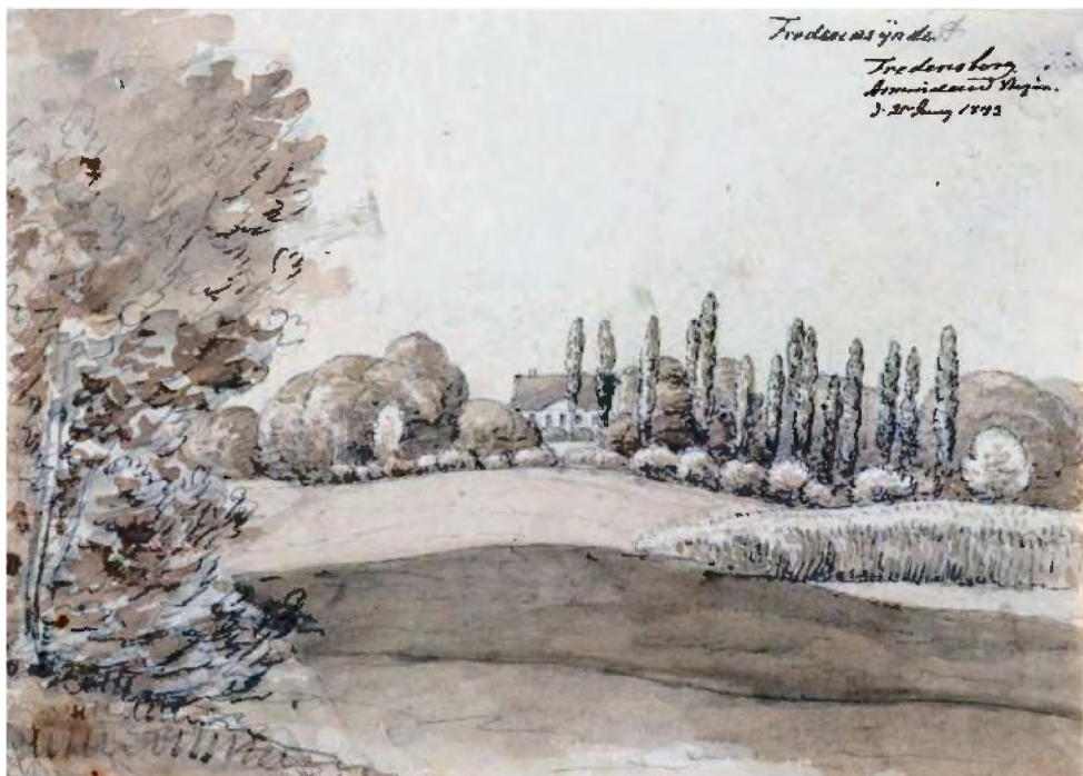
Landskab ved Fredensborg med Frederiksyndest i baggrunden. Tegning af Ole Jørgen Rawert 1843.

han avanceret til theandler. Hvorfra efternavnet Soelberg kommer, mangler jeg oplysninger om.