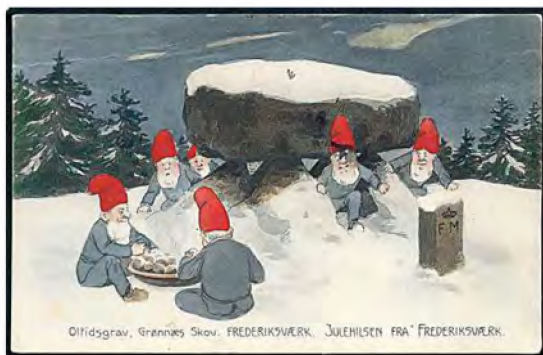
Oftidsgrav, Grønnes Skov, FREDERIKSVÆRK. JULEHILSEN FRA FREDERIKSVÆRK.

Kysten. Paa Grund af sit Udseende, og fordi han havde holdt sig skjult og gennem længere Tid havde foraarsaget, at Køerne næsten ingen Mælk gav (af gode Grunde, han levede jo dog af deres Mælk), havde han indgydt Karlene en navnløs Rædsel, fordi de troede, det var et Gespænst, der huserede paa Øen. Og det var netop en højhellig Juleaften, at det lykkedes det stakels gule »Gespænst«, drevet af Kulde og Sult at komme med, da Mælkebaaden efter sin daglige Malketur til den lille Ø igen satte Kursen hjemefter. Og saa kom han jo til Højborgs og fik varm og rigelig Mad og tykt og dejligt islandsk Uldtøj. Navnet »Tjim-Tjim« fik han i Tilgifts, for det var alt, hvad han kunde sige, og alt hvad mine Tipoldeforældre kunde opfatte af Kinesisk. Maaske bør jeg tilføje, at Historien aldrig i sin selvfølgelig lange, vidtløftige og spændende Gengivelse, spækket som den er med Enkeltheder, der snart faar Børnene til at gyse, snart til at juble, faar Vægten lagt paa det moralske. Ej heller bliver den forandret, for ve den Tante, som laver blot ét Ord om paa den, hun vilde snart faa med alle de andre at gøre. Den første, der fortalte den i Kongeriget Danmark, henlagde Handlingen til Jyllands Vestkyst, og kom godt fra det - men siden da er den blevet, som den er, et Vidne om Folkehistoriers og