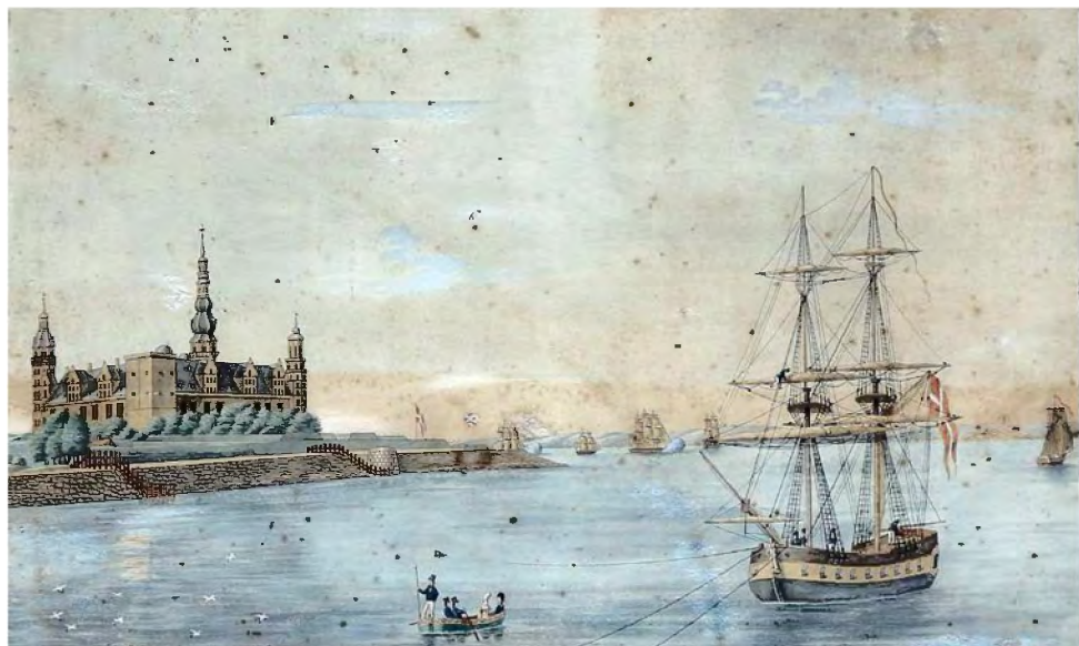
Færgebåd fragter besætningsmedlemmer fra det opankrede skib ind til Helsingør. Udateret akvarel. Privateje.

transport til lands, havde direkte adgang til transport til vands. Til lands foregik transporten som i resten af landet til fods eller med egen eller lejet hestevogn, eller man benyttede postvognen, som også medtog passagerer. Postvognen kørte ruten København-Helsingør ad Kongevejen, som var blevet anlagt i årene 1779-1793, og som afløste ruten ad den oprindelige Strandvej langs kysten, som var vanskelig at vedligeholde. Fra 1804 afgik postvognen 2 gange dagligt om sommeren og en gang dagligt om vinteren, og turen tog ca. 7 timer incl. ophold for at bede hestene undervejs. Togdriften København-Helsingør blev først etableret i 1864, 6 år efter B.R. Lunds død – og 17 år efter den første jernbane i Danmark var blevet anlagt mellem