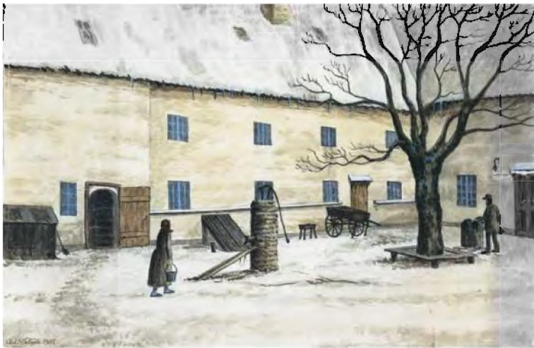
Vinterstemning i Karmeliterhusets gård i Helsingør dengang bygningen fungerede som fattighus. Akvarel af Carl Nielsen 1895.

Det er altid forekommet mig, som det gamle Aar dog fik Broderparten af al den megen Skyden og Larmen; maaske var Grunden dertil, at man ikke havde været rigtig fornøiet med dets Gaver. Forøvrigt vedblev Skydningen, saa at sige, til Dagen brød frem, om den end henad Morgenstunden tog betydeligt af. Langt tidligere paa Aftenen, saasart det var blevet mørkt, indskrænkede Spektaklet sig til, at man slog Potter eller Potteskaar paa Venners og Bekjendtes Døre, og man havde da gjerne en Hø- eller Halmmaske for Ansigtet for ikke at blive kjendt. Blev man greben, hvad undertiden skete