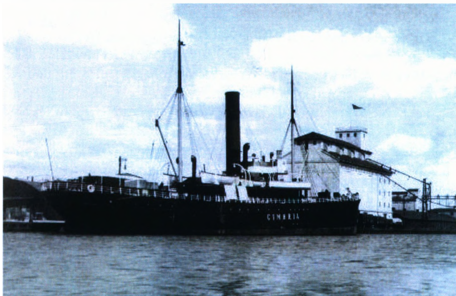
Rutebåden Cimbrja, der sejlede mellem Randers og København.

På havnekajen var der en ganske særlig afskedsstemning ved afsejlingen. Passagerne vinkede farvel til de pårørende eller venner, der begge steder stod og vinkede med deres lommetørklæder. Far og jeg var tit med hinanden på havnen ved afgangstid for at opleve stemningen.