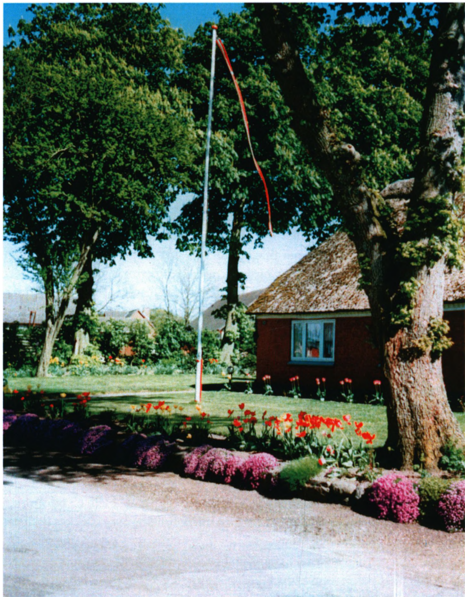
Hjemmet på Hollandsbjergvej 43.

kom nyt stråtag på, der blev bygget om og indrettet, der kom oliefyr og badeværelse, murværket blev repareret, og der blev isat nye vinduer. Over et længere tidsrum blev alt lavet om, og resultatet var et lille idyllisk sted, som på et tidspunkt blev præmieret for fin og nænsom restaurering af byens Byfornylsesudvalg eller måske bygningskulturudvalget. Det var også et meget nydeligt sted, og det glædede mor og far og selvfølgelig også alle os andre.