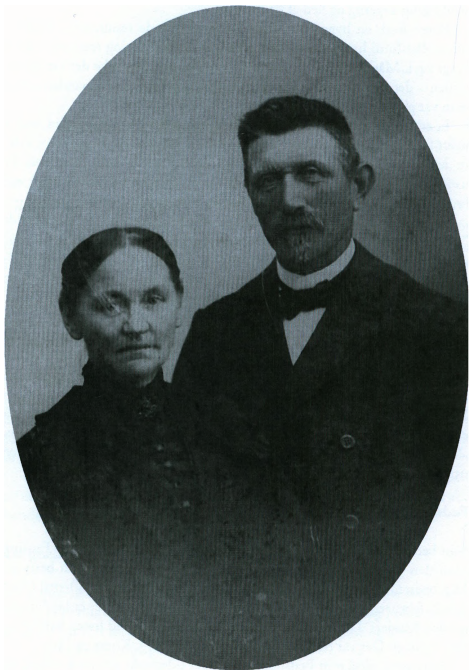
Bedstefar og Bedstemor i Hollandsbjerg (Farmor og Farfar).