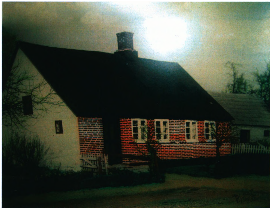
Huset i Bode.