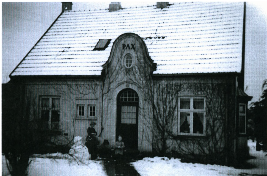
Villa "Pax" på Storegade 100. Vi flyttede ind i oktober 1957.

dørene, de var som små føl, der var sluppet løs på marken.