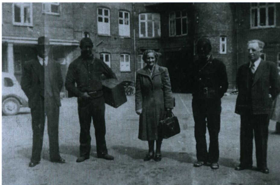
Svendeprøve i Randers. Fra venstre far, jeg og mor. Til højre en medlærling og hans far.

Efter de fire års læretid og bestået lærlingeskole på Teknologisk Institut kom jeg til svendeprøve i Randers. Svendeprøverne blev arrangeret forskellige steder i landet fra år til år. Der afholdtes svendeprøver to gange om året. Jeg husker ikke meget fra min svendeprøve, men dog den stiskorsten, jeg måtte igennem. Mor og far var med og overværede forestillingen. Det var en kulfyret bageriskorsten i Storegade. Hvor høj den var, husker jeg ikke, men jeg er sikker på, den var høj nok. Skorstenen var fra et bageri i en sidebygning til en firetages ejendom. Der var kun en vej – se at få det overstået. Vi var to lærlinge, der havde den skorsten. Vi var sorte – se billedet. Jeg ved egentlig ikke, hvordan mor og far de tog den oplevelse, men jeg tror i hvert fald