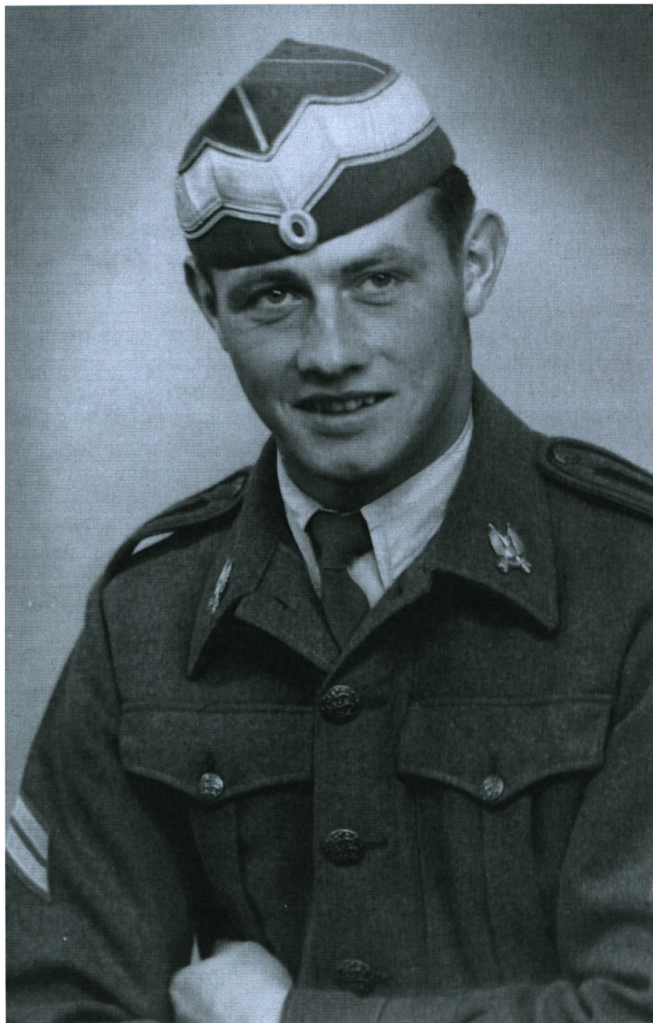
Jeg blev soldat i 1951.