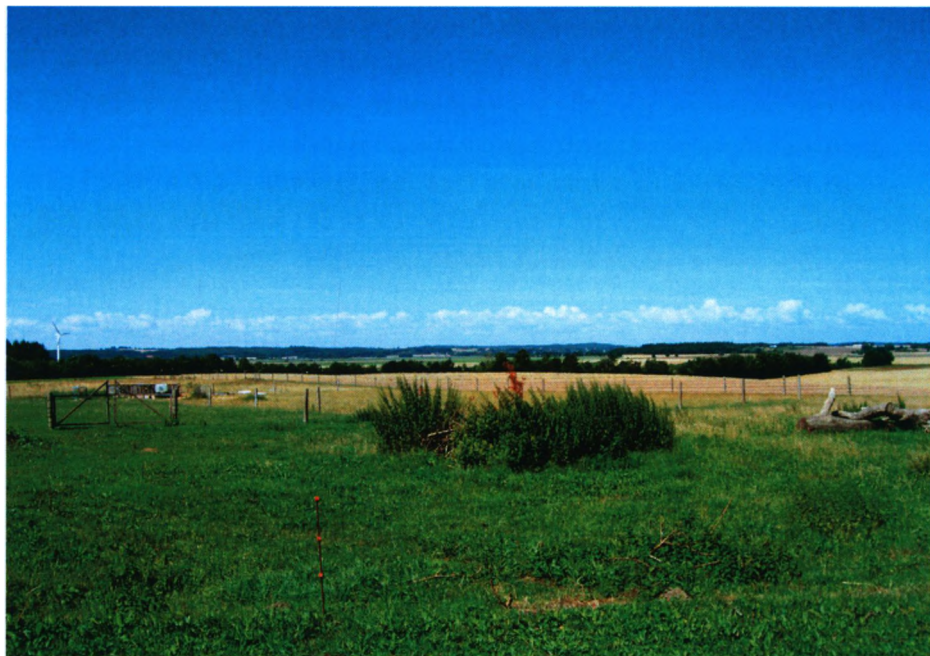
Udsigten fra Engskuegård.

over nogle ting, hun engang har bemærket, er det aldrig over for mig blevet uddybet nærmere. Jeg kunne dog have en anelse om, at det kunne stamme fra dengang, mor var pige på gården og blev gravid.