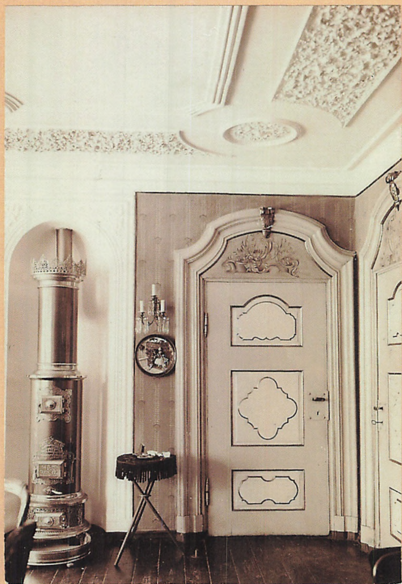
1915. Interiör fra Köbmd. Trojels Gaard, N o 16 Vestergade. Malt: N o 11.