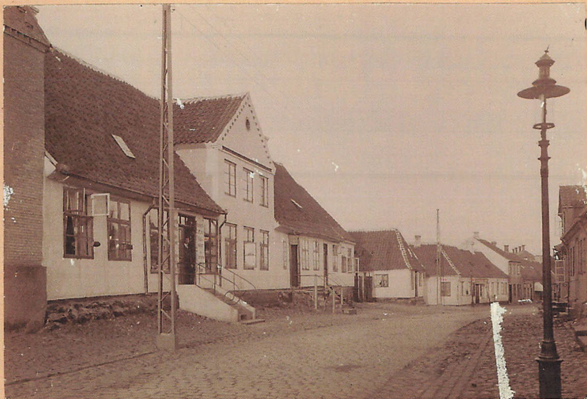
1915. Moltegades midterste Del, set mod Øst.