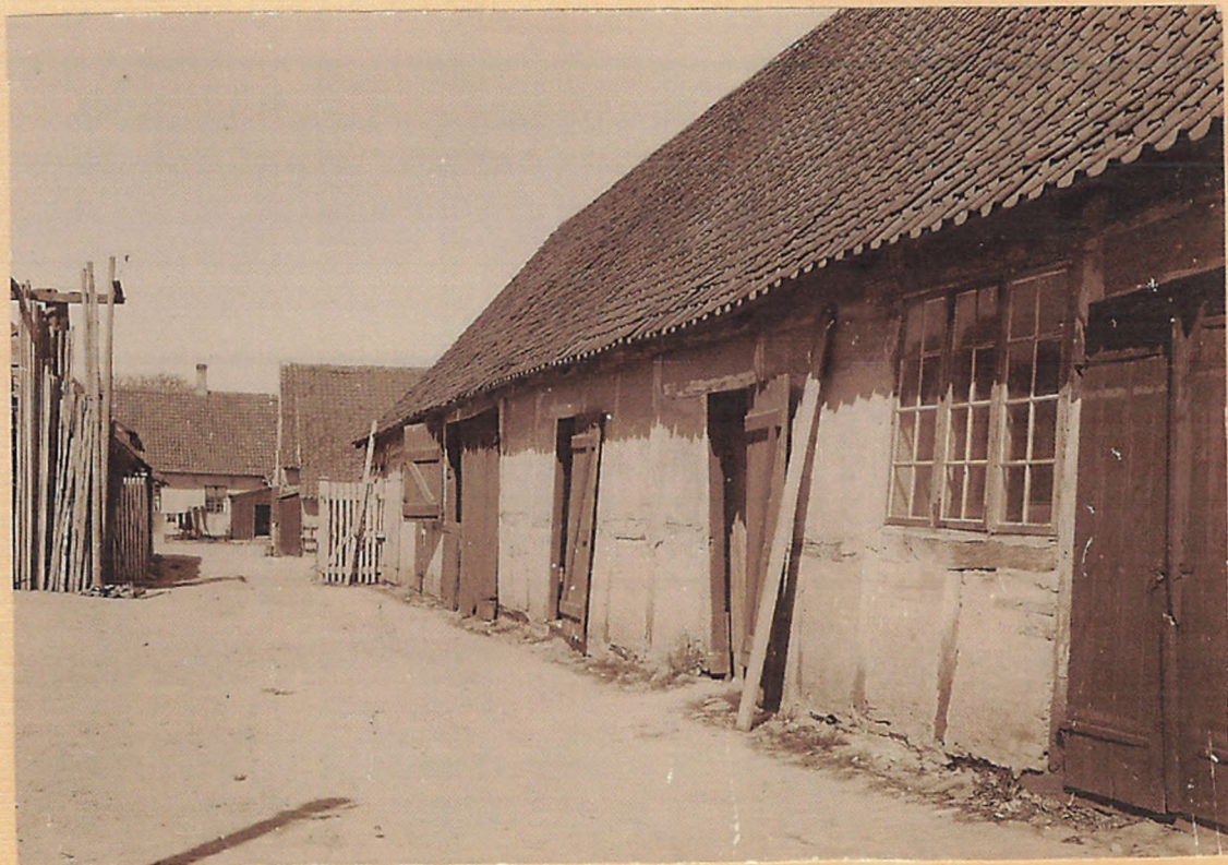
1915. Parti fra P.W. Wulffs Tømmerplads. Matr. N o 48 b.