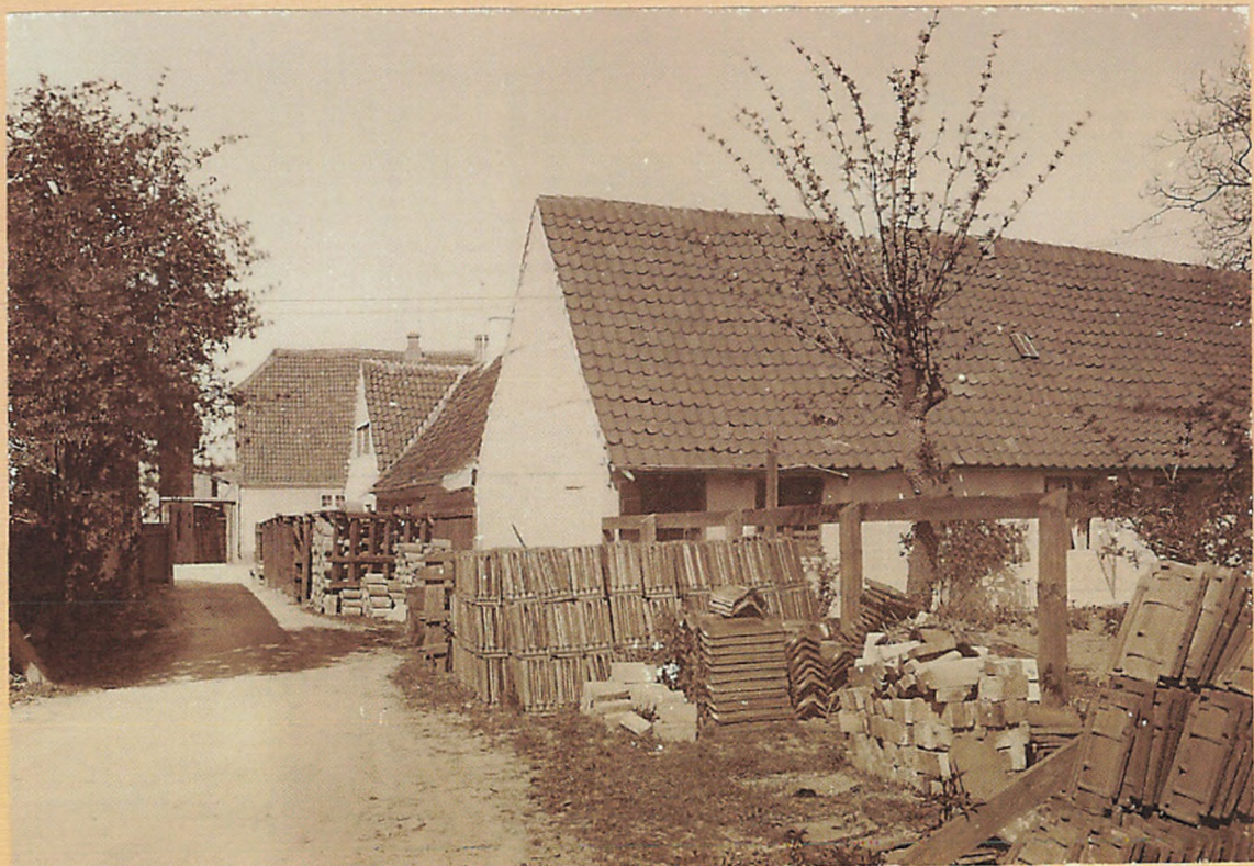
1915. Parti fra P.W. Wulffs Tommerplads, Gennemkørselen ved No 27 Østergade. No: No 49