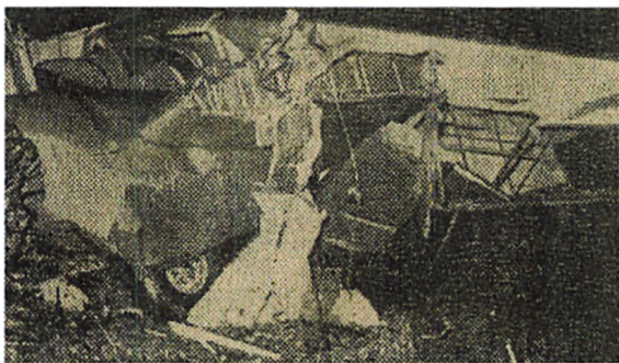
En del af det havarerede fly.