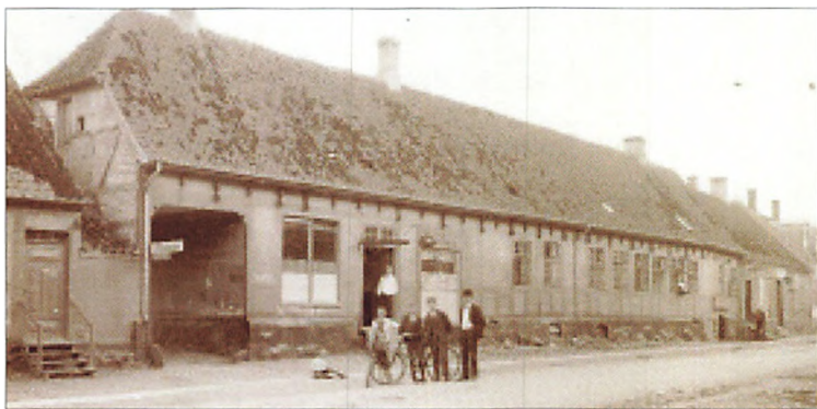
Fortunen på et ældre foto fra 1914

I 1800-tallet var der hotel i bygningen. Da Benzons gård på Vestergade 10 i 1899 blev solgt, blev den ombygget til hotel med ny stor sal, og da hotelejereren fra "Fortunen" flyttede til det nye hotel tog han navnet "Freys Hotel" med.