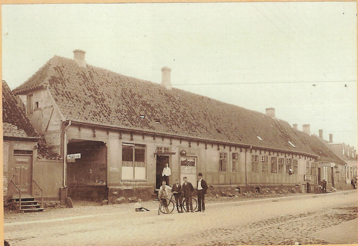
1914. N o 31, 33, 35 Vestergade, „Fortinon“, tidligere havde „Tveys Hotel“ til Huse her. Matr. N o 48 a