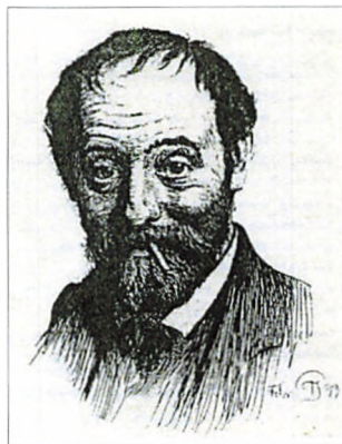
Selvportræt af Peter Ilsted Sign. PJ 99

I disse meget tiltalende Omgivelser har jeg altid fundet den venligste Modtagelse som kan tænkes. Jeg kom som Regel en af to gange om ugen, nød en Toddie sammen med Peter, opfriskede kunsthistorie fra de senere år i Kjøbenhavn, hvad der var nødvendig for at holde Peter vaagen indtil et nogenlunde rimelig Tidspunkt for at gaa i seng, der blev nu redt en højst tiltalende Feldtseng til mig i den store stue, og nu læste jeg i en god bog i Fred og Ro og glædede mig over at være i mere civiliserede Omgivelser, den næste Morgen vandrede jeg igjen ud til Halskov, saa tidligt at ikke synderligt af den tid jeg ellers brugte til at arbejde om Formiddagen gik tabt for mig. Jeg havde mange fornøjelige og hyggelige Timer i Lundehuset dog kom jeg endnu et Sted som fik en adskillig større Indflydelse paa mig og som jeg mindes med endnu større Glæde, dette Sted er Horbeløv Præstegaard.