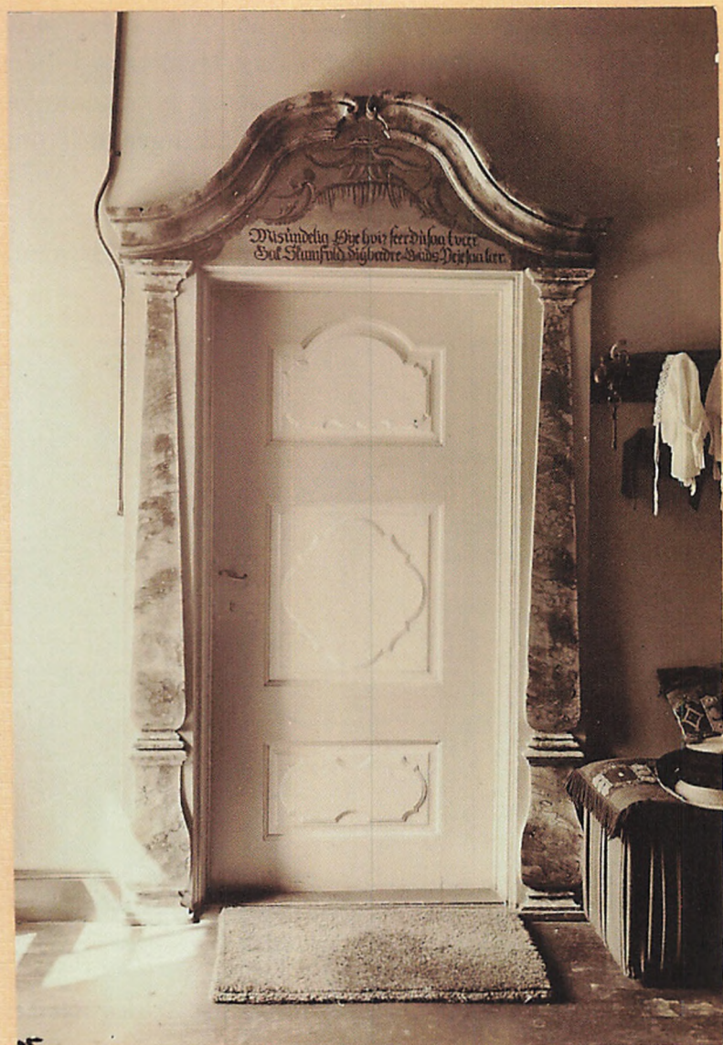
25 1915. Dør i Købmand Trojels Gaard, No 16 Vestergade. MN o 11