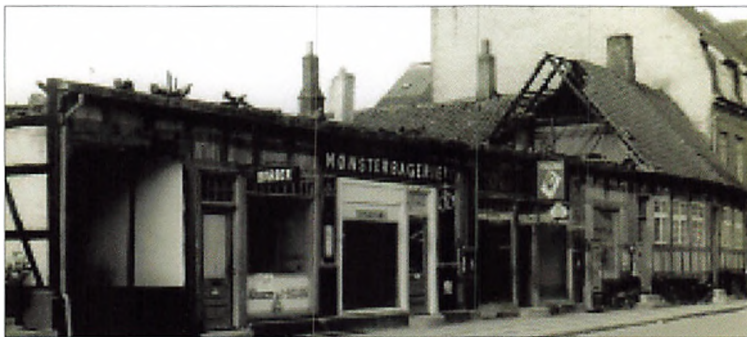
- og efter branden i 1961