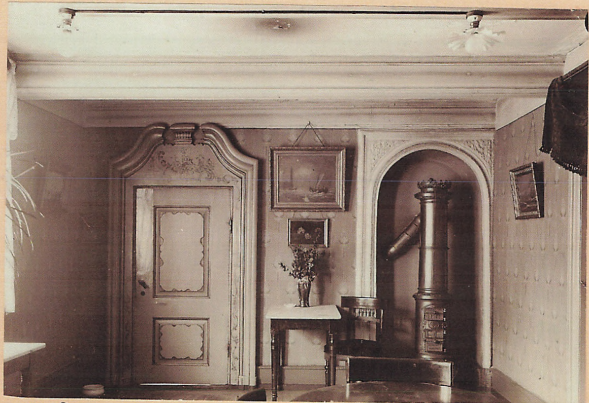
1915. Interiör från "Fortunen", tidigare "Frøys Hotel", N o 33 Vesteregade. Matr. N o 48a