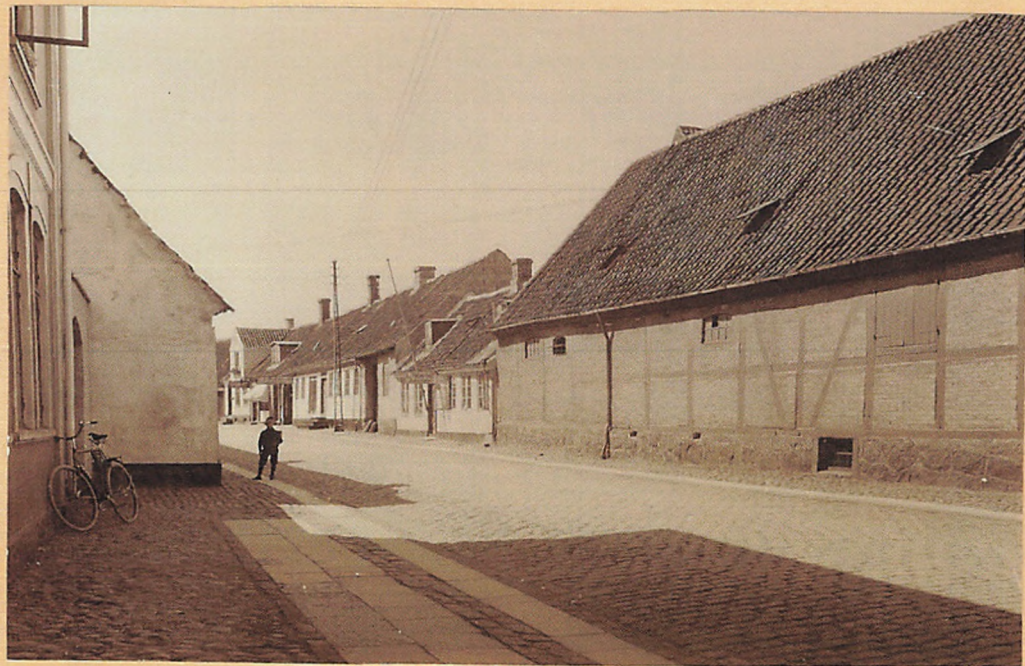
1915. Søndergade, set mod Vest.