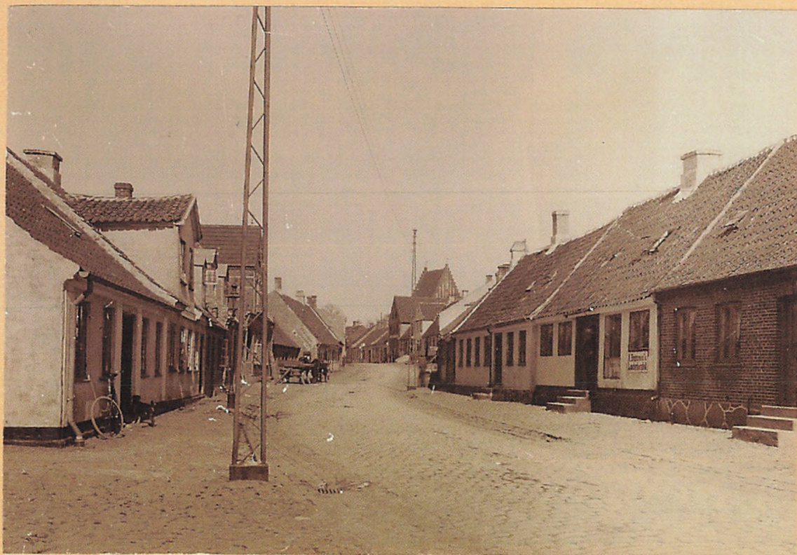
1915. Møllogade, set mod Vest.