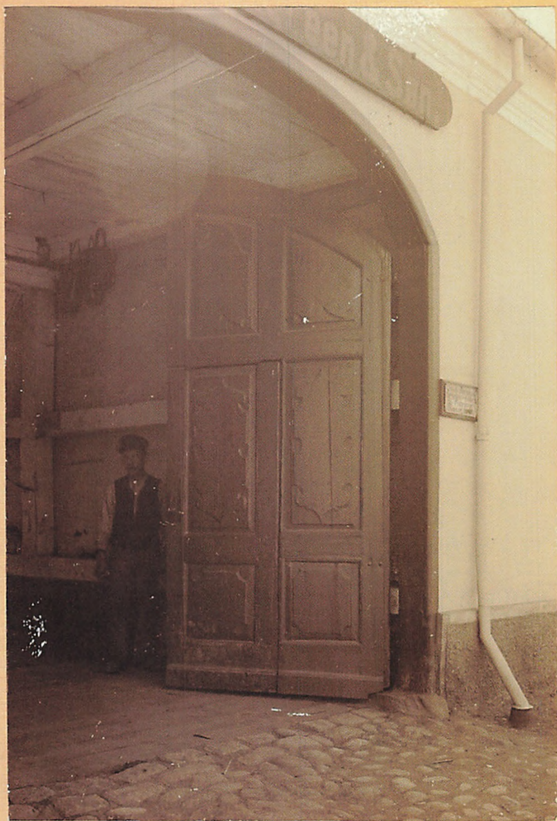
1915. Port, N o 57, til Anker-Høegwards Gasmaalerfabrik, Vestergade. Matr. N o 41.