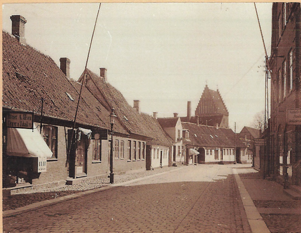
1915. Søndergade, set mod Øst.