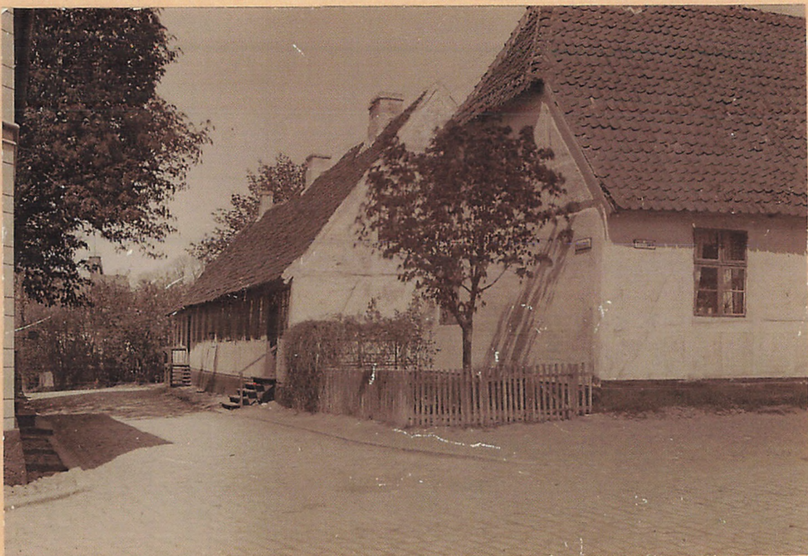
1915. Hjørnet af Vesterstrædes Købmand. Hanson-Erichs Gaard. Matr. No 3