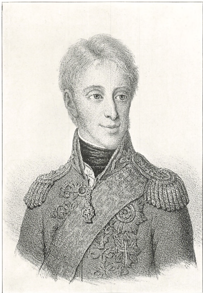
FREDERIK DEN SJETTE