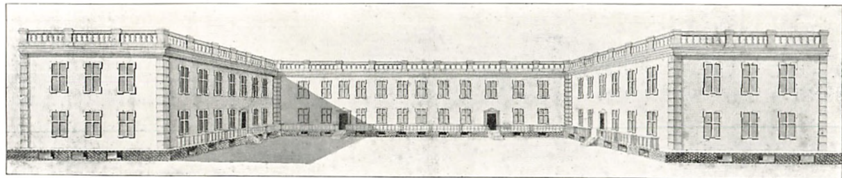
ET AF GENERALEN TEGNET UDKAST TIL EN OMBYGNING AF TRANEKÆR