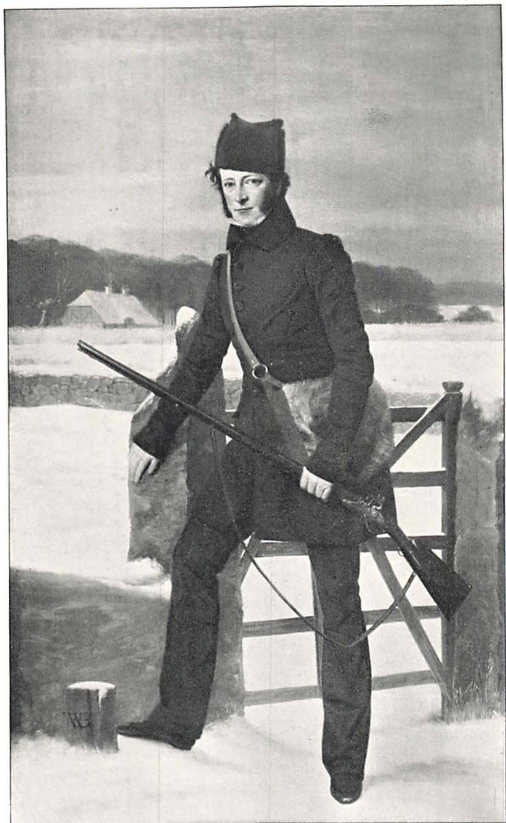
GENERALENS BRODERSON OG ARVING