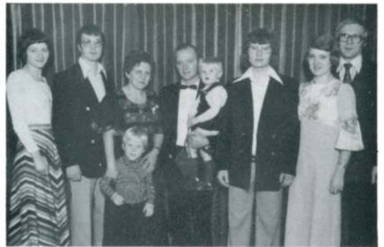
IV.G.6.e. Familien Lerkilde.