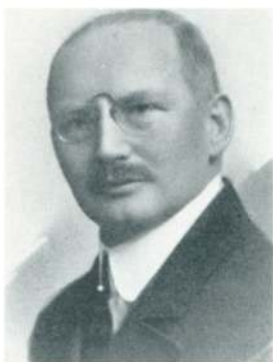
Konsul Gustav Arentz