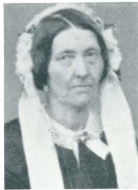
Andra, f. Selner

Arentz ble fenrik a la suite uten ansiennitet ved 2. Trondhjemske nasj.inf. regt. 17. des. 1808, interimistisk ansatt som sekondløytnant til 25. jan. 1809. Fenrik 25. jan. 1809, fikk sekondløytnants karakter 2. juni s. å. og virkelig sekondløytnant 2. juli 1811. Han tok eksamen fra Trondhjems Offisersinstitut 1811. Deltok i 1814 i de nordenfjeldske troppers marsj søndenfjelds og deltok med ikke liten koldblodighet og dødsforakt i affærene ved Lier og Matrand . Ble premierløytnant 13. feb. 1815 og ansatt ved Trondhjemske inf. brigade fra 1. jan. 1818. Var 1823 regnskapsfører for det Romsdalske musketerkorps , ble stabskaptein med anc. fra 23. nov. 1835. Han tjenstgjorde hele sin tid i Trøndelag og tok avskjed 6. mai 1854.