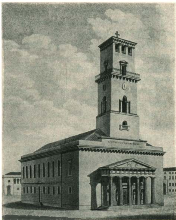
Vor Frue Kirke 1829 ved G. F. Hetsch og J. Holm.

landet, kom han oftere til hende for at spørge om Efterretninger fra mig. Tillige fortalte hun, hvad jeg her ikke vil forbigaae, at han stundom blev siddende hos hende, og at hun fandt stort Behag i hans Samtale.« 1) (Sml. P. I, s. 2).