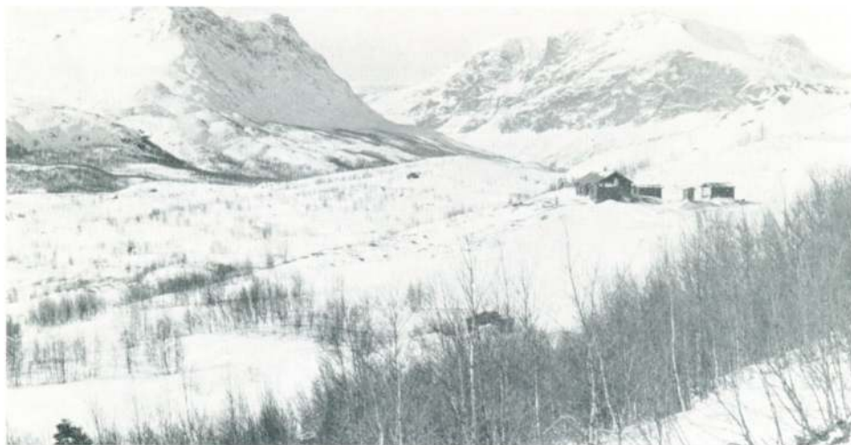
Hagastølen i Grunke beliggende i V. Slidres Vestfjeld 900 m o. h. Fot. P. O. Tuff 1960.

Det naturskønne Valdres virker særlig dragende på dem, som er bundet til distriktet ved ejerforhold eller slægtskabsbånd.