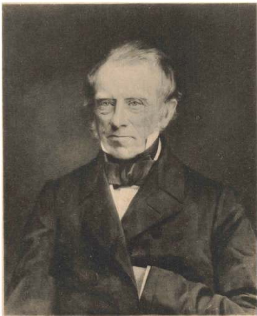
GEHEIMEKONFERENSRAAD CARL VILHELM RABEN-LEVETZAU, f. 1789 † 1870.