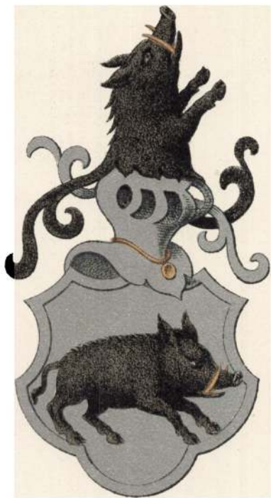
Griis af Slette.