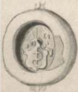
Las Grøn i Tandrup 1580.