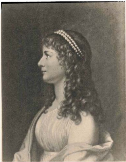
MARGRETHE BENEDICTE GREVINDE REVENTLOW, FØDT VON QUALEN, f. 1774 † 1813.