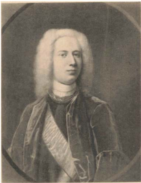
GEHEIMEKONFERENSRAAD CONRAD DETLEV GREVE REVENTLOW TIL GREVSKABET REVENTLOW ETC., f. 1704 † 1750.