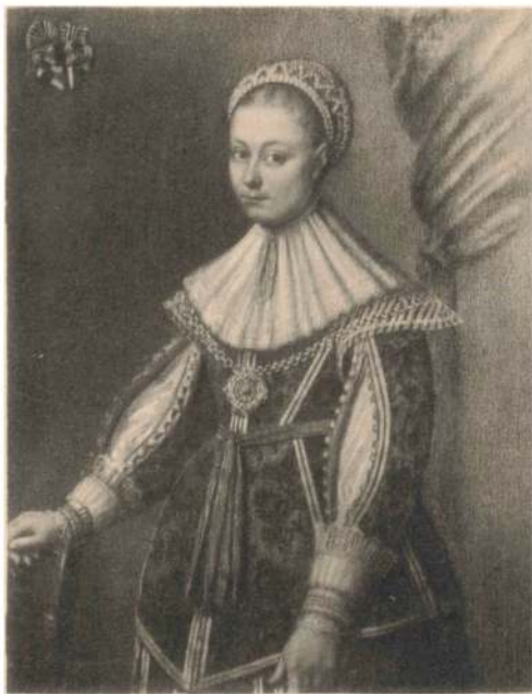
FRU METTE BRAHE OTTE MARSVINS, f. 1579 † 1641.