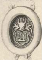
Christoffer Grøn 1591.