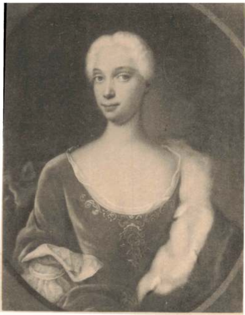
VILHELMINE AUGUSTA GREVINDE REVENTLOW, F. PRINSESSE AF SLESVIG-HOLSTEN-SØNDERBORG-PLØEN, f. 1704 † 1749.