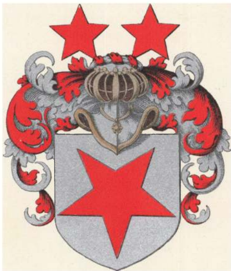
Griis af Halland.