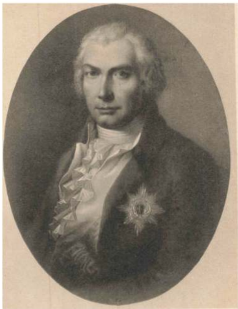
GEHEIMESTATSMINISTER CHRISTIAN D. F. GREVE REVENTLOW TIL GREVSKABERNE CHRISTIANSSÆDE OG REVENTLOW, f. 1748 † 1827.