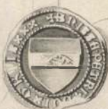
Nicholaus Griis 1397.