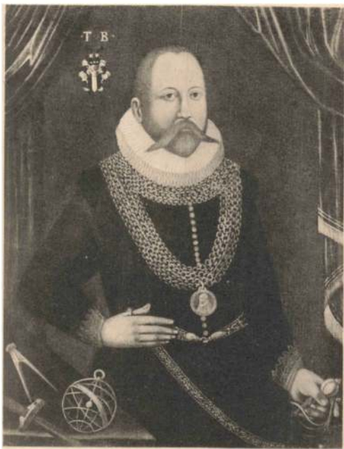
T Y C H O B R A H E TIL KNUDSTRUP, f. 1546 † 1601.