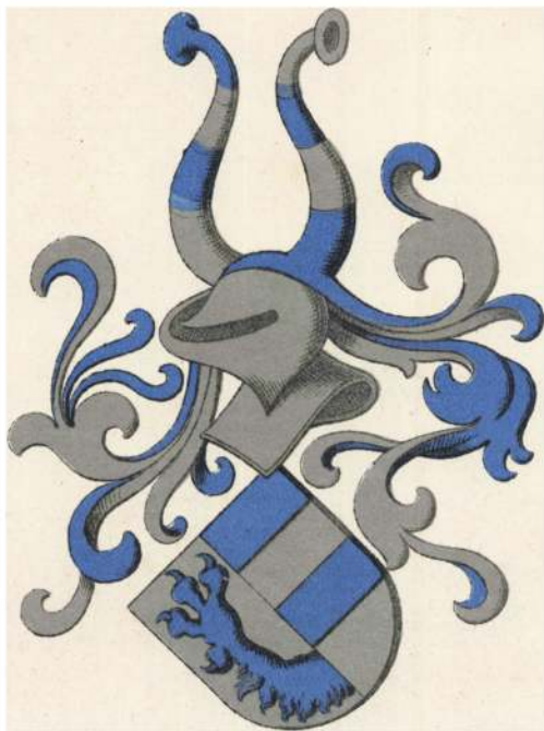
Griis af Nordrup.