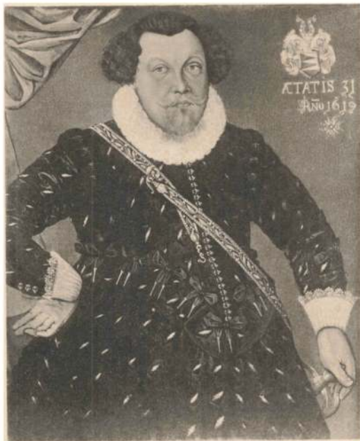
JESPER GRUBBE TIL OLSTRUP, f. 1588 † 1622.