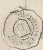
Nis Grubbe i Fodæk 1478.