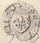
Petrus Griis 1394.