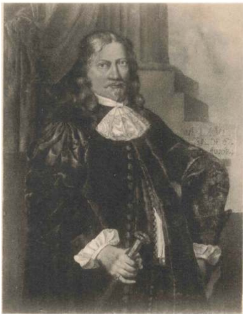
LAGE BILLE TIL HAVRELYKKE, f. 1607 † 1679.