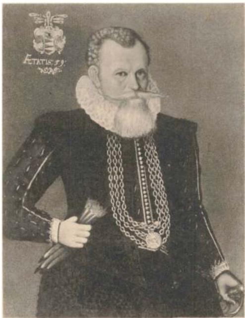
PEDER GRUBBE TIL OLSTRUP, † 1614.