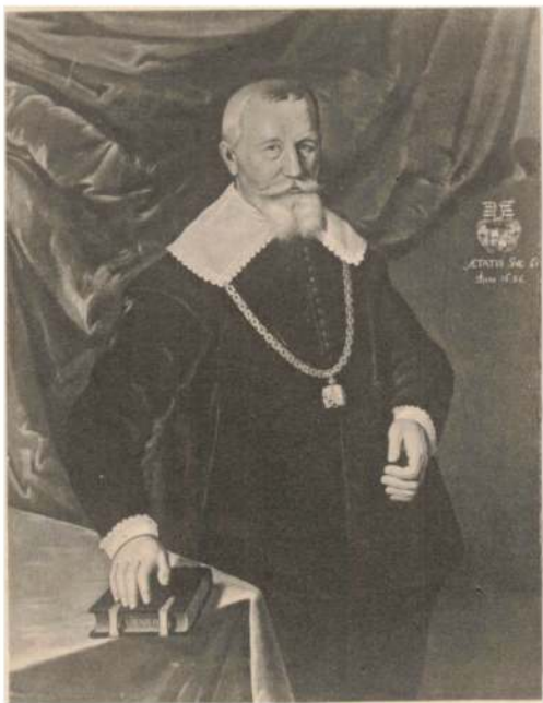
HOLGER ROSENKRANTZ TIL ROSENHOLM, f. 1574 † 1642.