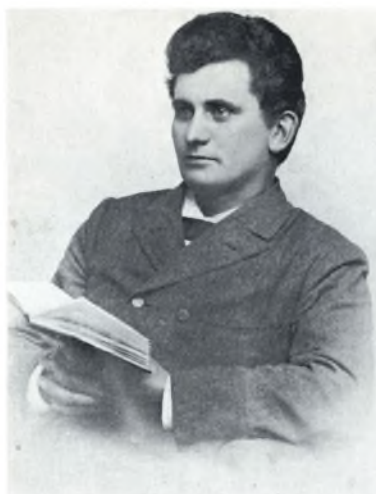
Den unge lærer