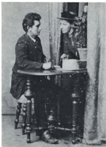
Idyl, men endnu ikke gifte. 1890