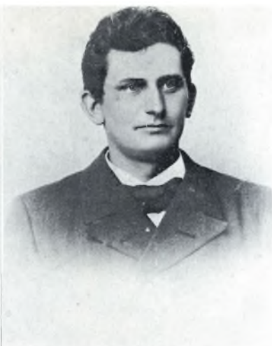
Kommandanten på »Hvide Hus«