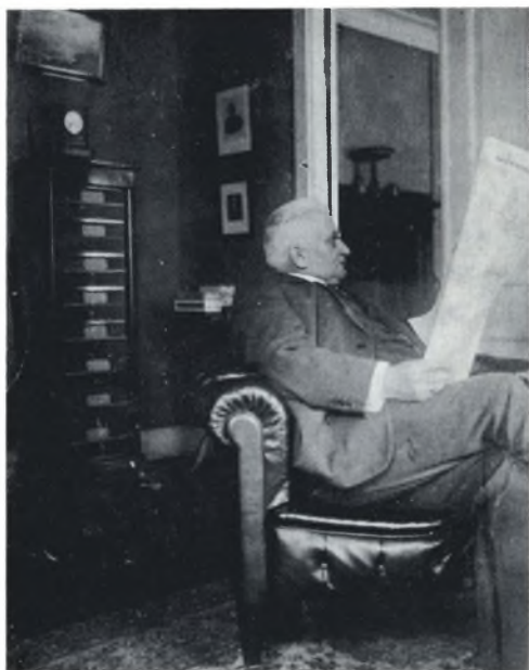
På Værnedamsvej. Hvad mon aviserne siger?