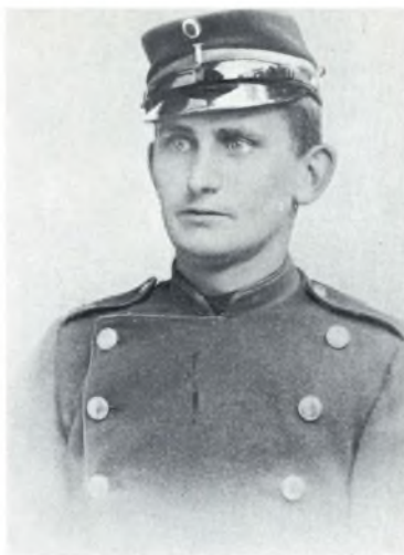
Rekrut nr. 122, 1. bat. 3. komp. 1890. »Trekroner«