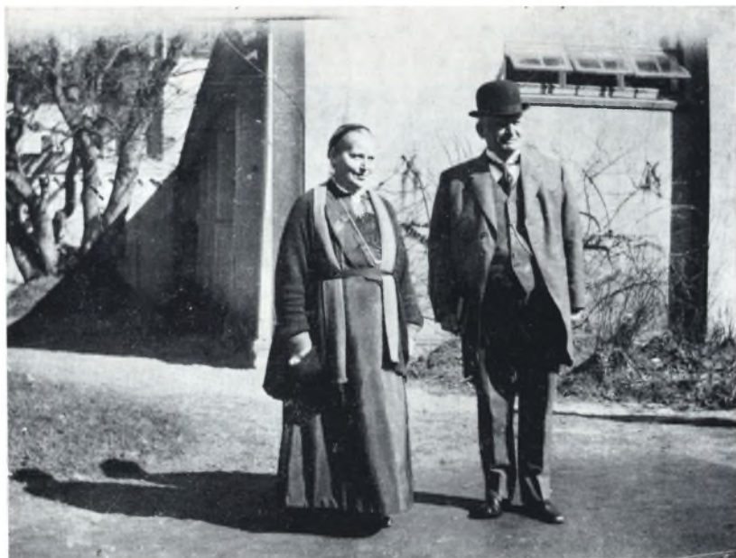
Det sidste besøg hjemme 1924, da han ved, han skal gå af