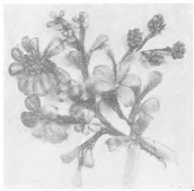
Mindebuket flettet af forskellige Wolffsen'ers Haarlokker