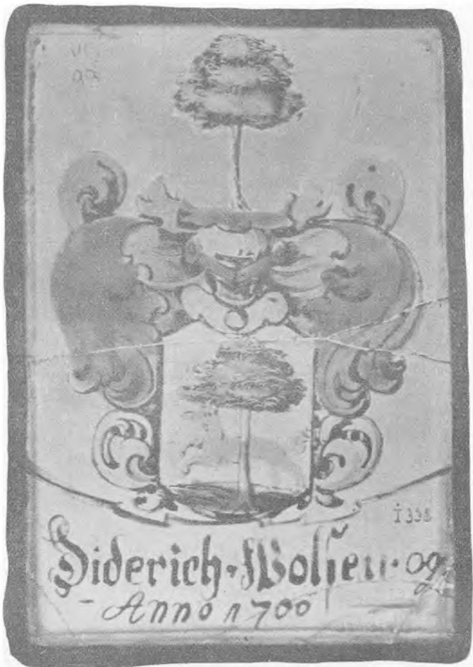
Diderich Wolfsens Minderude i Nationalmuseet.