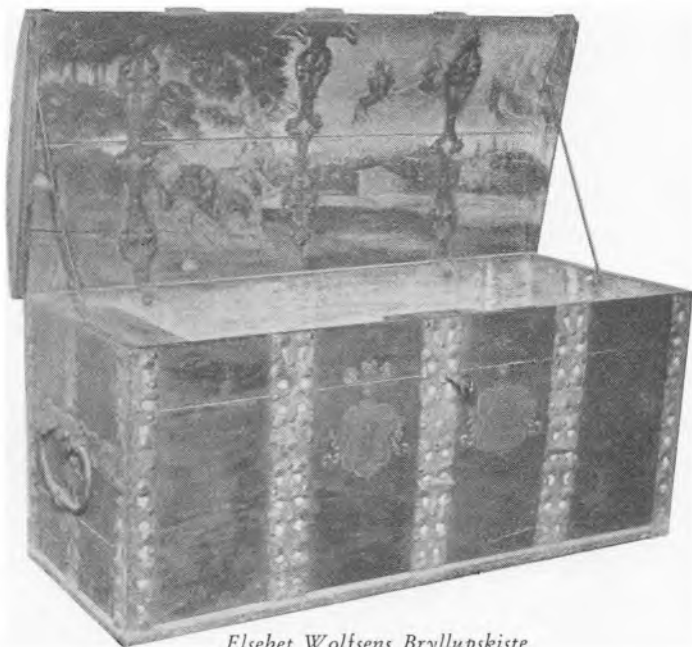
Elsebet Wolfsens Bryllupskiste

Født ca. 1667 † 19/2 1727, gift 1687 med Købmand i Svaneke Mads Poulsen Koefoed , f. 1663 † 21/10 1736 (Søn af Borgmester i Svaneke Poul Koefoed, hvis Vaabenmærke var en Kofod,