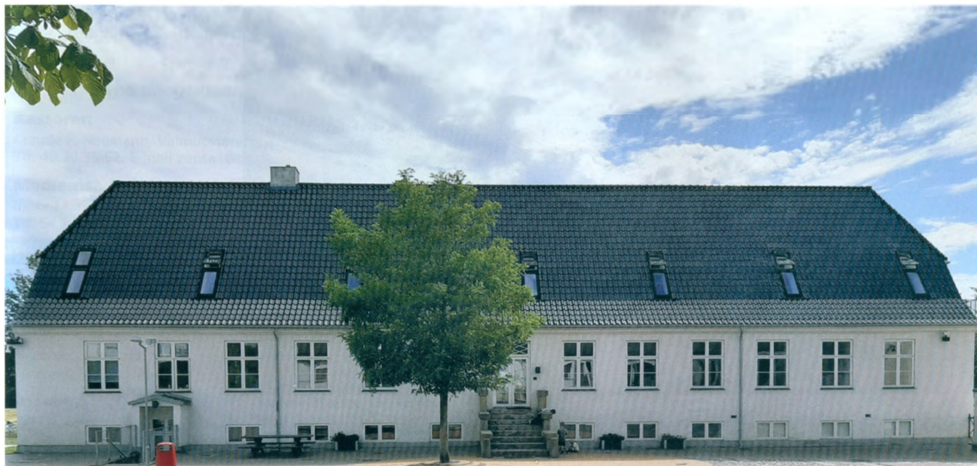
Sophienborg. Hovedbygningen set fra gården