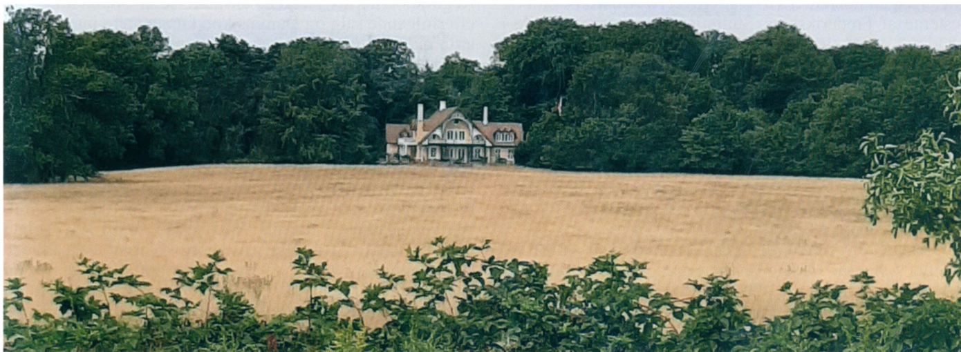
Strødam – C. F. Tietgens sommerresidens.