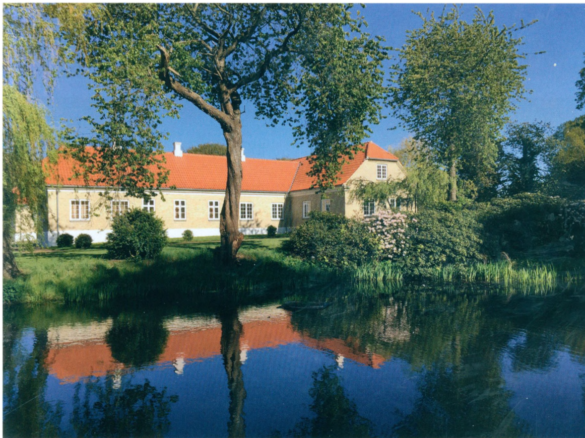
Ullerup Hovedgård, Hovedbygningen set fra øst.

al sin rette tilliggelse". (Der kan dog også være tale om Ullerupgaard nord for Limfjorden.)