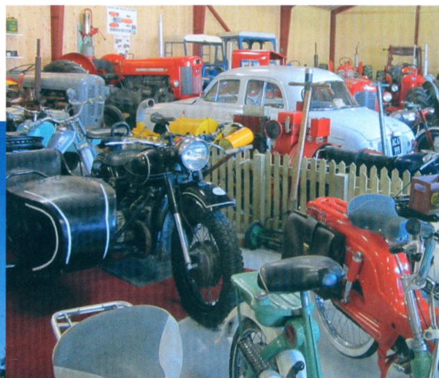
Kalumgård ved Brønderslev