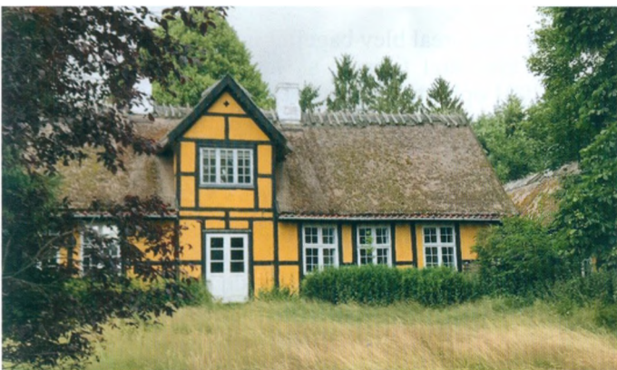
Dæmpegårds hovedbygning fra syd. En lettere tilgroet have.

I dag er Nordsjælland begunstiget med mange og forholdsvis store statsskove, hvoraf Gribsskov er den største. Naboer er Store Dyrehave med dens UNESCO-fredede parforcejagtlandskab, Ravnsholt Skov, Rude Skov og Hareskovene for blot at nævne nogle. Tokkekøb Hegn hører under Naturstyrelsen Hovedstaden og forvaltes fra skovridergården Boveskovgård i Jægersborg Dyrehave (neden for Eremitagesletten).