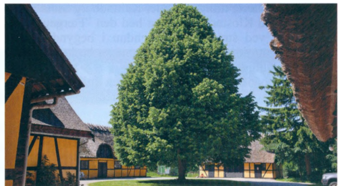
Mens Dæmpegård endnu var velplejet