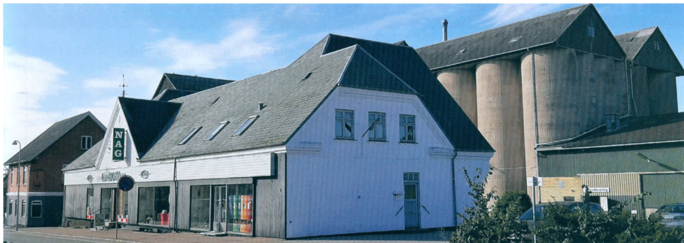
Helsingørse Andelsfoderstof 21 sept 2020

Mejerier, slagterier og grovvareforeninger blev herefter påbegyndte overalt i Danmark for at forbedre landmændenes vilkår og forbedre produkterne med renlighed og nye tekniske opfindelser. De bredte sig med imponerende hastighed, så mange har troet, at andelstanken var en dansk opfindelse. Brugser og senere frysehuse og vandværker blev også udbredte og landsdækkende i årene, der fulgte. Fiskeri, gartneri og pelsavl kom med på andelstanken.