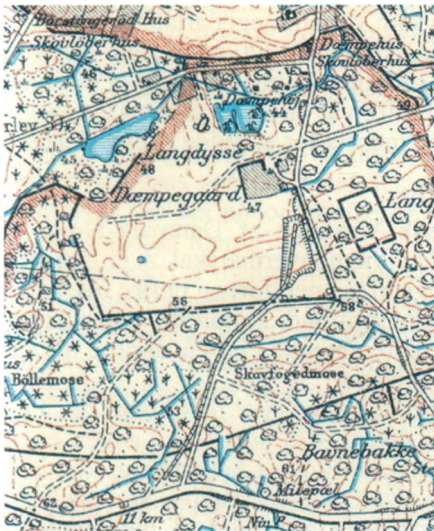
Dæmpegård på sletten i Tokkekøb Hegn. Målebordsblad 1947, som viser intensiv lergravning syd for skovridergården.