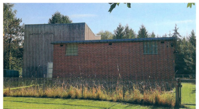
Alsønderup Vandværk 21 sept 2020

En virksomhedsform for fremtiden, baseret på det frie markeds omkostninger og demokratisk medlemspligt og -ret, uden udtagning af fortjenester fra andelsvirksomhedens medlemmer, der i utallige brancher kunne fjerne meget ulighed og spekulation og udnyttelse i alle lande.