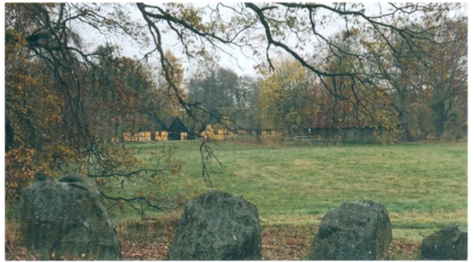
Dæmpegård, nabo til Kongedyssen, opkaldt efter Frederik 7., som åbnede langdysse i 1859.

Det er uvist, hvor gammel Lerelte landsby har været. Men at der har været bosættelser i området allerede ca. 3800-3400 f.v.t., bevidnes af Kongedyssen, der ligger kun 150 m fra Dæmpegård. Det er en 38 meter lang langdysse med to kamre fra bondestenalderen, som Frederik 7. åbnede i 1859 – og har givet navn til Frederik 7. Vej i området. Langdysse kaldes også Dæmpegårdsdysse og Palnatokes Grav. Der er under alle omstændigheder ingen tvivl om, at Dæmpegårds jorder var usædvanligt store for en skovridergård. Det nævnes flere gange i forbindelse med bemærkninger om den dyre indhegning af det mægtige område.