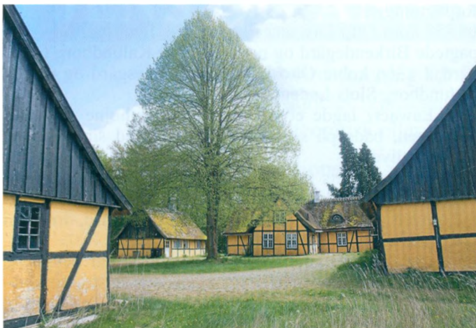
Dæmpegård med stort lindetræ på gårdspladsen