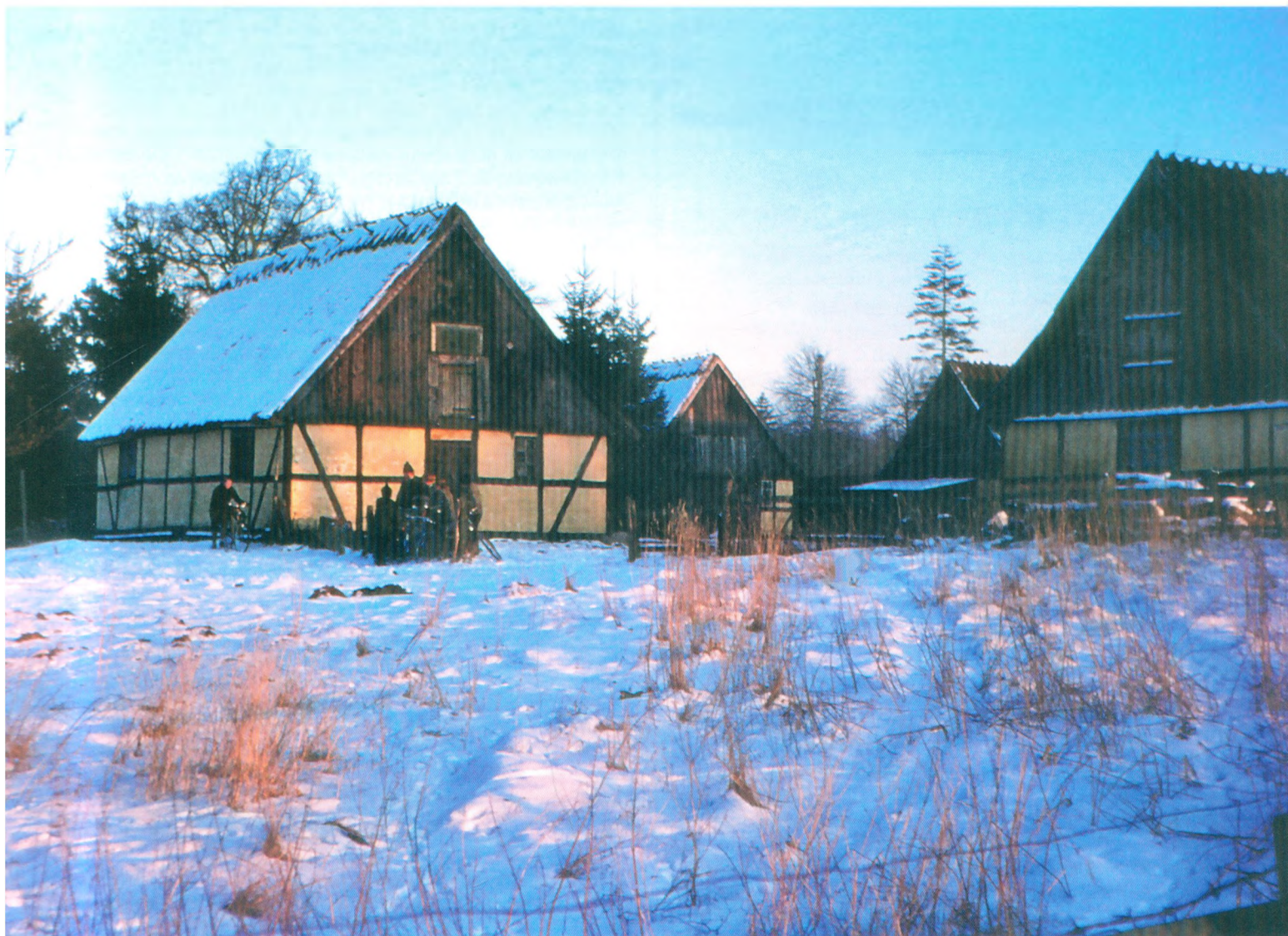
Dæmpegård i Tokkekøb Hegn