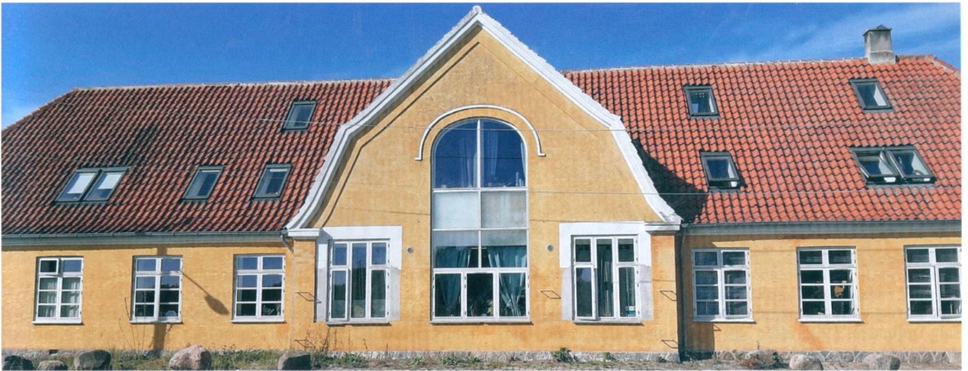
Harløse Gl Mejeri 21 sept 2020

Ja, selv forsikringselskaber og realkredit, sparekasser og banker blev oprettede som andelsselskaber. Undervisningspligt og højskoletilbud medførte bedre oplysning og indsigt, som gjorde de nye tanker tillidsvækkende og acceptable.