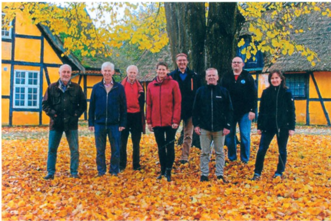
Bestyrelsen for Dæmpegårds Venner, klar til at arbejde.

Anvendelse af Dæmpegårds bygninger har ændret sig fra skovridergård til bolig for skiftende skovløbere. I de seneste årtier har anneksbygningen tjent som opholdsrum for skovarbejdere, men kun indtil for to år siden. Statskovvæsnet har i mellemtiden skiftet navn til Naturstyrelsen, som er en styrelse under Miljø- og Fødevareministeriet. Nu står gården ubenyttet hen. Da Naturstyrelsen er omfattet af meget restriktive regler for salg eller udlejning, er der intet sket i et par år. Derfor har Naturstyrelsen i foråret 2020 ansøgt Allerød Kommune om nedrivningstilladelse for alle fem stråtekte, gulkalkede bindingsværksbygninger, velvidende at hele Dæmpegårdssletten med kulturværdier indgår i naturfredningen.