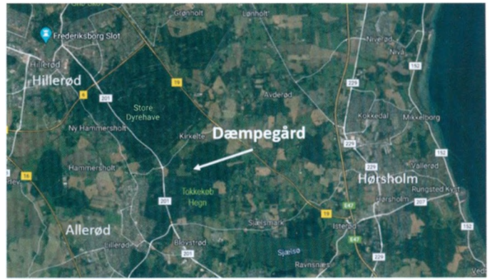
Dæmpegård i Tokkekøb Hegn. 1,5 km øst for Kongevejen.