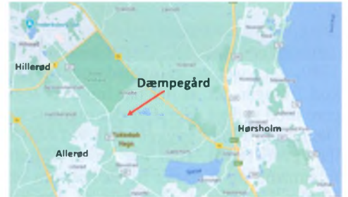
Dæmpegård i Tokkekøb Hegn. 1,5 km øst for Kongevejen.

Tokkekøb Hegn var kongens ejendom fra 1391 til 1771, hvor skoven blev statsejendom. Gennem disse århundreder blev skoven meget medtaget, idet bønderne havde ret til at tage træ i underskoven og lade deres husdyr græsse frit, bl.a. deres svin. Skoven blev brugt intensivt og kortsigtet, og med tiden kom der ikke ny skov efter den gamle. Landskabet havde mere præg af lysåbne græsgange med spredte, dårligt formede træer – en landskabstype, vi i dag betegner overdrev, og som var en meget artsfattig natur. På landsplan udgjorde skoven i 1700-tallet kun 2-3% af det samlede areal. Til sammenligning har vi i dag op imod 11% skov. Da træ samtidig var en af de vigtigste ressourcer, skulle der gøres en indsats for at redde skovvæksten.