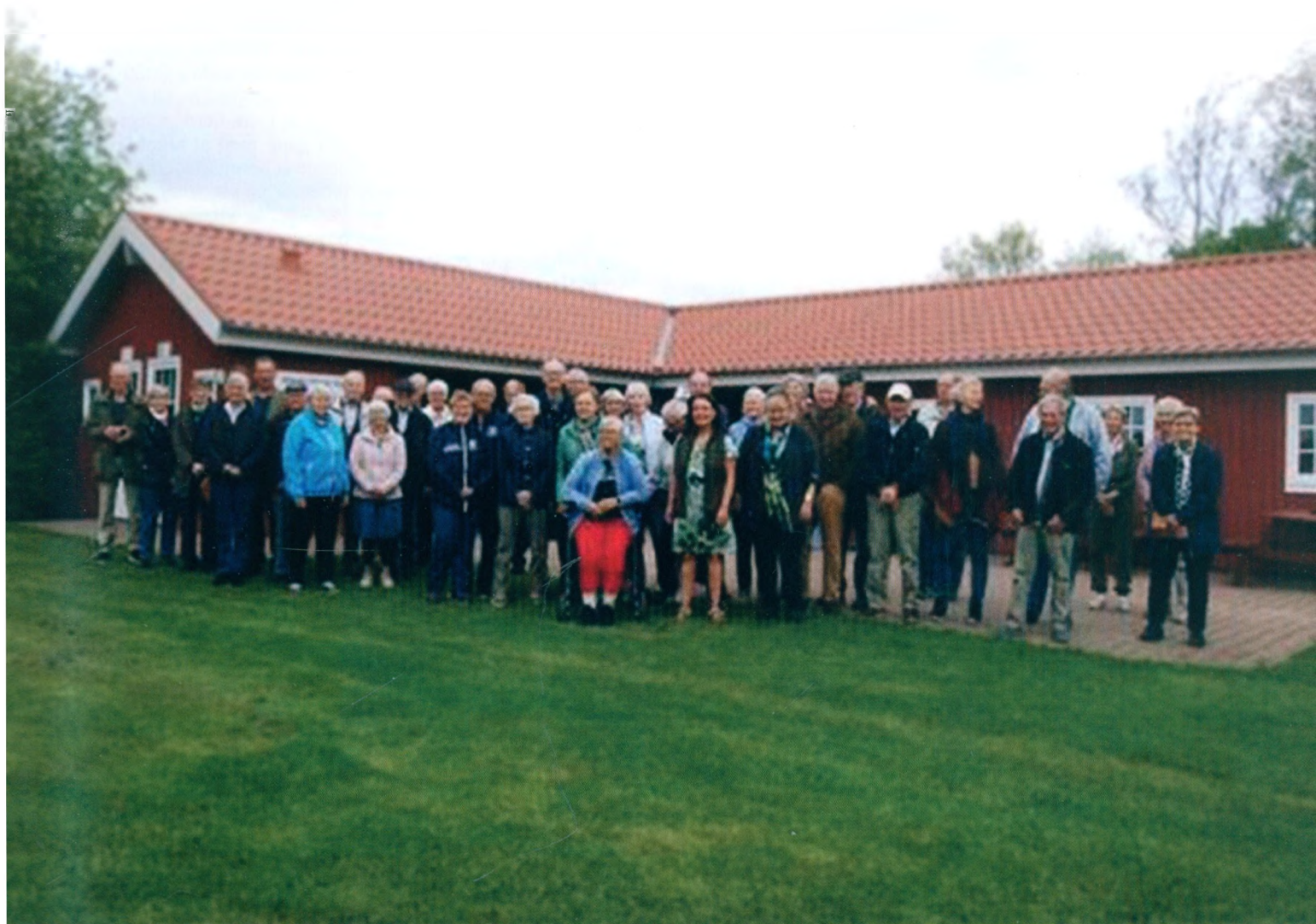
Årsmødedeltagerne forsamlet på Hybenvang