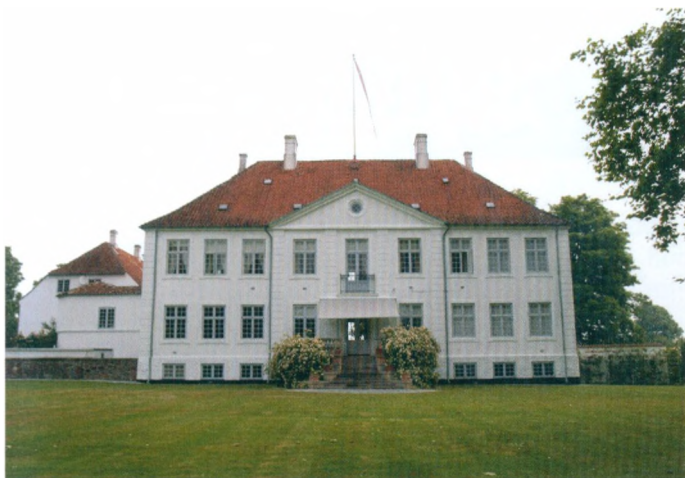
Petersgård. Hovedbygningen er opført i 1770-ernes slutning.