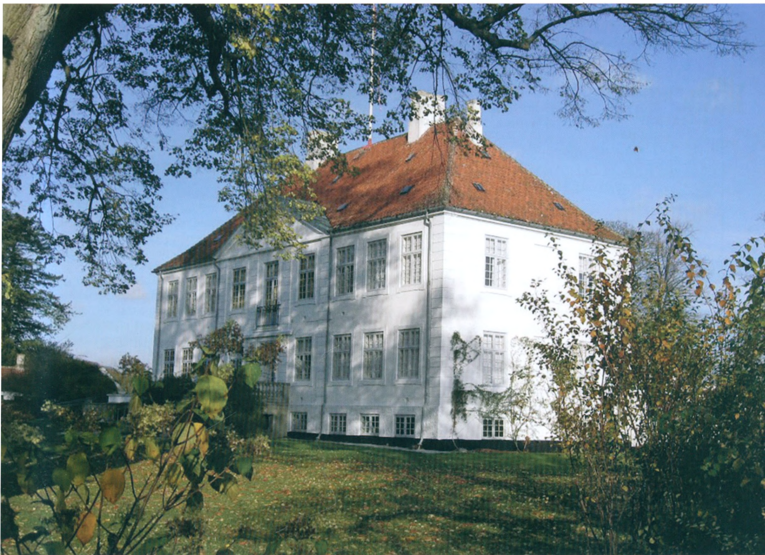
Petersgaard ved Kalvehave