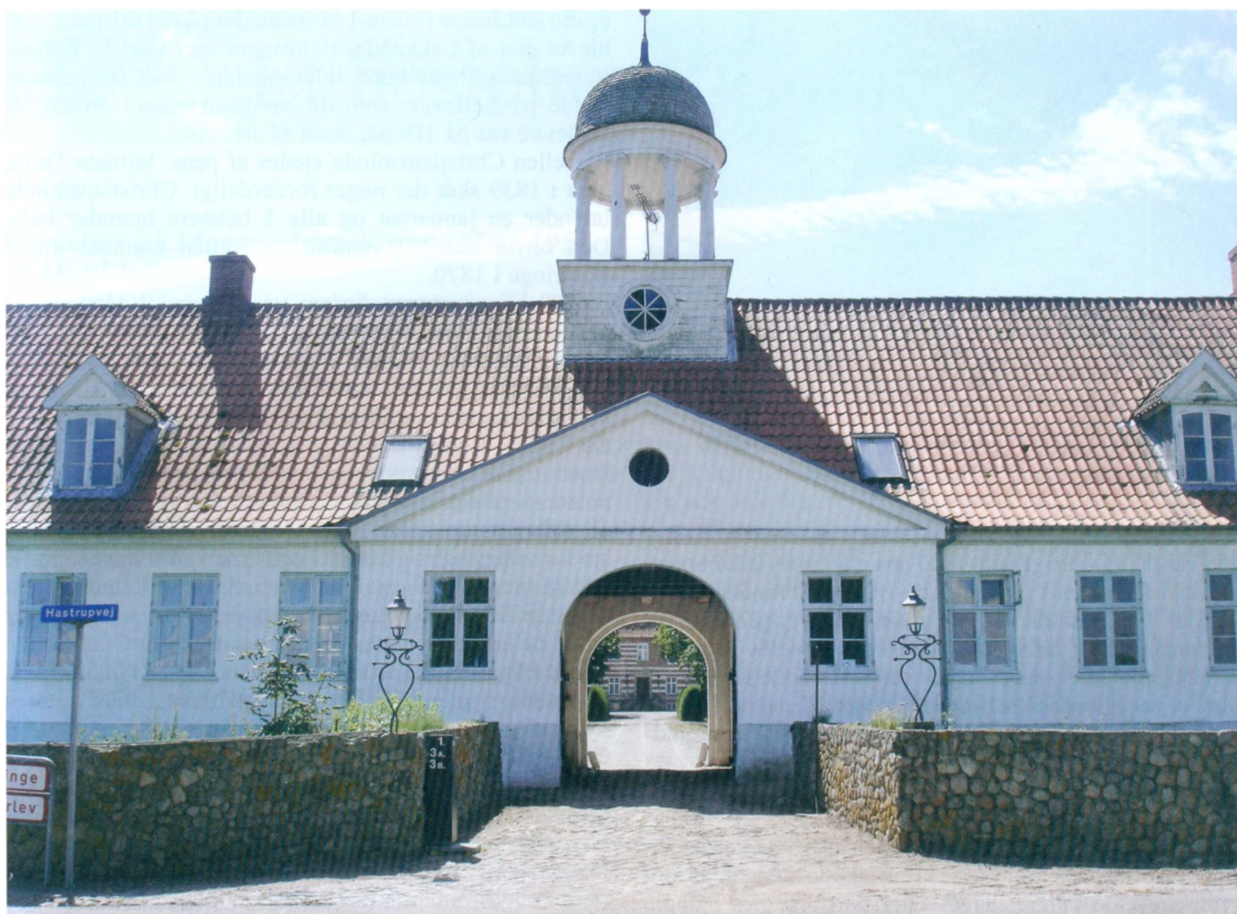
Portfløjen ved Beldringe.

I 1638 bliver Frederik Reedtz forpagter og dermed fast beboer på Beldringe.