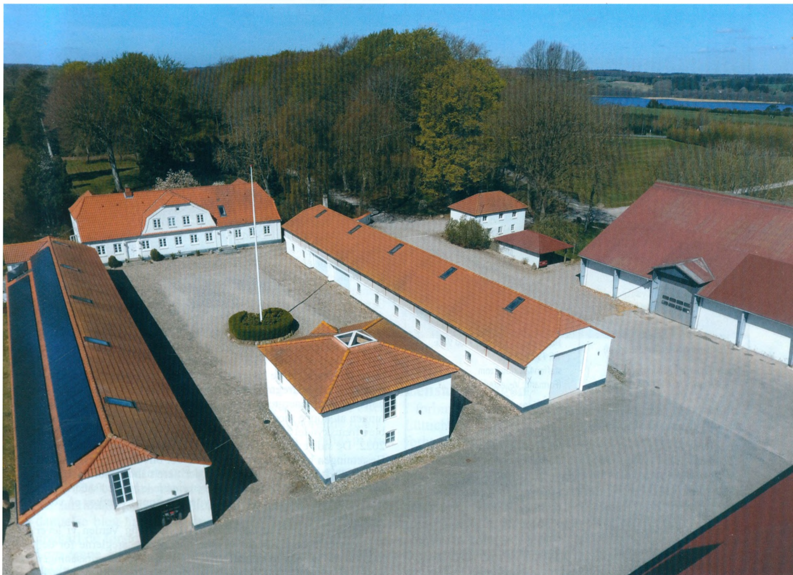
Karlslyst ved Tjele.