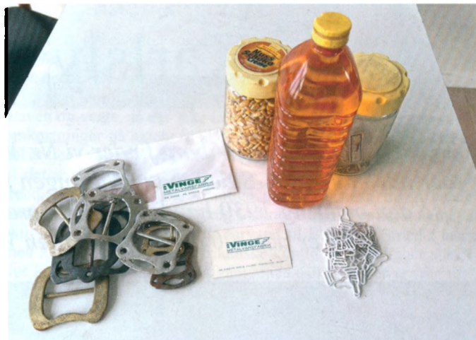
Produkterne fra "Vinge metalvarefabrik" samt olie fra gårdens tidligere rapsolieproduktion. Og majs fra udlejning af det store lager.