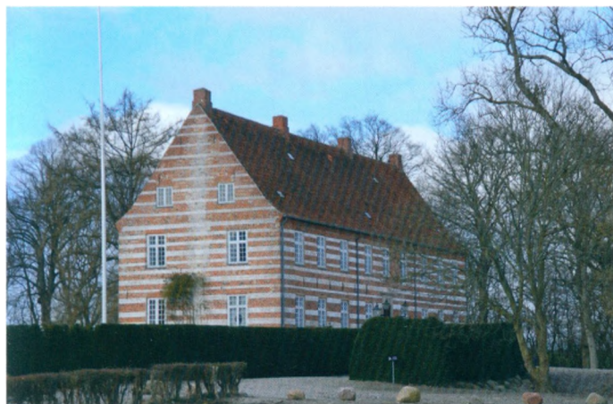
Hovedbygningen opført o. 1560.