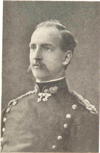
Kong Georg 1875.

Saa ankrede vi da og fortøjede i Piræus' Havn og fik vældigt travlt, for allerede næste Dag vilde Kongen komme ombord. Det var Chefen, der bragte den Besked. Han var straks taget op til Slottet i Athen for at hilse paa Kong Georg. Helst vilde Chefen have en