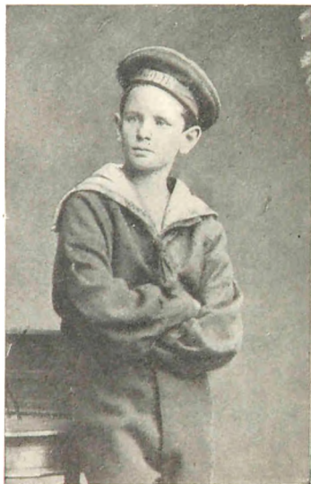
Frivillig Lærling 374.