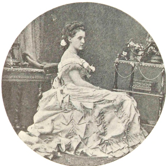
Dronning Olga 1875.