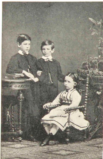
De tre Ældste 1871.

Ben og i Natskjorte, hvilket var en let Manøvre, for vi boede i en meget lav Stueetage. Da det var Vintertide, og jeg kom til at fryse gudsjammerligt, fik jeg vel Sygdommen som en retfærdig Straf for overvældende Uartighed.