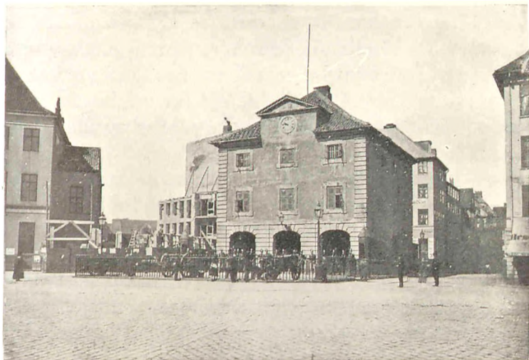
Den gamle Hovedvagt paa Kongens Nytorv.

Det rent materielle spiller i mine Øjne ikke nogen