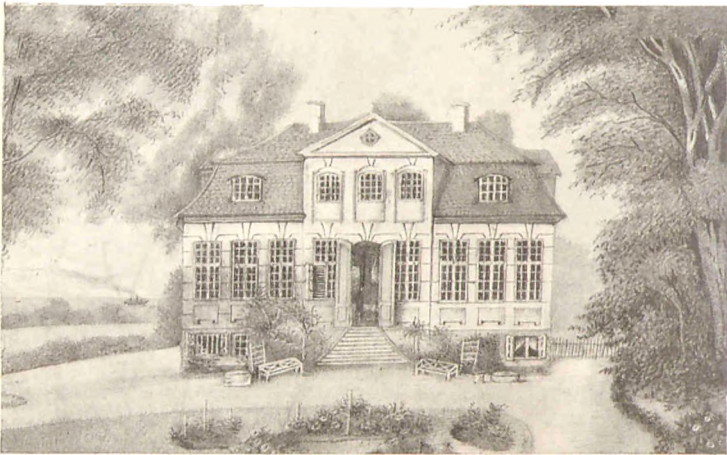
Christiansholm paa mine Bedsteforældres Tid. (Efter en gammel Pennetegning).

Man regnede det for en stor Begunstigelse at være blandt de Indbudne til Fru Hejbergs intime Dansefester; men udpræget morsomme var de just ikke.