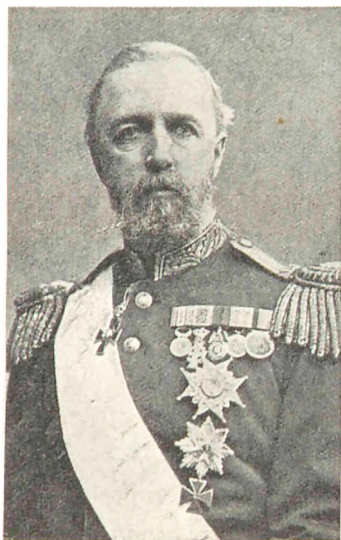
Kong Oscar II.