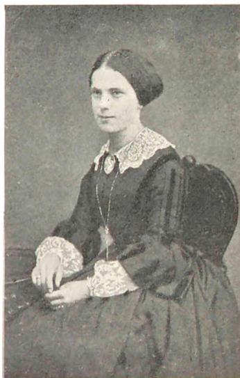
Min Mor 1862.