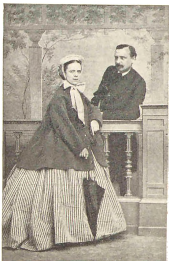
Mine Forældre 1868.

Da jeg begyndte min Skolegang, var Borgerdydskolen efter en Brand midlertidig flyttet til en Mellem-