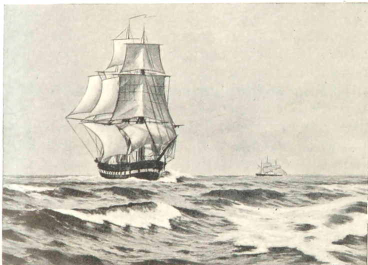
Fregatten Jylland i Nordsøen. (Efter et Maleri af Carl Locher).

Fregatten Jylland laa i Flaadens Leje ved Dokøen, klar til at hejse Kommando og stikke tilsøs. En skønne